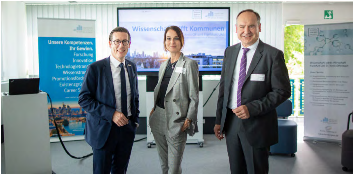
Wissenschaft trifft Kommune.