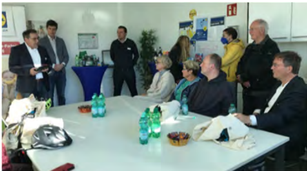
Impressionen von der Fairen Woche 2022: Faire Radtour und Fachtag „Faire KITA“.