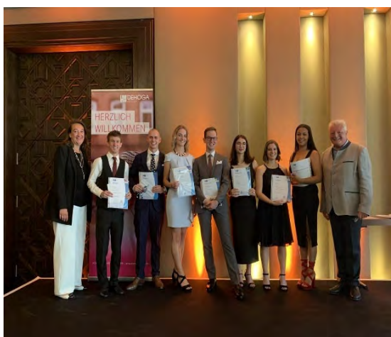
Freisprechungsfeier DEHOGA im Hotel Kempinski Gravenbruch.

Gemeinsam mit dem Deutschen Hotel- und Gaststättenverband DEHOGA führt die Wirtschaftsförderung Hotelklassifizierungen durch und beteiligt sich an den Freisprechungsfeiern für Auszubildende aus dem Kreis Offenbach. Die Wirtschaftsförderung übernimmt dabei die Rolle der örtlichen Tourismusorganisation. Pandemiebedingt gab es im Jahr 2022 keine Klassifizierung im Kreis.