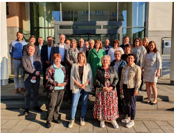
Treffen der Gewerbevereine in der IHK Offenbach am Main.

Die teilnehmenden Vereinsvertreterinnen und -vertreter erhalten Informationen zu relevanten Neuerungen in behördlichen Abläufen und können bei Bedarf unmittelbar Fragen an die Fachleute richten. Die Gewerbevereine geben das neuerworbene Wissen anschließend als Multiplikatoren an ihre Mitgliedsunternehmen weiter und ergänzen damit die bisherige Öffentlichkeitsarbeit von Standort Plus um eine wichtige Komponente.