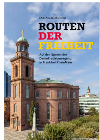
Buch „Routen der Freiheit“.

2022 wurde gemeinsam mit dem Societätsverlag das Buch „Routen der Freiheit – Auf den Spuren der Demokratiebewegung in FrankfurtRheinMain“ herausgegeben. Der Kreis Offenbach wird darin als Teil einer gemeinsamen Route mit den Städten Offenbach und Hanau genannt. Die Route wurde mit Hilfe des Kreises Offenbach ausgearbeitet und wird in 2023 touristisch buchbar umgesetzt. Das Buch ist auch im Kreishaus in Dietzenbach erhältlich.