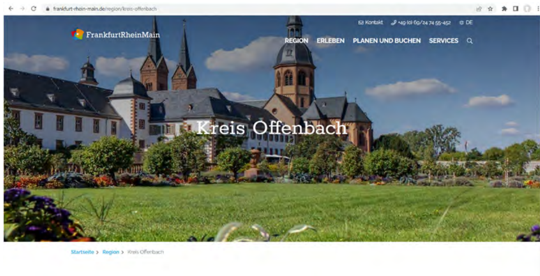
Screenshot www.frankfurt-rhein-main.de .