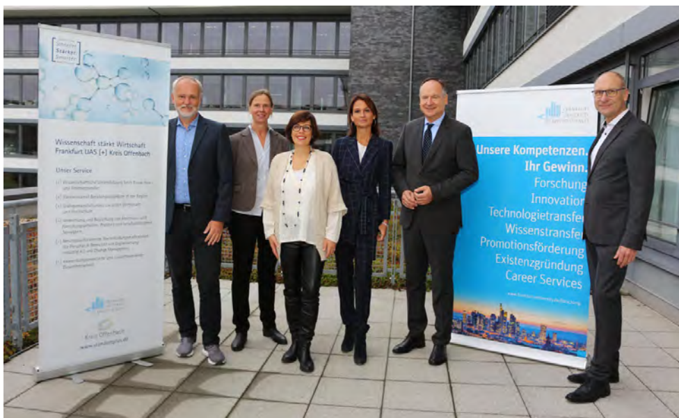
Beiratssitzung im Kreishaus Dietzenbach.

Am 18. Mai 2022 beteiligten sich fünf Unternehmen aus dem Kreis (Schmoll Maschinen, abass, esatus, ASB Lehrerkooperative, Videor) an der hochschuleigenen Karrieremesse meet@frankfurt-university und hatten die Möglichkeit, direkt mit den Absolventinnen und Absolventen ins Gespräch zu kommen.