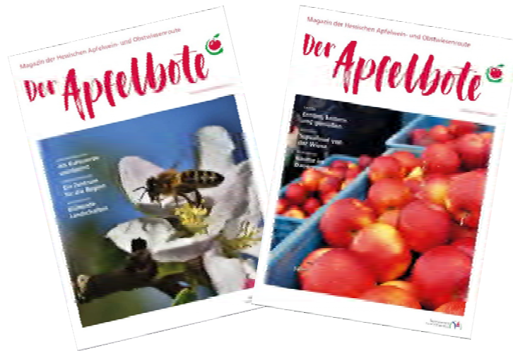
Ansichten verschiedener Ausgaben des Magazins „Der Apfelbote“ 2022.

Alle Mitglieder der Regionalschleifen haben die Möglichkeit ihre Aktionen und Veranstaltungen im Magazin zu bewerben.