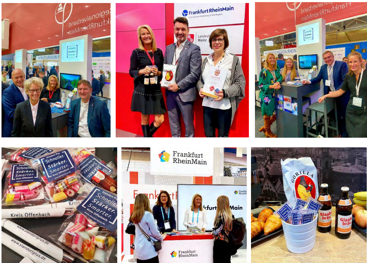
Impressionen der Messeteilnahmen.

2022 wurde die enge Zusammenarbeit zwischen den Wirtschaftsförderungen aller 13 Kommunen und des Kreises Offenbach sowie mit der Industrie- und Handelskammer Offenbach am Main und der Kreishandwerkerschaft Stadt und Kreis Offenbach im gemeinsamen Wirtschaftsförderungskonzept Standort Plus erfolgreich fortgesetzt. Dies spiegelte sich in der Teilnahme an zahlreichen Messen, wie der Immobilienmesse Expo Real, der Karrieremesse meet@frankfurt-university der Frankfurt University of Applied Sciences, der Frankfurter Tourismusmesse IMEX und der Internationalen Tourismusbörse in Berlin wider.