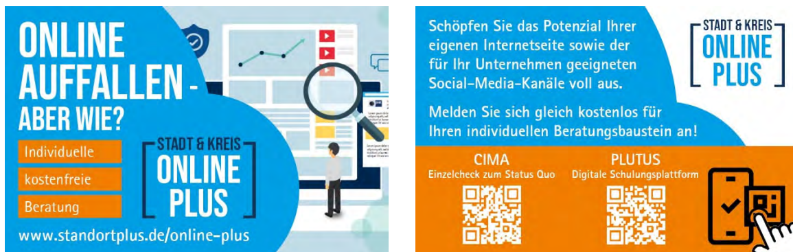
Vorder- und Rückansicht der Informationskärtchen im Visitenkarten-Format

Auf das Projekt „Stadt & Kreis Online Plus“ machten Informationskarten mit QR-Codes aufmerksam, die bei Veranstaltungen und Unternehmensbesuchen verteilt wurden. Darüber hinaus wurden die Unternehmen durch Pressemitteilungen, Presseberichte, Werbeanzeigen und persönliche Ansprachen über das Online-Paket informiert.