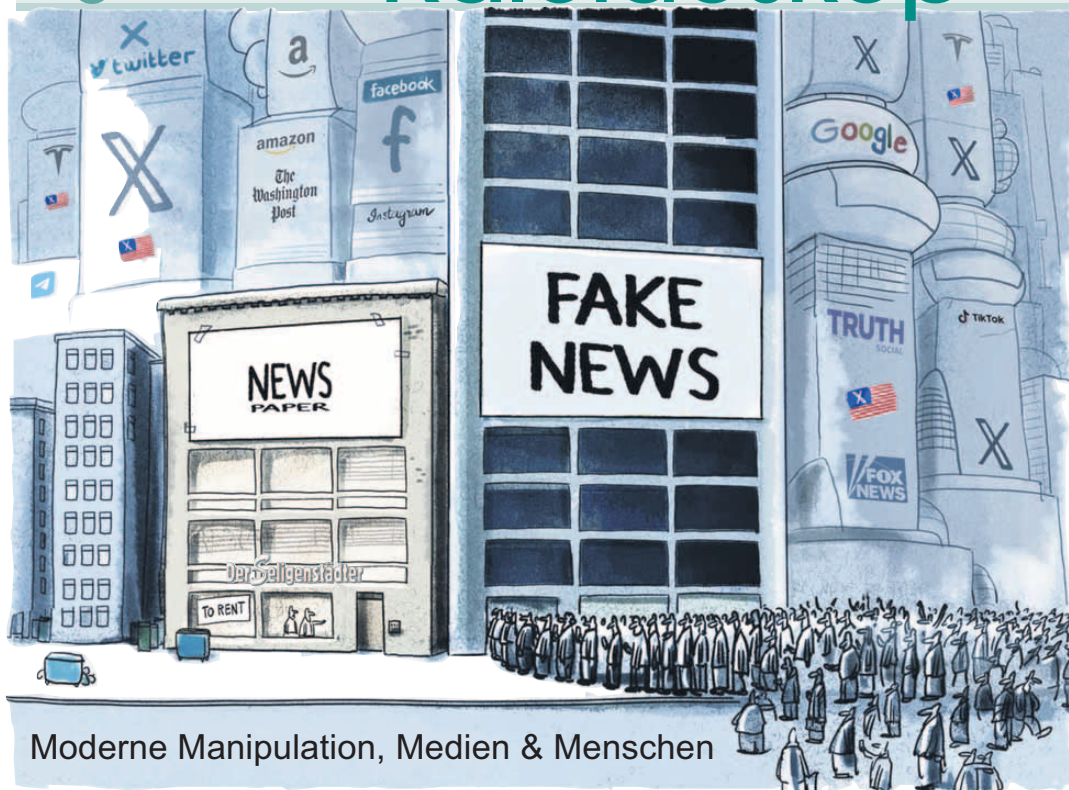
Moderne Manipulation, Medien &amp; Menschen