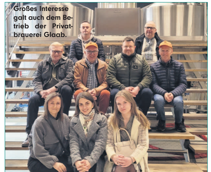
Großes Interesse galt auch dem Betrieb der Privatbrauerei Glaab.

Die nächste Spendenaktion ist für den 14. Juni 2025 geplant. Geldspenden für den Transport und den Kauf dringend benötigter Hilfsgüter können unter dem Kennwort „Ukraine“ auf folgendes Konto überwiesen werden: IBAN: DE97 5065 2124 0001 0022 29, Kontoinhaber: Kolpingsfamilie Seligenstadt Weitere Informationen gibt es unter: www.kolping-seligenstadt.de .