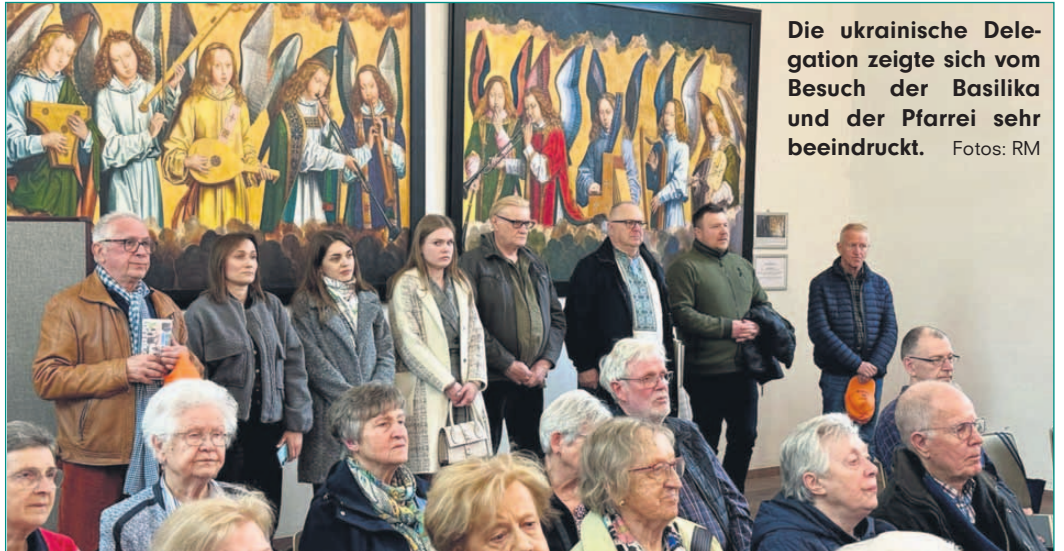
Die ukrainische Delegation zeigte sich vom Besuch der Basilika und der Pfarrei sehr beeindruckt.