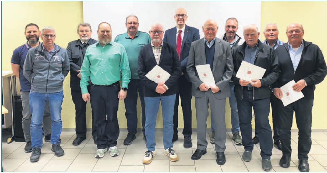
Vorstand und Jubilare der Klein-Welzheimer Feuerwehr.