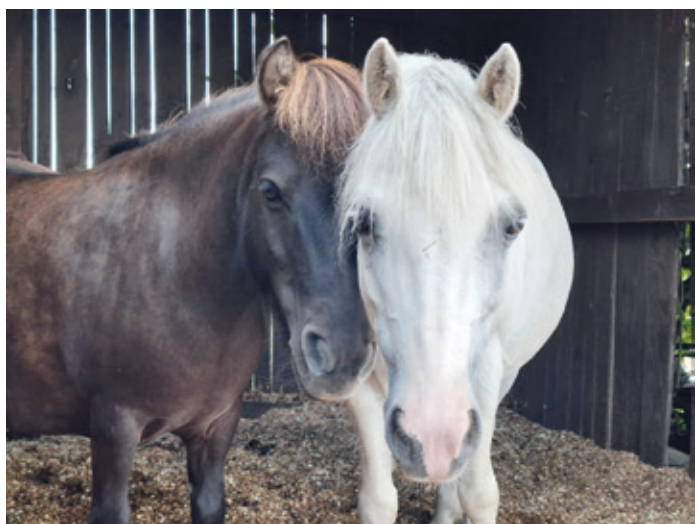
In den Ställen des Reit- und Fahrvereins Arheilgen sind Ponys aller Größen zuhause.

Arheilgen (sj). Zu einem Ponytag lädt der Reitverein Darmstadt-Arheilgen am 1. Mai auf seine Anlage an der Steinstraße 41 ein.