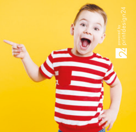
powered by printdesign24