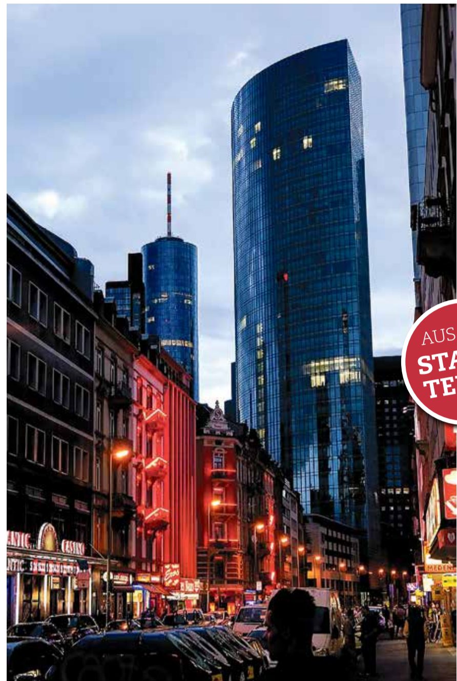
Das Bahnhofsviertel am Abend

Nur ein paar Gehminuten vom Bahnhofsviertel entfernt liegt das Mainufer – der perfekte Ort zum Durchatmen. Hier lässt sich das geschäftige Treiben von der anderen Seite betrachten: die Skyline glitzert, Boote ziehen vorbei, und die Promenade füllt sich mit Spaziergängern, Radfahrern und Picknick-Fans. Besonders abends, wenn die Sonne