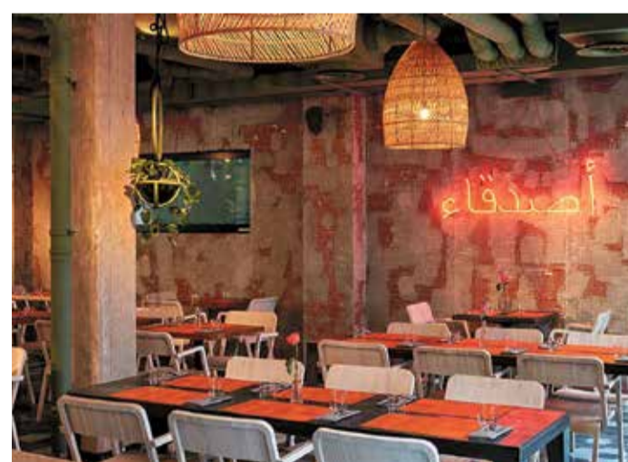
Hier verbringt man gerne seinen Abend