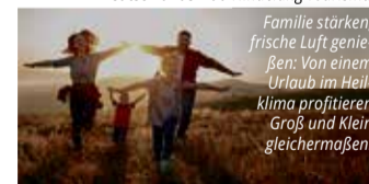
Familie stärken, frische Luft genießen: Von einem Urlaub im Heilklima profitieren Groß und Klein gleichermaßen.