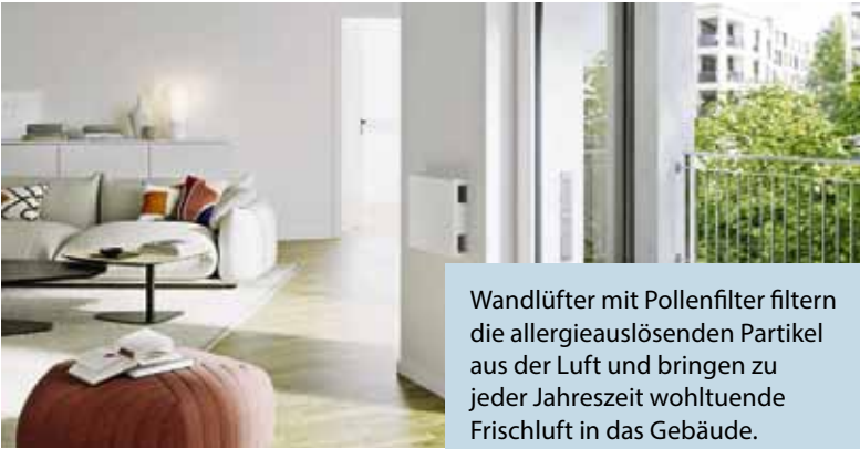
Wandlüfter mit Pollenfilter filtern die allergieauslösenden Partikel aus der Luft und bringen zu jeder Jahreszeit wohltuende Frischluft in das Gebäude.

Intelligente Lüftungstechnik: Wie Pollenfilter für saubere Atemluft sorgen