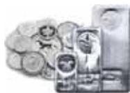
Silbermünzen und -barren