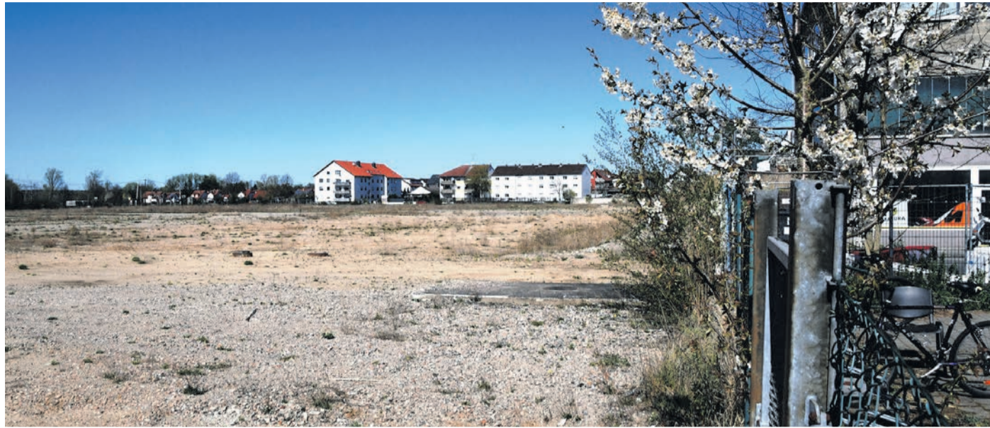
Blick über das abgebrochene Frankenbach-Gelände im Münsterer Südwesten. Vor dem rechts im Bild angeschnittenen Gebäude endet die Goebelstraße derzeit am Tor. Sie soll aufs Areal fortgeführt werden und dort in einen Wendehammer münden.

Münster (jedö) Vier Hektar Hoffnung bietet das ehemalige Gelände der Firma Frankenbach zusammen mit mehreren Nachbarflächen im Münsterer Südwesten. Im Auftrag der Gemeinde erwarb die Hessische Landgesellschaft 2019 und 2022 die entsprechenden Grundstücke, die nach dem momentanen politischen Mehrheitswillen zu einem fast reinen Gewerbegebiet (mit einem kleinen Mischgebiet im nördlichen Teil) entwickelt werden sollen. Dies soll langfristig die wirtschaftliche Potenz Münsters stärken, wo das Pro-Kopf-Aufkommen der Gewerbesteuer zu den niedrigsten im Landkreis zählt. In der jüngsten Gemeindevertreter-Sitzung füllten die Fraktionen von CDU, FDP, SPD und ALMA-Die Grünen einen ein-