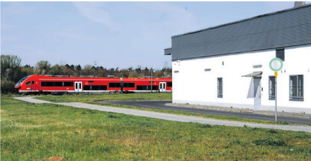
Aus diesem Schotterweg am Münsterer Edeka-Markt soll eine Erschließungsstraße fürs Frankenbach-Gelände werden. Dafür machten nun auch die Dieburger Stadtverordneten den Weg frei. Teile des Gebiets liegen auf Dieburger Gemarkung. Hinten im Bild: ein Zug auf der Bahnstrecke zwischen Münster und Dieburg.

Auf Aufforderung der örtlichen CDU hat die Münsterer Wirtschaftsförderin kürzlich unterdessen bei allen Unternehmen in der Gemeinde den Bedarf an Flächen auf dem Frankenbach-Gelände abgefragt. Ergebnis: 24 Firmen zeigen Interesse. Die Nachfrage reicht von Parzellen mit weniger als 1000 Quadratmetern bis hin zu Flächen von mehreren tausend Quadratmetern Größe.