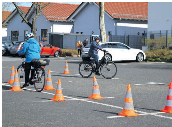
Schon 2023 kam das Pedelec-Training auf dem Abtenauer Platz sehr gut an.

Münster (MA) In Kooperation mit der Polizei Hessen und „Adam's Radladen“ lädt die Gemeinde Münster für Donnerstag, 8. Mai, um 14 Uhr zu einer kostenlosen Pedelec-Schulung für Seniorinnen und Senioren ein. Veranstaltungsort ist der Abtenauer Platz. Hier wird allen Interessierten der richtige Umgang mit den schnellen, elektrisch unterstützten Fahrrädern näher gebracht und erläutert, auf was zu achten ist, wenn man mit einem durchschnittlichen Tempo von 20-25 km/h unterwegs ist und welche Gefahren dies auch mit sich bringt. Alles Erlernte kann auf einem großzügig abgesperrten Bereich des