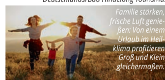
Familie stärken, frische Luft genießen: Von einem Urlaub im Heilklima profitieren Groß und Klein gleichermaßen.