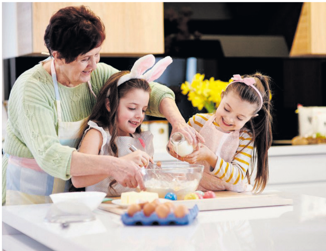
Für Kinder gehört das Backen süßer Leckereien zur Osterzeit mit dazu.

Für alle, die es zu Ostern etwas gesünder mögen, lassen sich klassische Rezepte problemlos abwandeln. Statt Weißmehl kann etwa Vollkornmehl oder eine Mischung aus verschiedenen Mehlsorten verwendet werden, um die Backwaren ballaststoffreicher zu gestalten. Zucker lässt sich durch natürliche Süßstoffe wie Honig oder Agavendicksaft ersetzen, sodass das Ostergebäck nicht nur genussvoll, sondern auch nährstoffreicher wird.