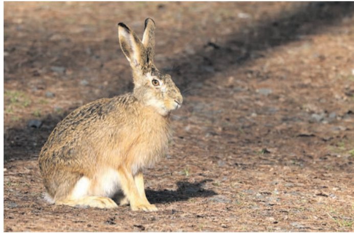
Osterüberraschungen gibt es am Ostermontag in die „Alte Fasanerie“.

Familien mit Kindern können zu einer Hasen-Suchralleye durch den Wildpark aufbrechen. Der Wildpark verteilt die Quizbögen vormittags über eine Mitmach-Station an der Festwiese und bei Beteiligung an einer Verlosungsaktion bestehen Chancen, einen Kuschelhasen aus dem Wildpark-Shop zu gewinnen. Bei trockenem Wetter bietet das Walderlebnis-Team für Kinder auf der Festwiese weitere Bastel- und Bewegungsstationen aus der „Häschen-Schule“ des Wildparks an; um 11 und um