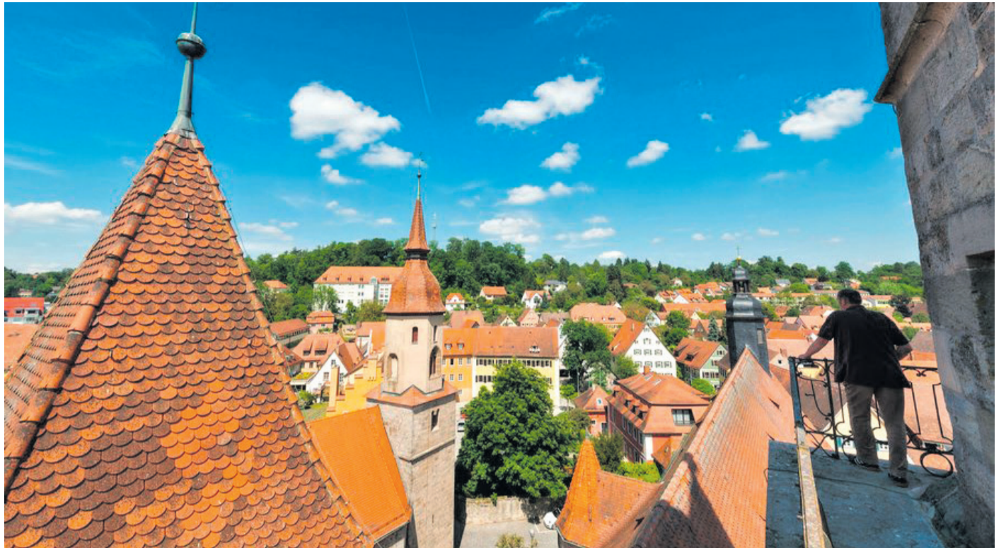
Die malerische Stadt Feuchtwangen vom Kranzturm aus betrachtet.

Feuchtwangen selbst ist ein Paradebeispiel für fränkische Kultur: Neben dem Fränkischen Museum machen die charmante Altstadt mit ihrem malerischen Marktplatz, die imposante Stiftskirche, das Sängermuseum und nicht zuletzt das berühmte Freilichttheater mit den Kreuzgangspielen den Ort zu einem lohnenden Reiseziel. Seit 1949 wird vor den romanischen Arkaden des ehemaligen Klosters professionelles Theater gespielt. Zusätzlich findet dort die Reihe KunstKlang statt: Eine Konzertreihe, die die renommierte und mehrfach ausgezeichnete Sopranistin Christiane Karg konzipiert hat und zu der sie regelmäßig internationale Künstlerinnen und Künstler einlädt.