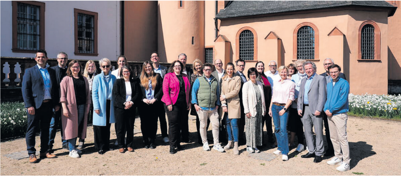
Die Vertreterinnen und Vertreter der Wirtschaftsförderungen des Kreises, der 13 Kommunen sowie der IHK Offenbach am Main trafen sich zur diesjährigen Klausurtagung von Standort Plus in Seligenstadt.