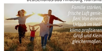
Familie stärken, frische Luft genießen: Von einem Urlaub im Heilklima profitieren Groß und Klein gleichermaßen.

Spielraum für Bewegung – Urlaub im Heilklima ist ein Gewinn für Groß und Klein