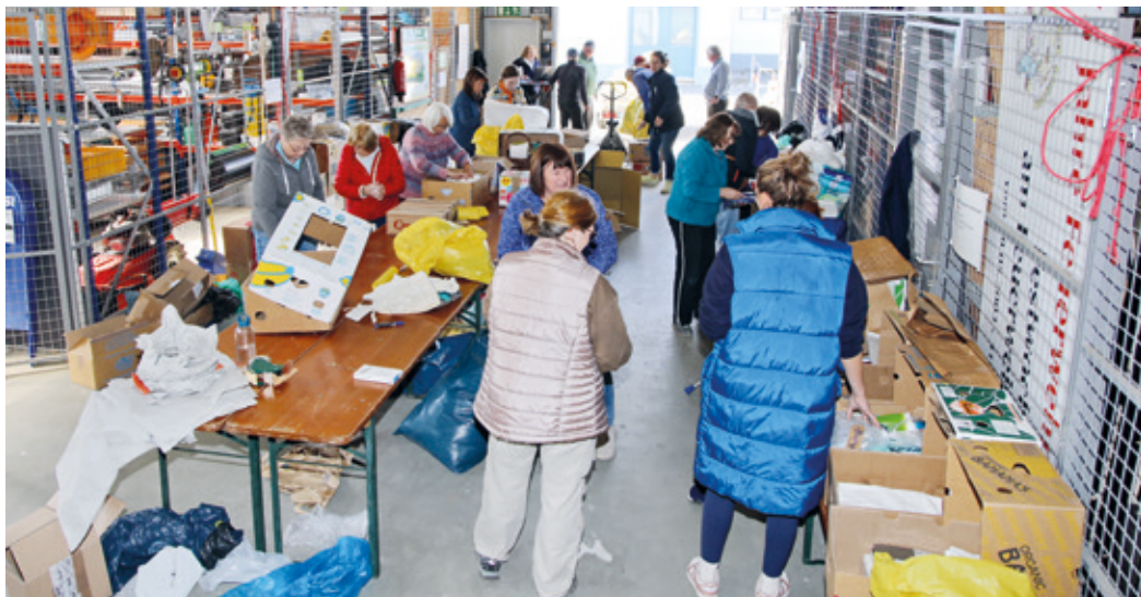
Die ehrenamtlichen Helfer haben bereits viel Erfahrung im Prüfen, Sortieren, Umpacken, Wiegen und Auflisten der Spendengüter.

Der Verein Vergiss-Mein-Nicht e.V. zusammen mit der Gemeinde Erzhausen sammelte wieder an der Halle der Vereine