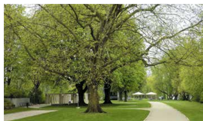
Blick von der Mitte des Parks aus nach Westen

Ein beeindruckendes Barockgebäude aus dem 18. Jahrhundert. Ursprünglich als Baumwollfabrik errichtet, diente es später als Guts-