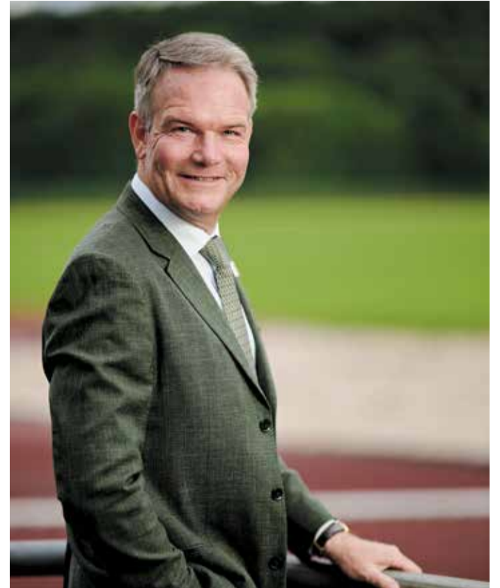
Deutsche Olympische Gesellschaft (DOG), Präsident Gregor von Opel.

ein neuer „Goldener Plan“ zur Sanierung und zum Ausbau von Sportinfrastruktur. Die DOG verweist auf alarmierende Entwicklungen: fehlende Hallenzeiten, marode Anlagen, rückläufiges Vereinsleben. Eine moderne Infrastruktur sei die Grundlage für eine sportlich aktive Gesellschaft – unabhängig von Herkunft, Alter oder Wohnort. Besonders im Fokus stehen Kooperationen mit Schulen, Vereinen und Kommunen. Frühzeitige Zugänge zum organisierten Sport, Bewegung im Schulalltag und niedrigschwellige Angebote für Familien sollen dazu beitragen, Bewegungsmangel und sozialen Rückzug entgegenzuwirken. Die DOG sieht hierin eine gesamtgesellschaftliche Aufgabe – und eine Chance, Bildung, Gesundheit und Gemeinsinn nachhaltig zu verbinden. Die DOG hat ihren Sitz in Frankfurt. Von hier aus will sie die Idee eines modernen, aktiven Sportlandes weitertragen – regional verankert, aber mit bundesweiter Strahlkraft.