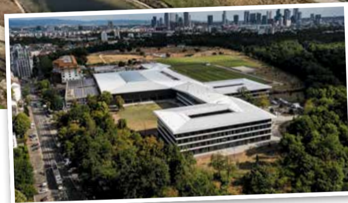
Der DFB Campus