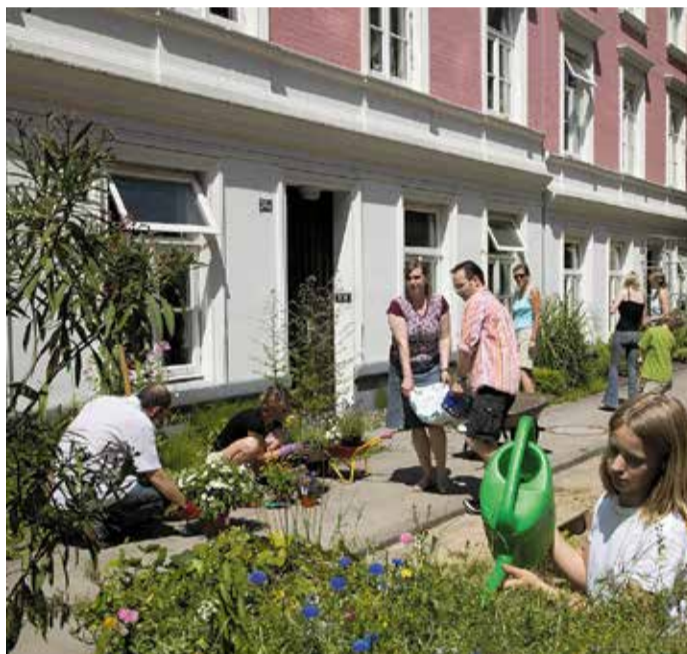
„Jede Wiese zählt!“

Das Konzert wird eine gute Gelegenheit sein, den Originalklang der Klassik zu erleben und ein Instrument, das heute ziemlich vergessen ist, wieder zu entdecken. Der Eintritt ist frei.