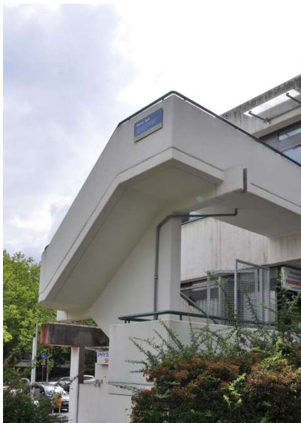
Abb. 34: Sanierte Treppenanlage Kickboxstudio, 2017

Fördermittel 'Soziale Stadt': ca. 273.537 EUR