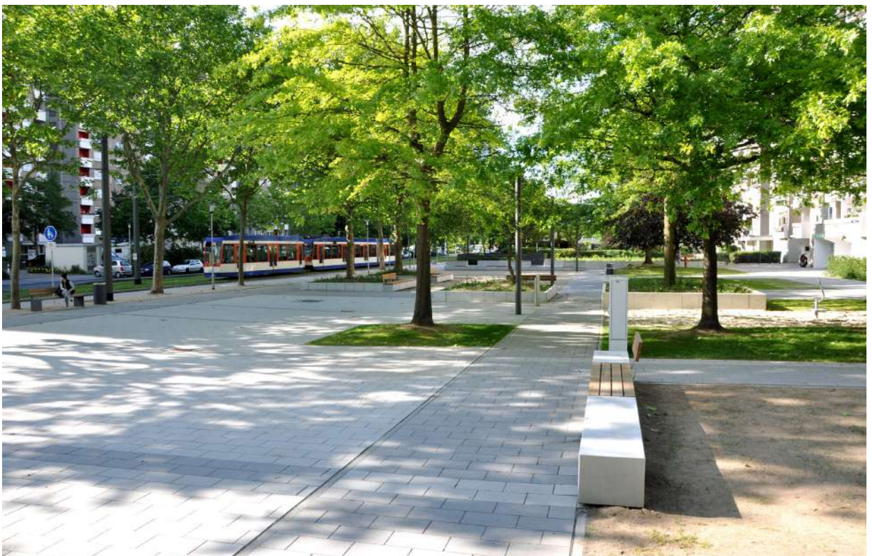
Abb. 27: Stadtplatz 'Neue Mitte', 2015