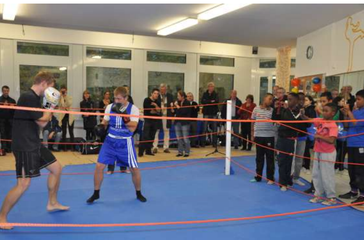
Abb. 33: Kickboxstudio, 2012