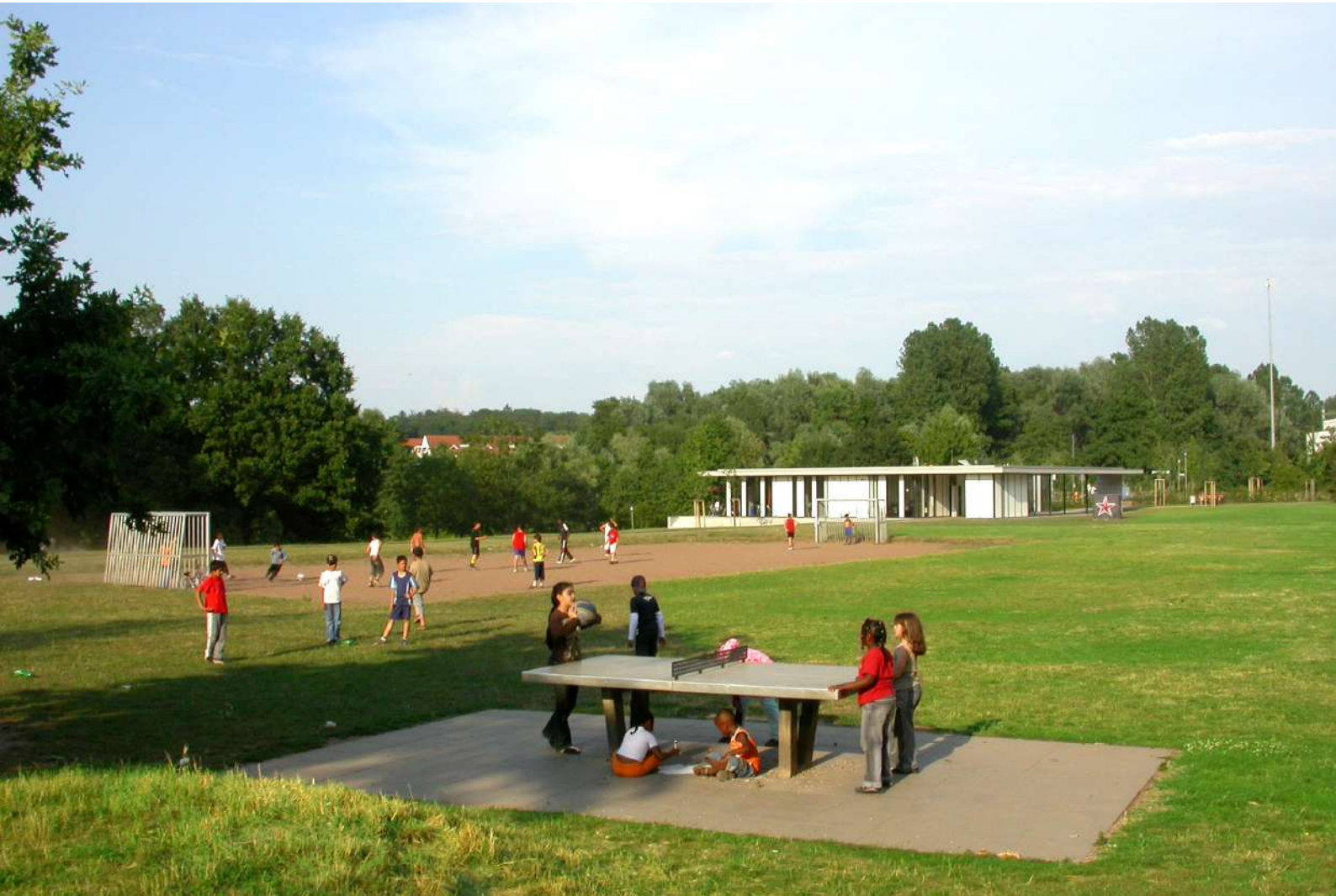
Abb. 16: Brentano-Anlage, 2006