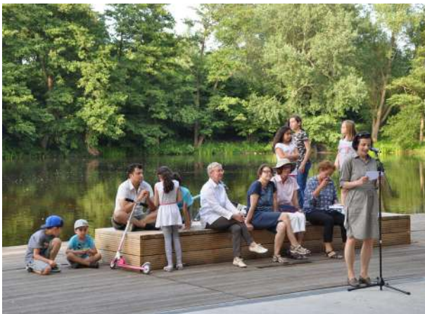
Abb. 86: Kulturrrgang mit Einweihung Sonnendeck, 2018