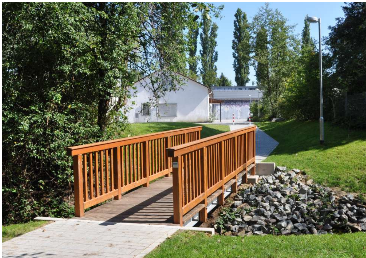
Abb. 66: Brücke über den Ruthsenbach, 2011