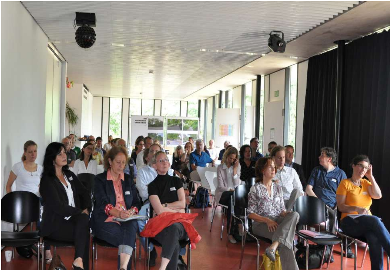
Abb. 81: HEGISS Arbeitstreffen, 2014

Ein wichtiger Teil der Öffentlichkeitsarbeit war auch die Vorstellung abgeschlossener Projekte im Rahmen von Eröffnungen, Festen, Rundgängen sowie Tagen der offenen Tür.