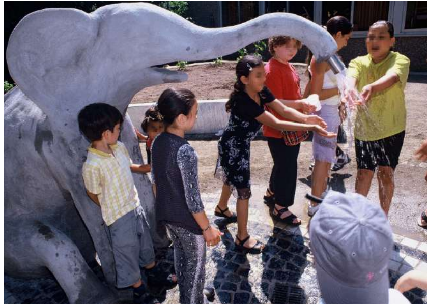
Abb. 54: Wasserspiel, 2002

Die Erich Kästner-Schule (EKS) mit zwei Standorten in Kranichstein bietet Kindern die Möglichkeit, von der Vorklasse bis zum Ende der 10. Klasse an einer Schule zu verbleiben. Ein zentraler Bestandteil des schulischen Profils ist die Öffnung der Schule zum Stadtteil sowie die enge Zusammenarbeit mit Institutionen und Vereinen. Ein herausragendes Beispiel für die Vernetzung ist die Gestaltung des Schulhofes der Grundschule und die Errichtung von Spielstationen auf dem Verbindungsweg zwischen Grundschule und Integrierter Gesamtschule (IGS).