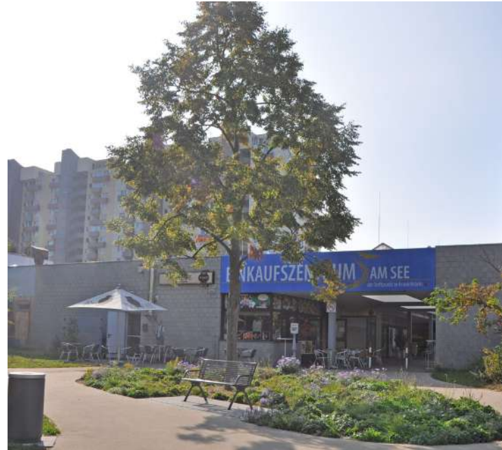
Abb. 38: Blick auf das Einkaufszentrum am See von Süden

Nichts lag daher näher, als die langjährig als Rück- seite des EKZ empfundenen Freiflächen am Grün- zug entlang der Seenkette neu zu gestalten. Heu- te laden geschwungene Wege, amorph gestaltete Vegetationsflächen und neue Sitzgelegenheiten zum Verweilen ein. Seit der Neugestaltung wird auch der Weg entlang des nicht gefluteten mitt- leren Sees zwischen der Brentano-Anlage und dem Erich-Kästner-See intensiv genutzt.