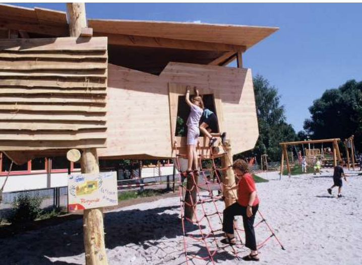
Abb. 53: 'Das fliegende Klassenzimmer', 2002

Die Schaffung einer guten Lernumgebung vom Kindes- bis zum Erwachsenenalter war ein Kernanliegen der Städtebauförderung. Mit Investitionen in die Bildungseinrichtungen und ihr Umfeld wurde nicht nur das Bildungsangebot deutlich erweitert, sondern auch die Teilhabe am sozialen, ökonomischen und politischen Leben gefördert.