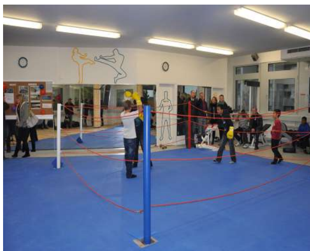
Abb. 35: Sanierter Innenraum Kickboxstudio, 2012