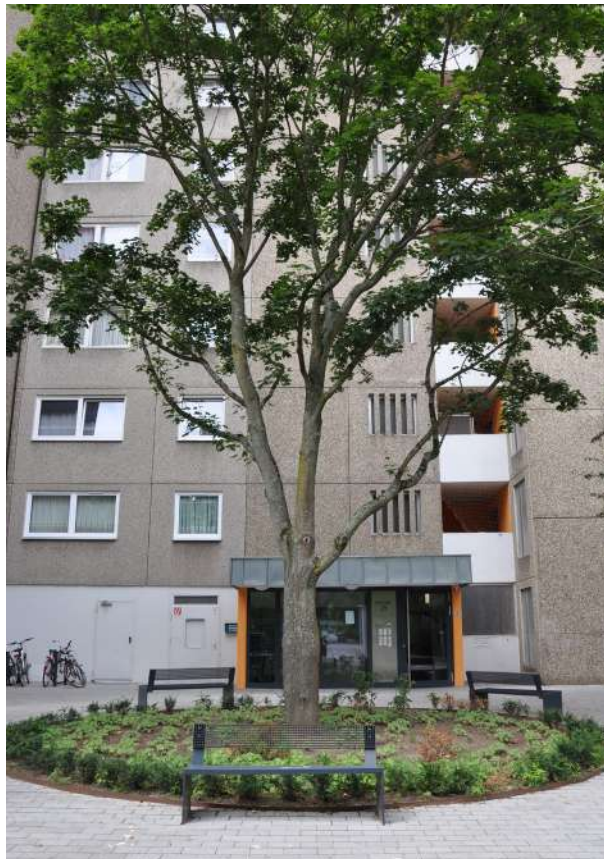
Abb. 45: Einladender Treffpunkt

Auch die im Besitz der GWH befindlichen Wohngebäude in der Mirjam-Pressler-Straße (ehemals Grundstraße) wiesen erhebliche Mängel in der Gestaltung sowie im Sicherheitsgefühl der Bewohnenden auf. Durch gezielte Maßnahmen wie die Neugestaltung und Öffnung der Eingänge, die Verbesserung der Beleuchtung sowie die Modernisierung der Briefkasten- und Sprechanlagen wurde eine grundlegende Aufwertung der Eingangsbereiche erreicht.