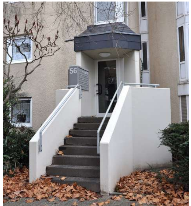
Abb. 48: Hauseingang Quartier K 4