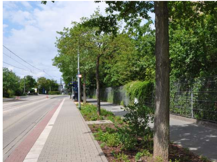
Abb. 77: Straßenbegleitgrün Siemensstraße, 2017