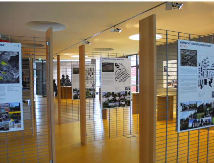
Abb. 78: Ausstellung 'Kranichstein nach Ernst May', 2007

Fördermittel 'Soziale Stadt': ca. 83.628 EUR