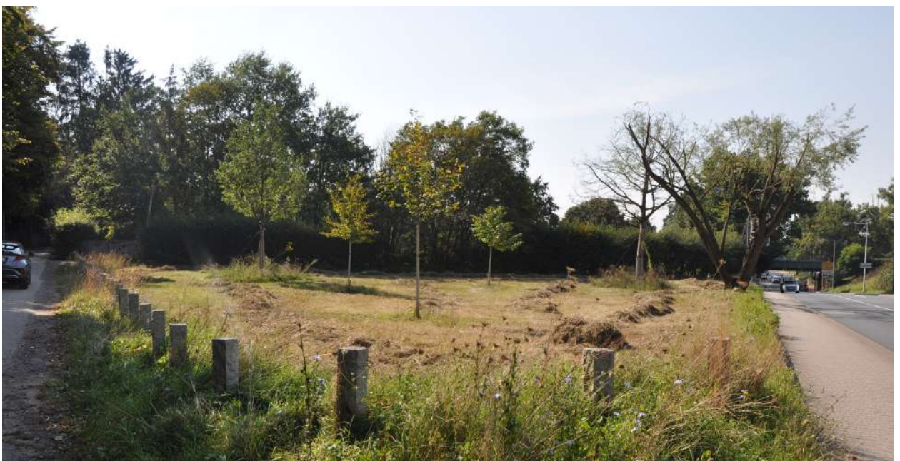
Abb. 52: Neugestaltung des westlichen Stadteingangs, 2024