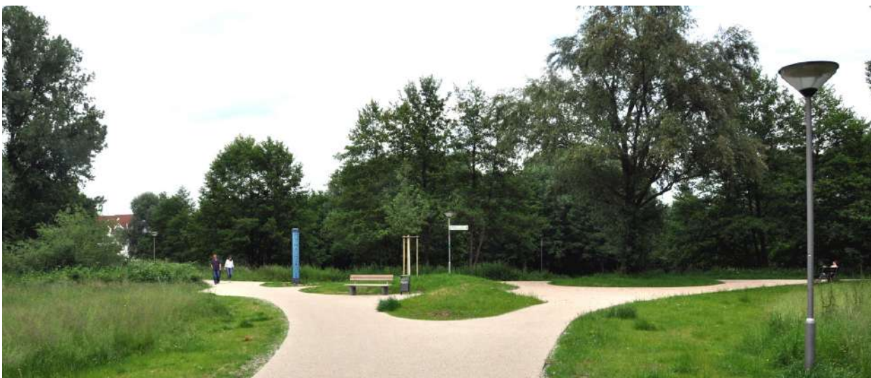
Abb. 60: Grünanlage zwischen Kita Am See und Grundschule

Fördermittel 'Soziale Stadt': ca. 130.982 EUR