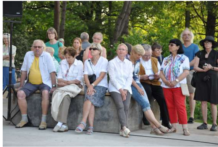
Abb. 15: Kulturrundgang und Einweihung Sonnendeck, 2018

2009 wurden drei Landschaftsplanungsbüros eingeladen, innovative und umsetzbare Konzepte insbesondere für den Freiraum zu entwickeln. Im Ergebnis wurde das Landschaftsarchitekturbüro Thomanek Duquesnoy Boemans (TDB) aus Berlin beauftragt, einen Masterplan für die Schaffung eines Quartiersplatzes und die Aufwertung der Seenkette, der Stadtteileingänge sowie wichtiger Straßenzüge auszuarbeiten.