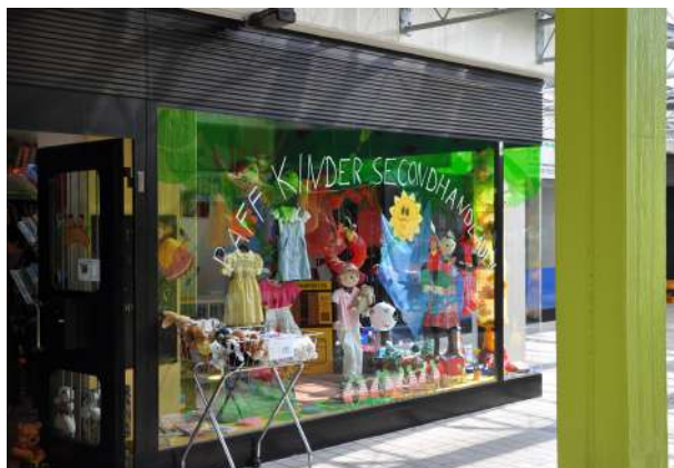
Abb. 30: Temporäre Nutzung Ladenlokal Fasaniepassage, 2009