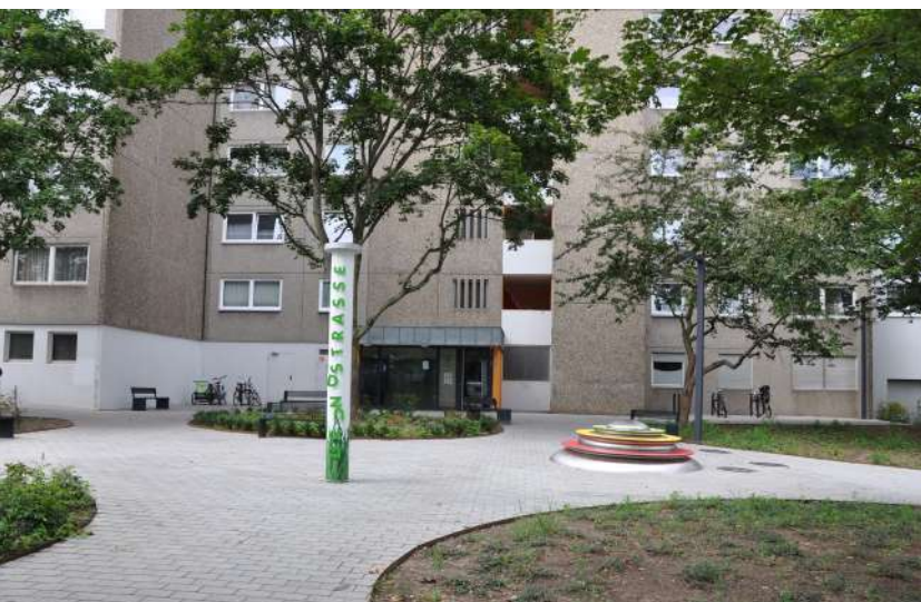
Abb. 44: Aufgewertetes Wohnumfeld Mirjam-Pressler-Straße

Eine farbliche Neugestaltung der Fluchtbalkone und eine Aufwertung des stark beanspruchten Sockelbereichs trugen auch hier zur Imageaufwertung der gesamten Wohnanlage bei.