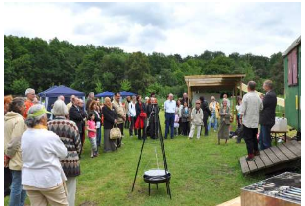
Abb. 89: Tag der offenen Tür Internationale Gärten, 2009