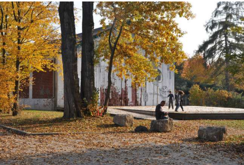
Abb. 68: Holzbühne am JugendKlub, 2011

Nach der Aufgabe der Nutzung von zwei nicht mehr sanierbaren Gebäuden durch die Deutsche Lebens-Rettungs-Gesellschaft (DLRG) wurden diese im Jahr 2023 zurückgebaut. Die neu entstanden Freiflächen südwestlich des Basketballplatzes sind mit Baumpflanzungen und Sitzelementen gestaltet, die zum Verweilen und Entspannen einladen. Das Büro AO Landschaftsarchitekten aus Mainz hatte hierzu eine Planung unter Beteiligung der Kinder und Jugendlichen der angrenzenden Einrichtungen erarbeitet.