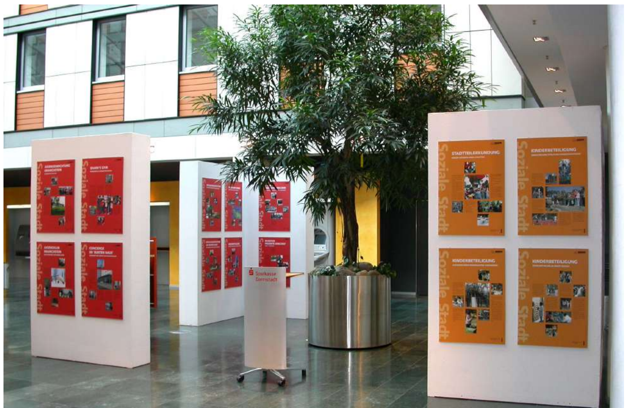
Abb. 80: Ausstellung 'Soziale Stadt' Eberstadt Süd und Kranichstein – Potentiale, Projekte, Perspektiven Sparkasse, 2006