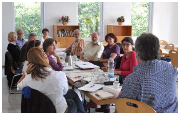
Abb. 11: AG 'Soziale Stadt', 2011

Die Runde, die kontinuierlich zusammentritt, um Probleme und Entwicklungsperspektiven des Stadtteils zu erörtern, versteht sich als Forum der stadtteilbezogenen Projektplanung und wirkt bis heute als Stadtteilkoordinierungs- und Planungsgremium. Um eine größtmögliche Aktivierung für die Mitwirkung an der Stadtteilentwicklung zu erreichen, wurde die Arbeitsgruppe 'Soziale Stadt' gegründet, die aus Mitgliedern der Stadtteilrunde und aktiven Bewohnerinnen und Bewohnern bestand.