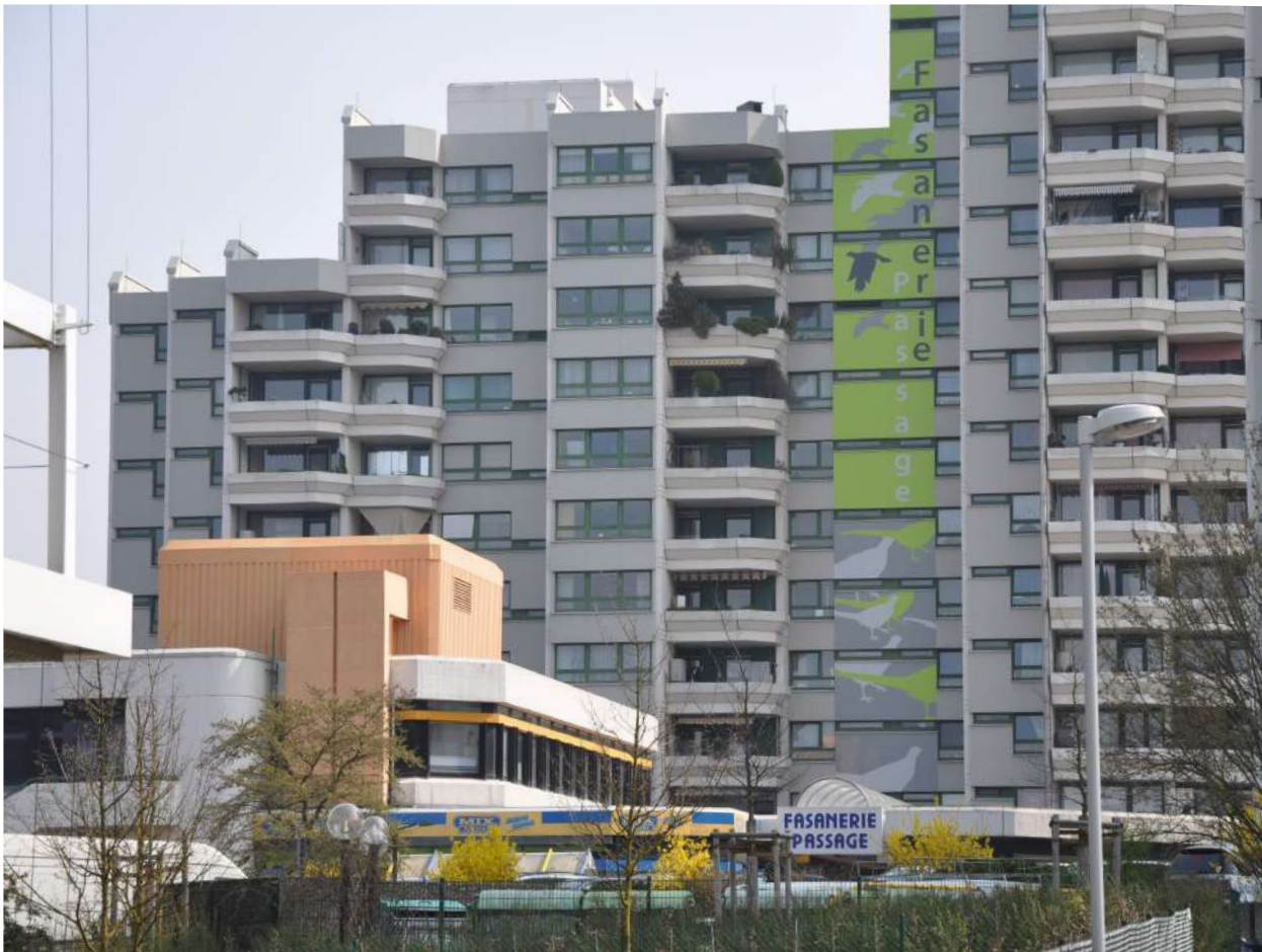
Abb. 28: Fasaniepassage von Westen, 2009