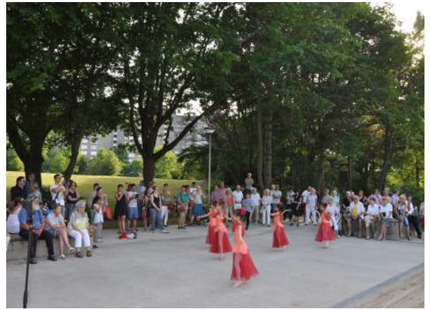
Abb. 85: Tanzaufführung Sonnendeck, 2018