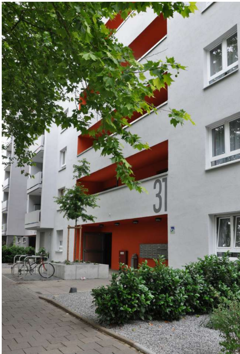
Abb. 47: Neugestaltete Vorzone Mirjam-Pressler-Straße 31

Nach ihrer Sanierung prägt die einladende Wohnanlage Mirjam-Pressler-Straße 31/33 den östlichen Stadtteileingang. Das im Eigentum der bauverein AG befindliche Wohngebäude wurde im Jahr 2009 umfassend modernisiert. Nach erfolgreicher Gebäudesanierung wurde das Wohnumfeld sowohl funktional als auch visuell umfassend aufgewertet. Deutlich wird dies insbesondere über die Umgestaltung der Erschließungs- und Grünflächen in den Vorgartenzonen, die Neuordnung der Abfallsammelstellen sowie die Bepflanzung der Stellplatzanlage. Besonderes Augenmerk wurde auch auf die Bedürfnisse und Wünsche der Kinder gelegt, die in der Wohnanlage und der Umgebung leben. Ein multifunktionaler Kletter- und Rutschturm mit Wackelbrücke, Stämmen, Felsen und eine Wippe sorgen für abwechslungsreiche Spielmöglichkeiten, insbesondere für kleinere Kinder.