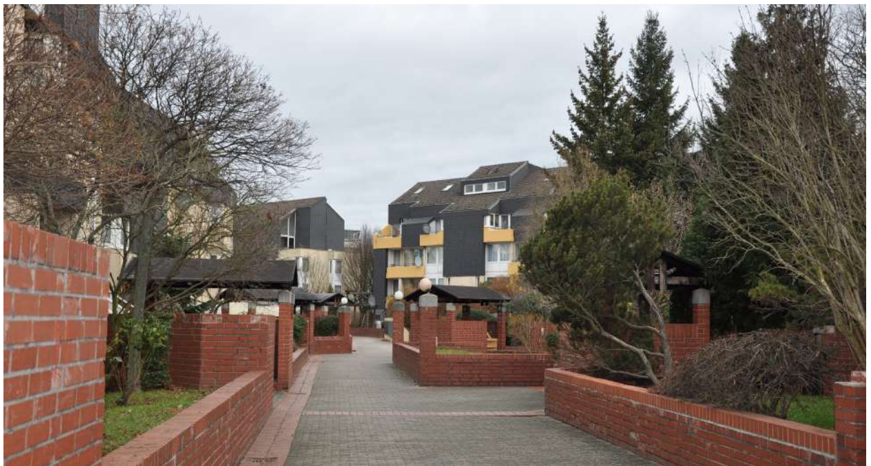
Abb. 49 : Wohnumfeld Quartier K 4