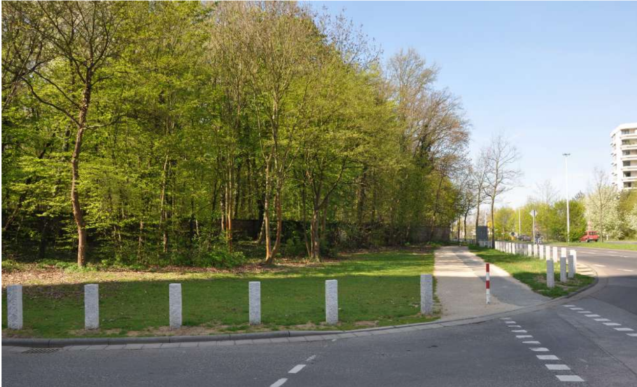
Abb. 50: Stadtteileingang Kranichsteiner Straße, 2011

Die besondere räumliche Lage Kranichsteins als 'Waldsatellit' wird am westlichen Stadtteileingang deutlich, wo die Kranichsteiner Straße als Verbindung zur Innenstadt den Blick auf die Fasaneriemauer und den dahinter liegenden Fasaneriewald lenkt. Das Erscheinungsbild des Stadtteileingangs prägt das äußere Image des Stadtteils entscheidend.