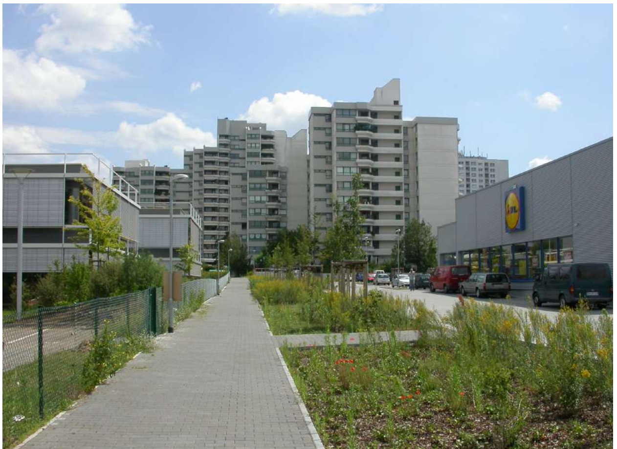
Abb. 32: Wegeverbindung K6 / Fasaneriezentrum, 2007