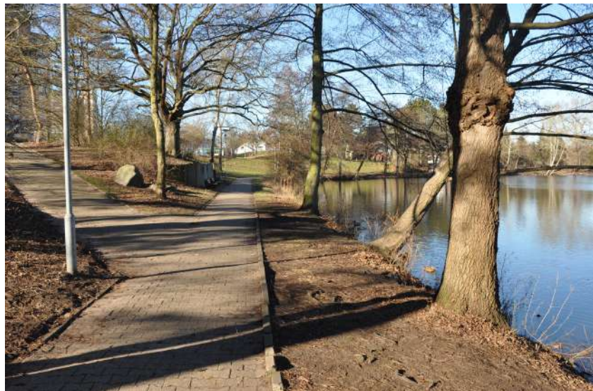
Abb. 71: Uferpflege Brentanosee

Im Rahmen der Programmumsetzung wurden in der Zusammenarbeit sozialer Träger, des Jobcenters, der Agentur für Arbeit, der Integrierten Gesamtschule sowie der Stadtteilwerkstatt insbesondere Erfolge bei der Qualifizierung von Jugendlichen und Frauen, aber auch von langzeitarbeitslosen Männern erreicht. Über eine Vielzahl an umgesetzten Projekten wurden die Chancen der Teilnehmerinnen und Teilnehmer auf dem Arbeitsmarkt nachhaltig erhöht.