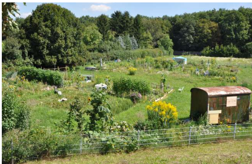
Abb. 75: Grüne Oase 'Internationale Gärten', 2011