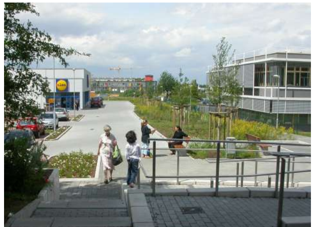
Abb. 31: Vernetzung Lebensmitteldiscounter und Fasaneriezentrum, 2007

Fördermittel 'Soziale Stadt': ca. 107.000 EUR