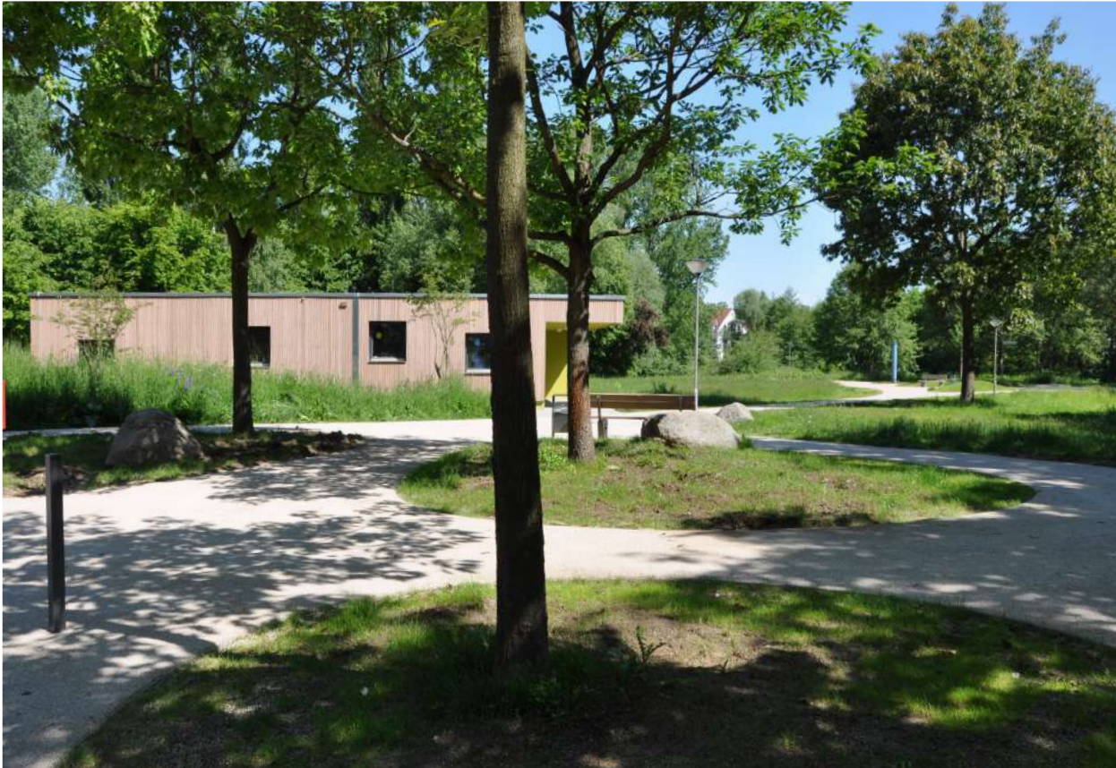
Abb. 59: Grünanlage zwischen Kita Am See und Erich Kästner-Grundschule