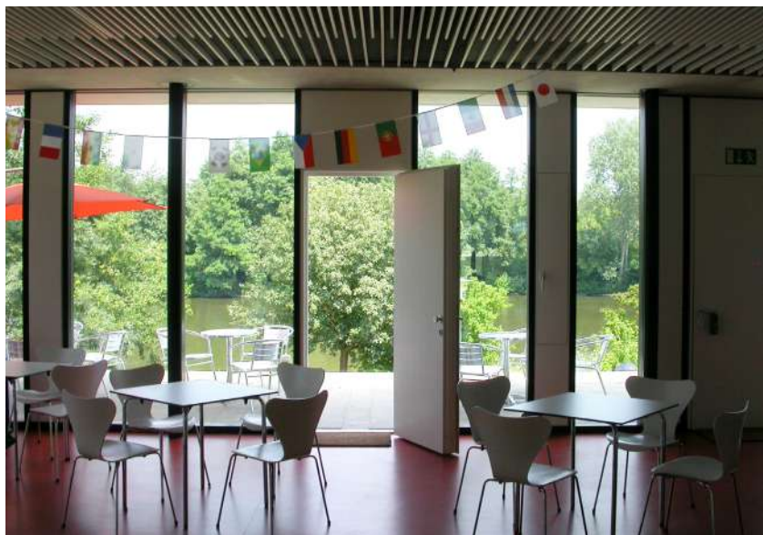
Abb. 21: Innenraum Jugendcafé