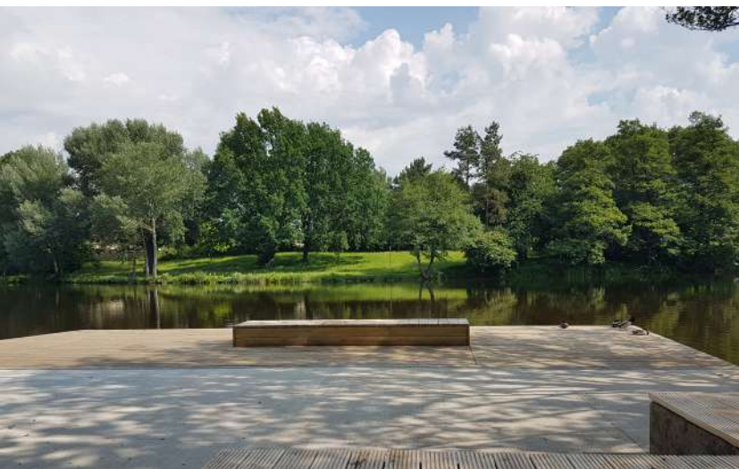
Abb. 22: Sonnendeck

Neben der Schaffung des Stadtteilplatzes an der Bartningstraße und der Umsetzung des Pflegekonzeptes 'Öffentlicher Raum' war ein wichtiges Anliegen des Stadtteils, seine Wasserlage zu inszenieren und die Ufer der Seenkette besser als bislang zugänglich zu machen.