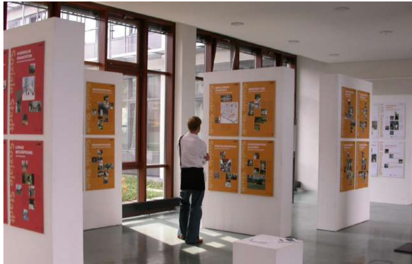
Abb. 79: Ausstellung 'Soziale Stadt' Stadtfoyer, 2010

Über eine Vielzahl an Veranstaltungen, die sowohl vor Ort als auch regional und bundesweit stattfanden, wurde das Fördergebiet der 'Sozialen Stadt' aktiv präsentiert. Die Veranstaltungen boten eine Plattform zur Information, zur Vernetzung und zum Austausch zwischen Bürgerinnen und Bürgern und Projektverantwortlichen.