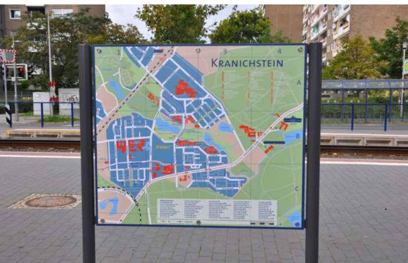
Abb. 76: Stadtteilplan als Teil des Beschilderungskonzeptes, 2013

Fördermittel 'Soziale Stadt': ca. 19.956 EUR