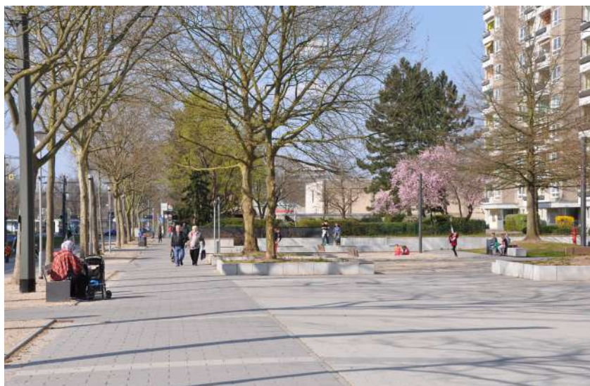
Abb. 25: Stadtteilplatz 'Neue Mitte', 2015

Projektzeitraum: 2011 - 2014 Projektkosten: 1.293.177 EUR Fördermittel 'Soziale Stadt': ca. 1.293.177 EUR