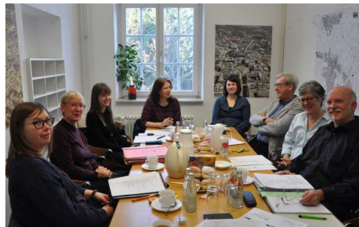
Abb. 9: Projektkoordination 2017

Die Projektkoordination vertrat den Förderstandort bei örtlichen wie überörtlichen Veranstaltungen. Die Teilnahme an Veranstaltungen der Bundesministerien, an Arbeitstreffen im Rahmen der Hessischen Gemeinschaftsinitiative Soziale Stadt (HEGISS) sowie an themenbezogenen Veranstaltungen und Mitgliederversammlungen gewährleistete, dass die Wissenschaftsstadt Darmstadt über alle hessen- und bundesweiten Entwicklungen des Bund-Länder-Programms unterrichtet war. Im Rahmen der kontinuierlichen Projektarbeit, der Fortbildungsveranstaltungen sowie der Evaluierung fand ein regelmäßiger Austausch statt.