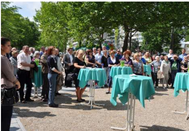
Abb. 88: Einweihung Neue Mitte Bartningstraße, 2014