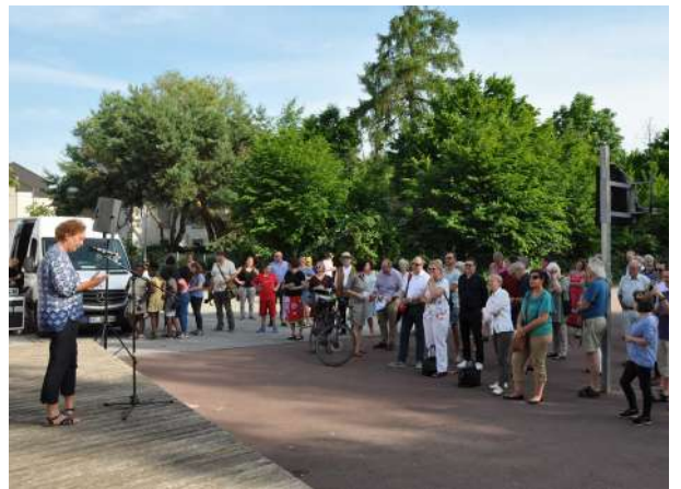
Abb. 87: Event Bühne am ehemaligen Schlepperprüffeld, 2018