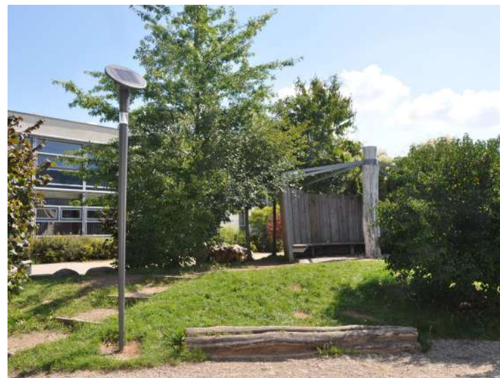
Abb. 58: Treffpunkt für Jugendliche IGS, 2011

Fördermittel 'Soziale Stadt': ca. 8.813 EUR