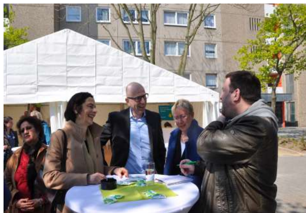
Abb. 83: Übergabe Wohnumfeld Mirjam-Pressler-Str. 25 -29, 2017