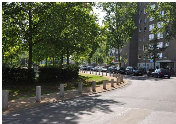
Abb. 23: Neuordnung Straßenraum Gruberstraße

Fördermittel 'Soziale Stadt': ca. 152.759 EUR