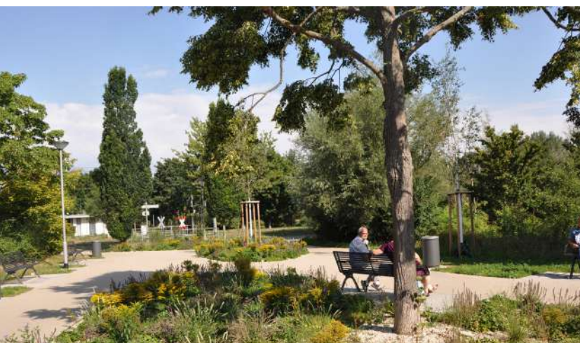
Abb. 37: Sitzgelegenheiten am Einkaufszentrum am See, 2020