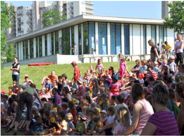
Abb. 84: Kindertheater auf der Brentano-Anlage, 2009