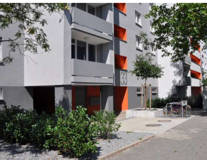
Abb. 46: Neugestaltete Vorzone Mirjam-Pressler-Straße 33