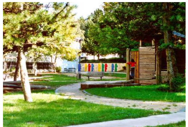
Abb. 41: Spielraum 'Buntes Haus'

Auf die grundlegende und erfolgreiche Sanierung des 'Bunten Hauses' durch die GWH im Jahr 2002 folgten Sanierungsmaßnahmen in der Gruber- und Mirjam-Pressler-Straße (ehemals Grundstraße) sowie in der Bartningstraße und der Esselbornstraße. Hier standen neben der Neugestaltung von Eingangsbereichen Aufwertungen im Wohnumfeld und die Attraktivierung von Spielräumen im Vordergrund.