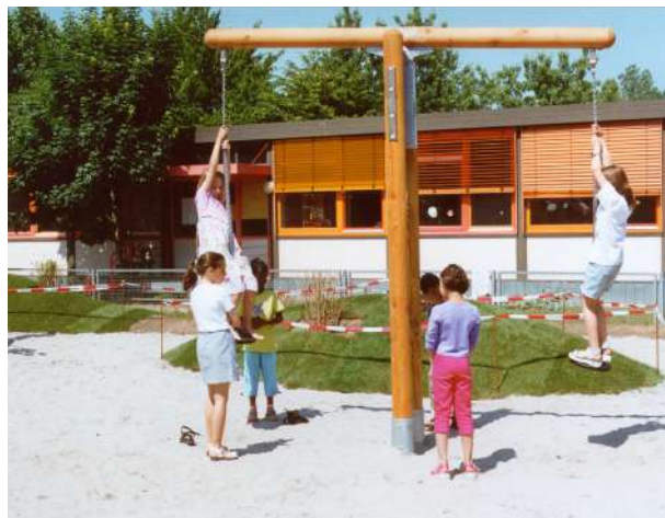
Abb. 55: Schaukel, 2002

Beispielhaft war, dass die Schülerinnen und Schüler intensiv in die Planung des Büros Bagage gGmbH und auch in den Umbau des Schulhofes und die Gestaltung der Spielpunkte eingebunden waren. Kreativ aufgegriffen wurden Ideen, die sich an den Motiven Erich Kästners orientieren, wie etwa ein 'Schlaffaffenland für Kinder und Tiere' und eine 'Mutmachsäule'. Auch Rückzugs- und Beobachtungsplätze, inspiriert durch 'Emil und die Detektive', fanden großen Anklang bei Kindern, Lehrenden, Eltern und den Akteurinnen und Akteuren der 'Sozialen Stadt'.