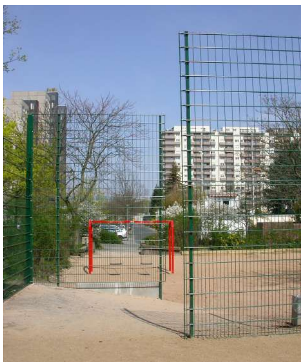
Abb. 74: Spiel- und Sportanlage Meißnerweg, 2007

Fördermittel 'Soziale Stadt': ca. 16.444 EUR