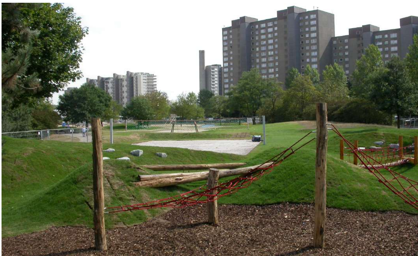
Abb. 19: Brentano-Anlage, 2006