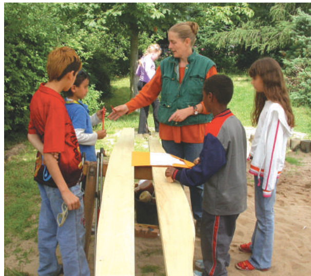
Abb. 64: Partizipation Neugestaltung Außenareal Hort

Die Kinder wurden durch das beauftragte Büro Die Werkstatt-Spielart Heidelberg eG in vorbereitende Arbeiten einbezogen und bei der Gestaltung einzel- ner Spielgeräte beteiligt.