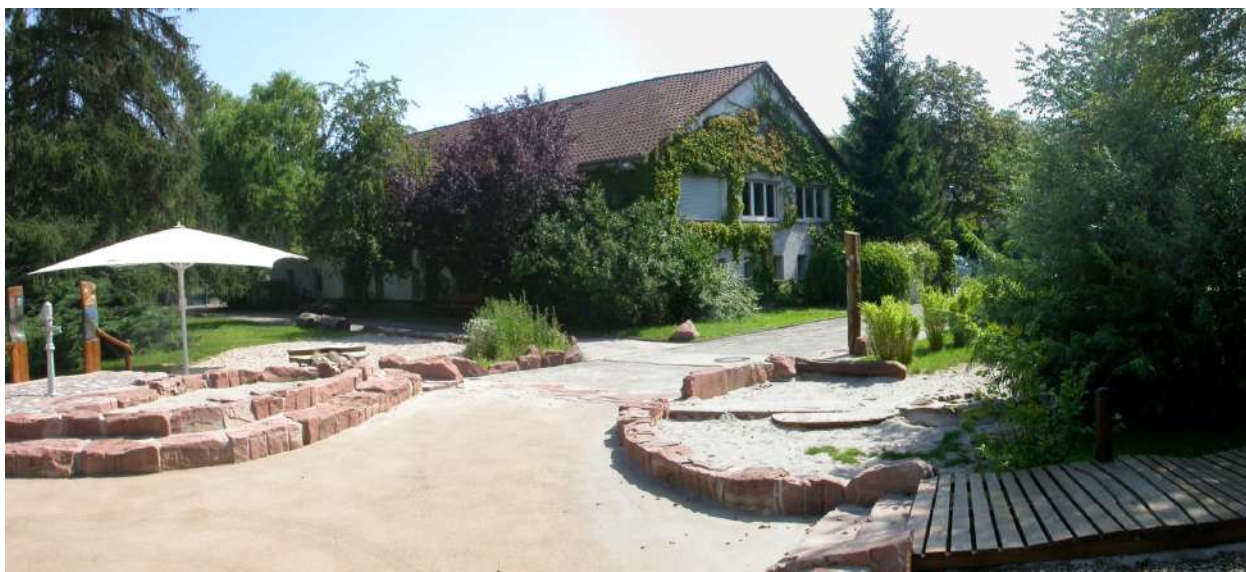
Abb. 65: Neugestaltung Außenareal Hort 'Jägertorstraße'

Fördermittel 'Soziale Stadt': ca. 197.294 EUR