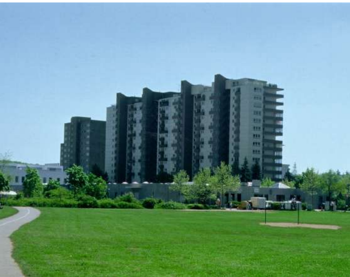
Abb. 1: Brentano-Anlage mit Blick auf das Einkaufszentrum am See