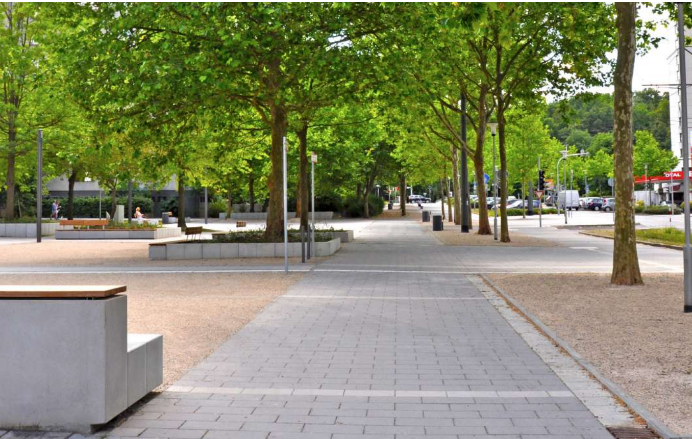
Abb. 24: Boulevard zwischen Fasaneriezentrum und Einkaufszentrum am See