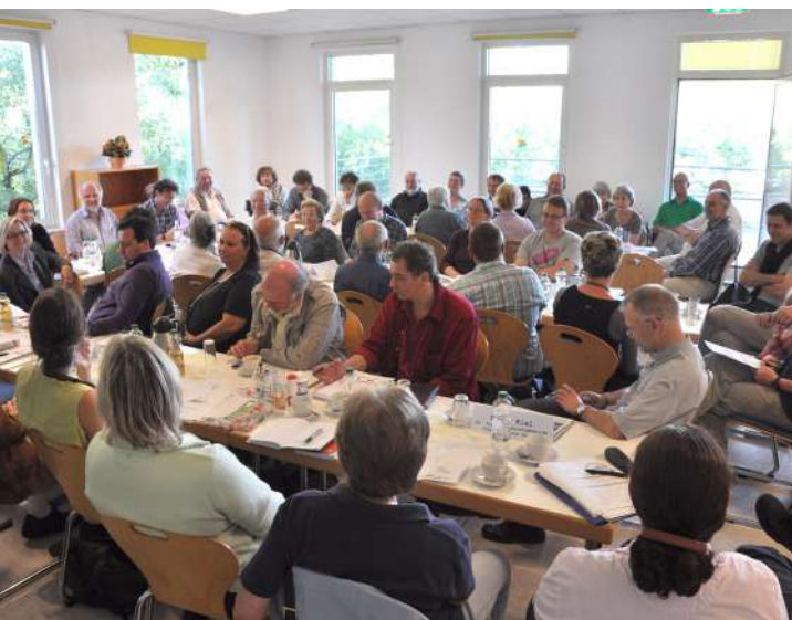
Abb. 10: Stadtteilrunde Kranichstein, 2011

Für Kranichstein war die Stadtteilrunde im Förderprogramm 'Soziale Stadt' das zentrale Gremium zur Vernetzung der Bewohnerinnen und Bewohner mit den vor Ort tätigen Institutionen, der Stadtverwaltung sowie den politischen Gremien. Die Stadtteilrunde besteht aus Bewohnerinnen und Bewohnern sowie Expertinnen und Experten, die in Einrichtungen, Vereinen und Organisationen aktiv tätig sind.