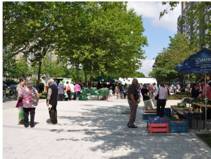
Abb. 26: Eröffnung Stadtteilplatz, 2014

Angrenzend an den Boulevard wurde in zentraler Lage ein Stadtteilplatz mit hoher Aufenthaltsqualität und vielfältigen Nutzungsmöglichkeiten geschaffen, der alle Generationen anspricht. Der differenziert gestaltete Platz wird durch die vorhandene Hochhausbebauung räumlich gefasst. Sein besonderes Flair ist auf den vorhandenen Baumbestand zurückzuführen, der in die Platzgestaltung integriert wurde. In den Sommermonaten erfreut sich der Platz mit unterschiedlichen Sitz- und Spielmöglichkeiten sowie einem Trinkbrunnen großer Beliebtheit. Die Bespielung des neuen Quartiersplatzes wurde maßgeblich von der aus der Stadtteilrunde entstandenen AG Platzgestaltung (später AG Markt) initiiert und begleitet. Bis heute bringt der jährlich stattfindende Flohmarkt viele Menschen zusammen.