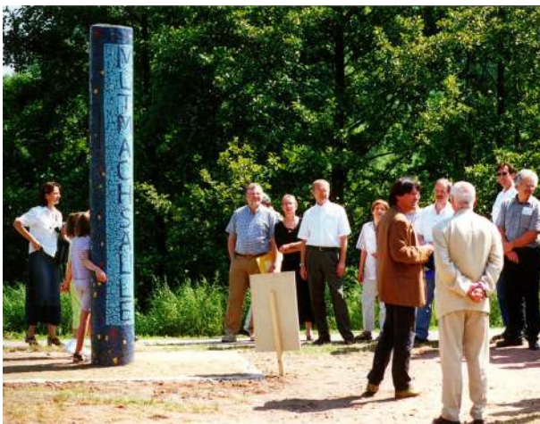
Abb. 57: Mutmachsäule 2003

Fördermittel 'Soziale Stadt': ca. 256.361 EUR