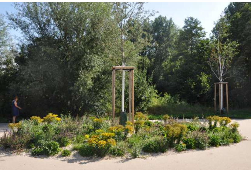
Abb. 36: Freifläche am Einkaufszentrum am See, 2020

Die Flaniermeile Bartningstraße führt vom Fasane- riezentrum zum in Sichtweite gelegenen Einkaufs- zentrum am See (EKZ), das sich aufgrund seines vielfältigen Angebots an Nahversorgung und Ga- stronomie als wichtiger Treffpunkt im Stadtteil eta- bliert hat.