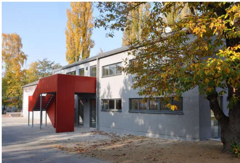
Abb. 63: Sanierter Jugendklub, 2012

Projektzeitraum 2004 - 2011 Projektkosten: 454.053 EUR Fördermittel 'Soziale Stadt': ca. 376.429 EUR Eigenmittel Agentur für Arbeit: 77.624 EUR