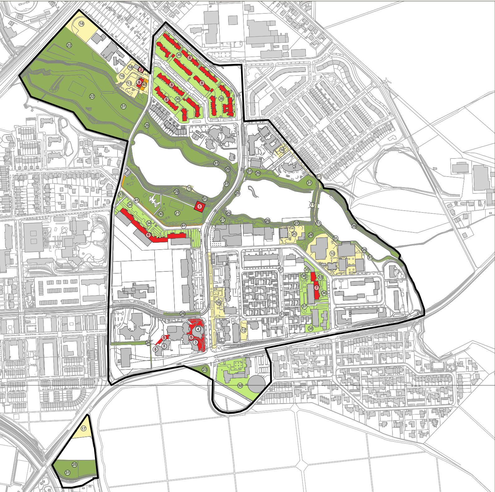
Abb. 90: Lageplan Maßnahmen, 2024