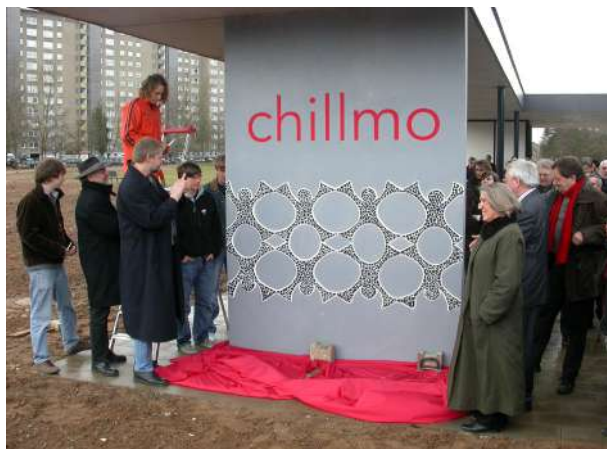
Abb. 82: Übergabe Jugendcafé Chillmo, 2006

In der Zusammenschau wurden diese ebenfalls bei HEGISS-Treffen und Veranstaltungen, Vertreterinnen und Vertretern des Ministeriums sowie anderer hessischer Kommunen präsentiert.