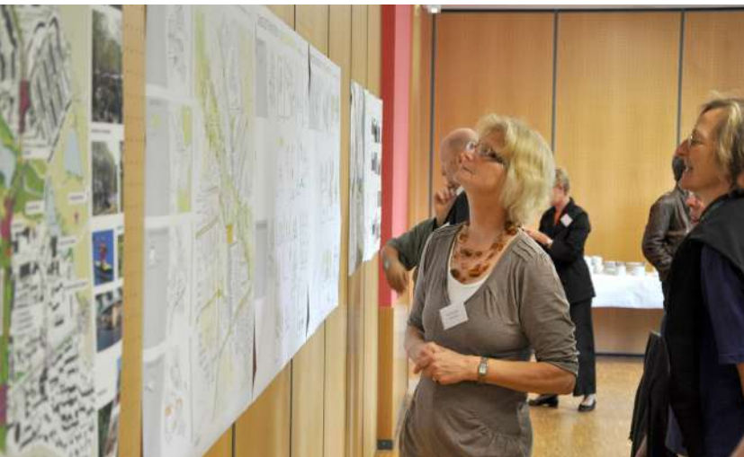
Abb. 14: Planungswerkstatt 'Leitbild Öffentlicher Raum', 2009

Im Jahr 2006 wurden in mehreren quartiersbezogenen Arbeitsgruppen die Herausforderungen und Möglichkeiten zur weiteren Entwicklung des Stadtteils unter Berücksichtigung umgesetzter sowie geplanter Projekte der 'Sozialen Stadt' diskutiert. Ziel war es, über Planungswerkstätten konkrete Projekte für Grün- und Freiflächen, bauliche Investitionen und eine Optimierung der Verkehre aufzuzeigen und in einem Rahmenplan 'Leitbild Öffentlicher Raum' zusammenzuführen.