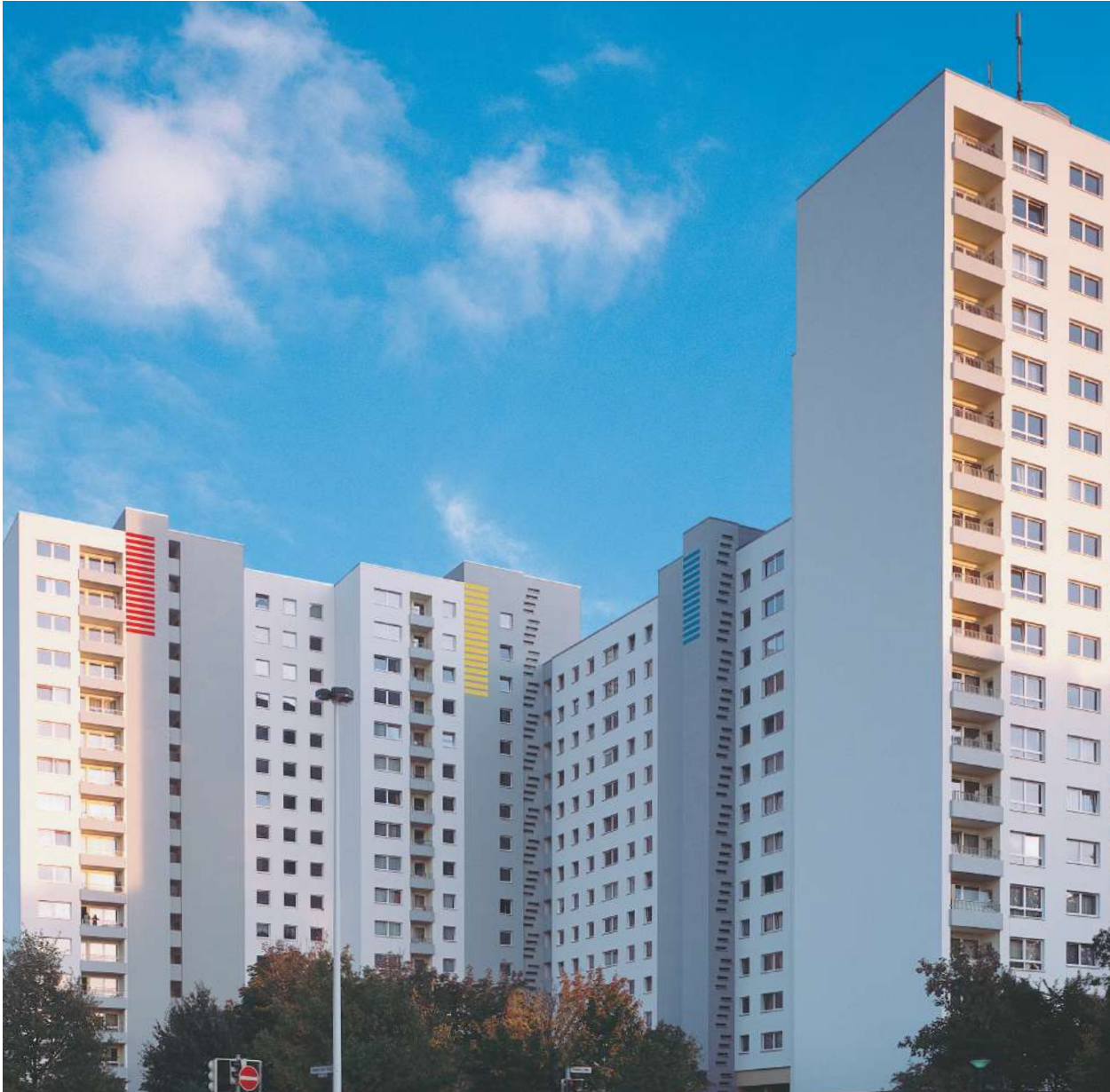
Abb. 39: Modernisiertes Wohnensemble 'Buntes Haus'

Die Wohnungswirtschaft als starke Partnerin