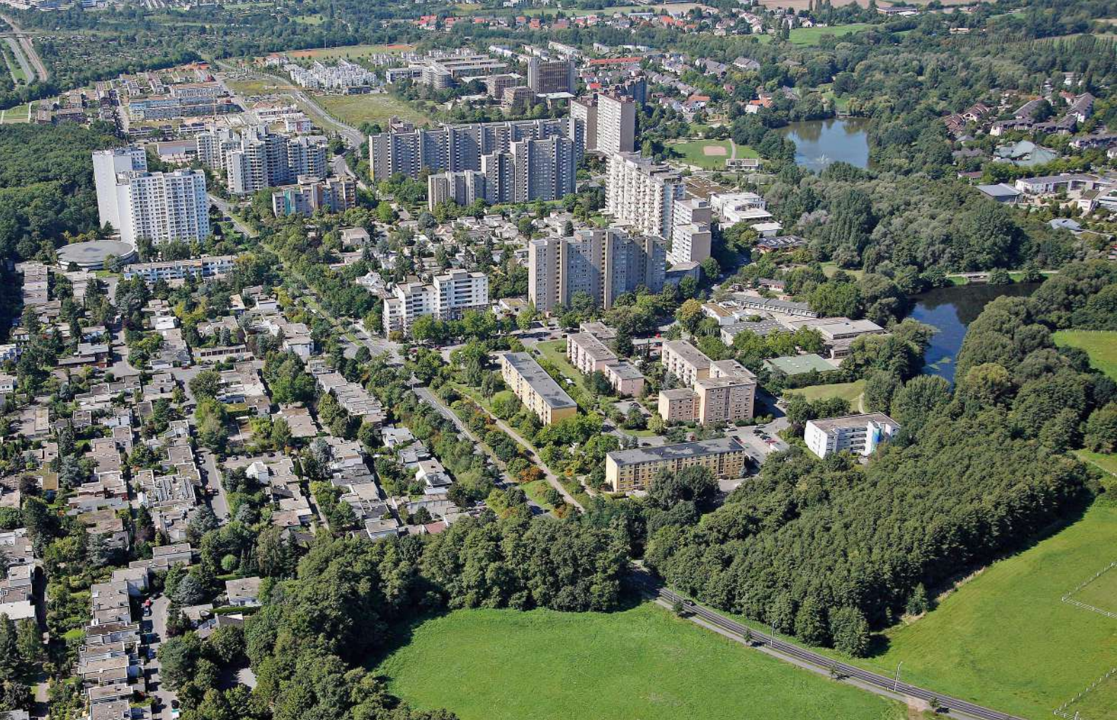
Abb.3: Luftbild Kranichstein