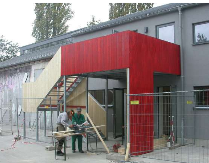
Abb. 70: Neugestaltung Eingangsbereich / Fluchtweg JugendKlub, 2011

Dabei standen sozialraumorientierte Programme wie 'Lokales Kapital für soziale Zwecke' (LOS), 'Bildung, Wirtschaft, Arbeit im Quartier' (BIWAQ), 'Jugend stärken im Quartier' (JUSTIQ) und das Modellprojekt 'Schule neu positionieren' im Vordergrund. Die damit verbundenen Beratungs- und Qualifizierungsangebote zur Beschäftigungsförderung wurden durch Förderprogramme des Europäischen Sozialfonds (ESF), des Bundes sowie des Landes unterstützt.