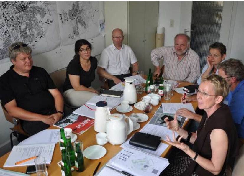
Abb. 8: Projektkoordination 2011