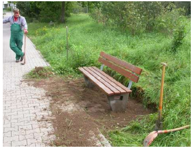
Abb. 72: Einbau Bänke