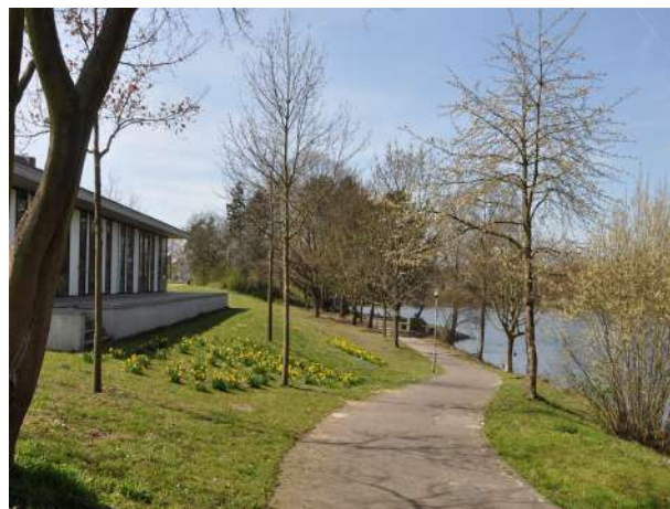
Abb. 18: Weg am Brentanosee

Im zuvor ungestalteten Mittelteil laden heute ein Beachvolleyballfeld, ein Parcours für Skater sowie Tischtennisplatten zur sportlichen Betätigung ein. Ein leicht vertieftes Sportfeld bietet die Möglichkeit, sich zum Ballsport zu treffen. Im Jahr 2023 wurde eine Calisthenics-Anlage, auf der Grundlage der Planung vom Landschaftsarchitekturbüro Dittmann + Komplizen aus Frankfurt a.M., ergänzt. Der östliche Teil der Anlage behält seinen funktionsoffenen Charakter und wurde so gestaltet, dass Stadteilstellen stattfinden können. Eine Baumreihe bildet die natürliche Begrenzung zum Straßenraum der Gruberstraße. Sitz- und Verweilmöglichkeiten bieten unter dem schattenspendenden Baumdach Raum für nachbarschaftliche Begegnungen.