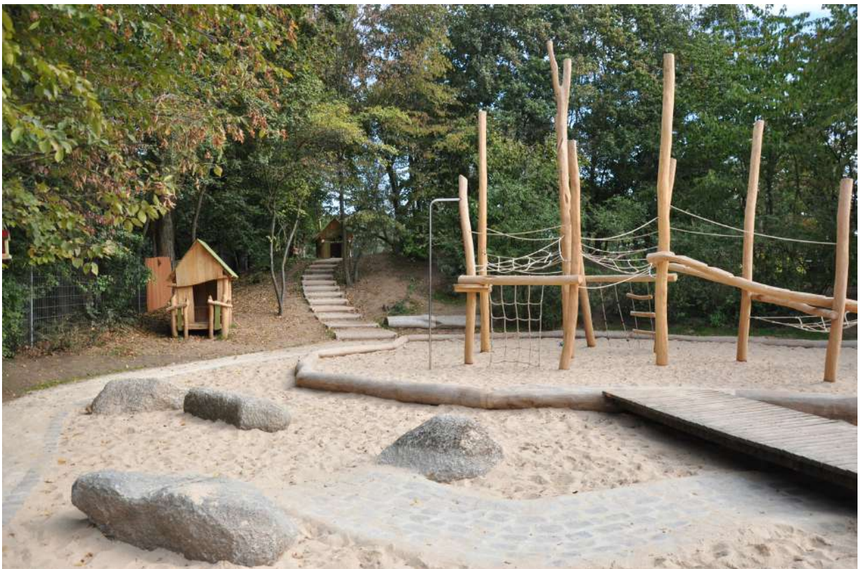
Abb. 61: Neugestaltung Außenareal Kita Am See

Eigenmittel Wissenschaftsstadt Darmstadt: 179.488 EUR