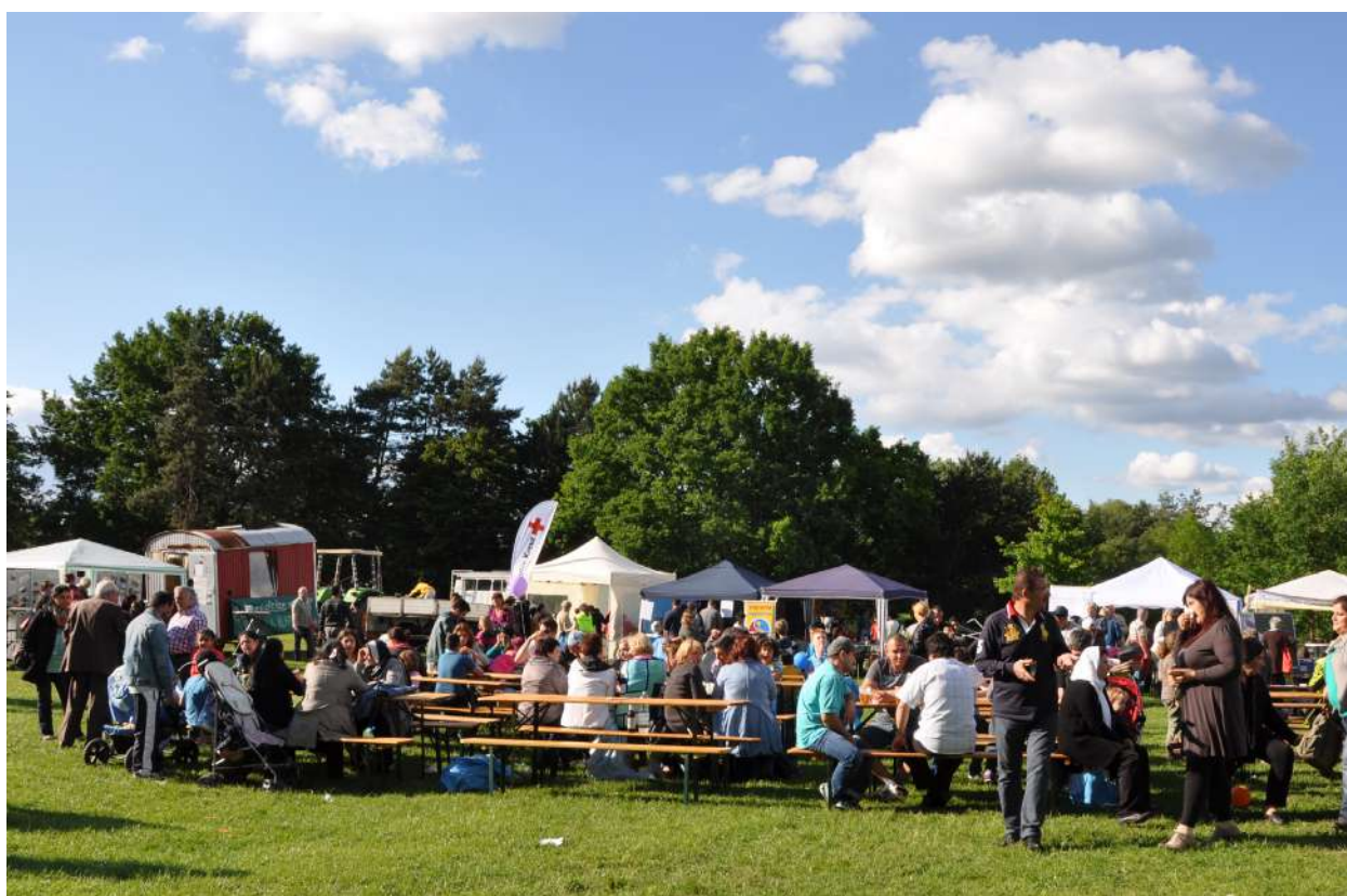
Abb. 13: Stadtteilfest 'Bunte Wiese', 2014

Ein weiteres Highlight war die Teilnahme des Stadtteils am Darmstädter Architektursommer im Jahr 2008 mit dem Motto 'Kranichstein innovativ – Stadtteilrundgang mit Performance'.