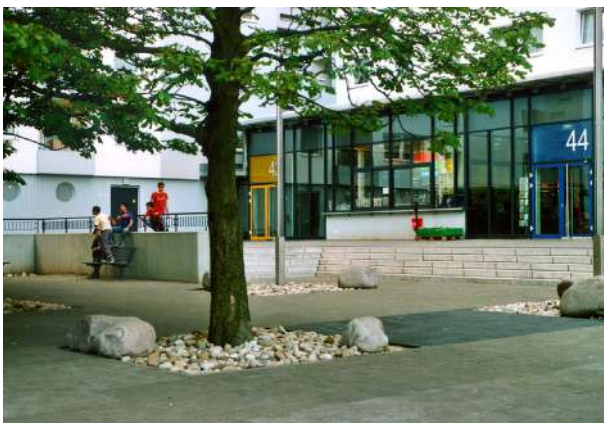
Abb. 40: Vorplatz 'Buntes Haus'

Für die 'Soziale Stadt' war es mehr als naheliegend, nach der grundlegenden Sanierung des Hochhauses die Neugestaltung seines Außenareals zu unterstützen. In Zusammenarbeit mit dem Stadtteilmanagement, der Stadtteilwerkstatt und dem Arbeitskreis Migrantinnen und Migranten in Kranichstein (AK MiKra) wurden Workshops mit Bewohnerinnen und Bewohnern zur Ideensammlung durchgeführt und Planungsskizzen mit dem beauftragten Büro Baggage gGmbH aus Freiburg diskutiert und abgestimmt. Letztendlich entstand unter Mitwirkung von Kindern und Jugendlichen ein attraktiver Vorplatz und ein grundlegend neugestaltetes Spielareal an der Fasaneriemauer.