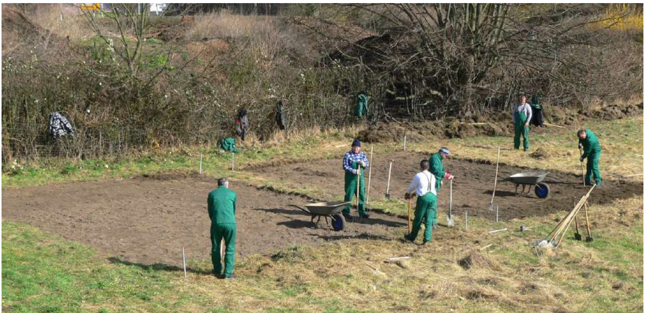
Abb. 73: Vorbereitende Arbeiten 'Internationale Gärten', 2008

Von den Arbeiten der Gruppe profitierte insbesondere das Erscheinungsbild der Brentano-Anlage, von Grünanlagen und Wegeflächen sowie Spielpunkten im Stadtteil sowie das Areal des ehemaligen Schlepperprüffelds an der Jägertorstraße.