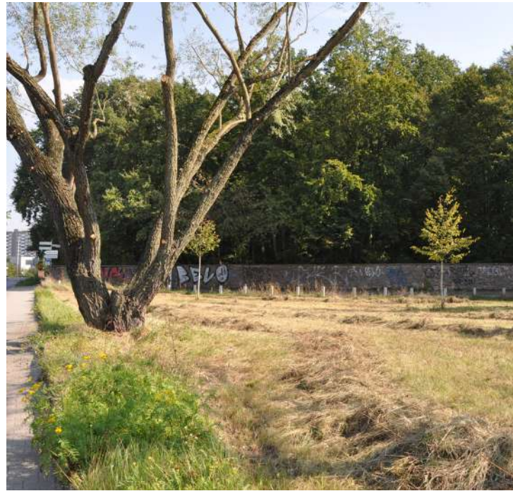
Abb. 51: Stadteingang vor der Fasaneriemauer, 2024