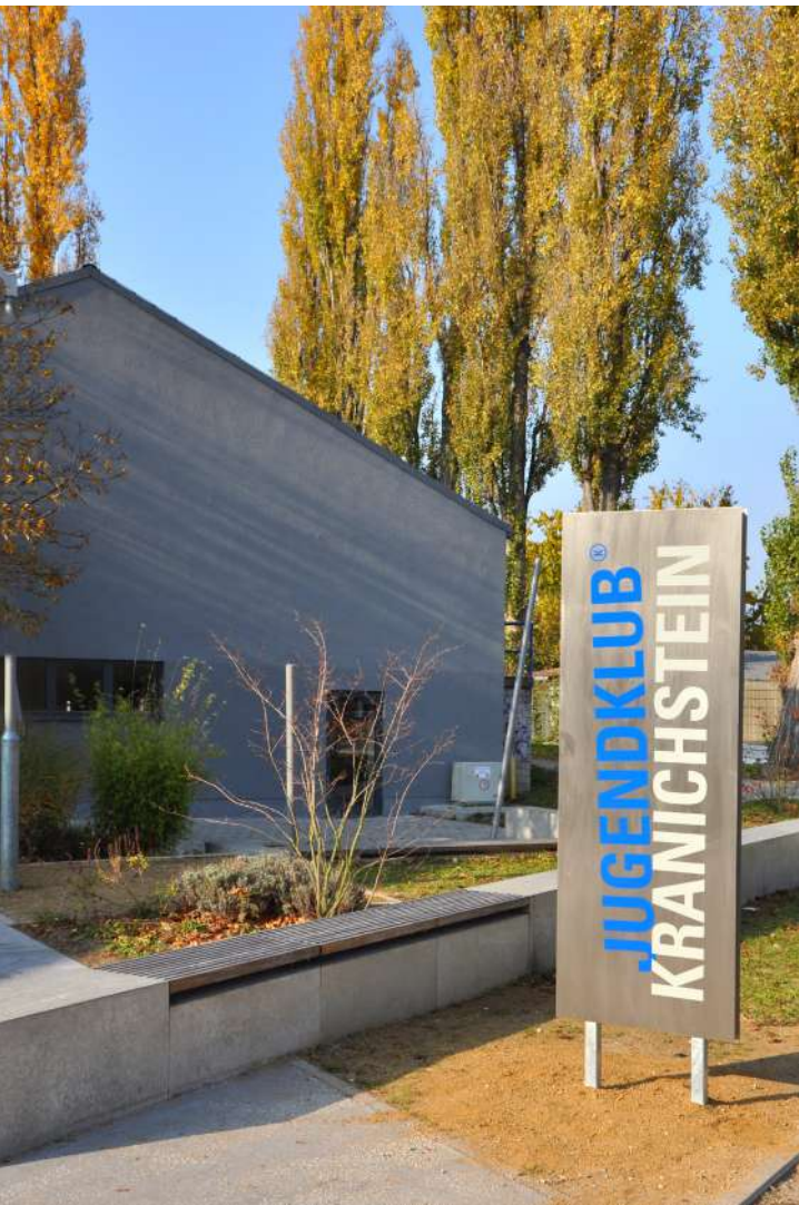
Abb. 62: Sanierter Jugendklub, 2012