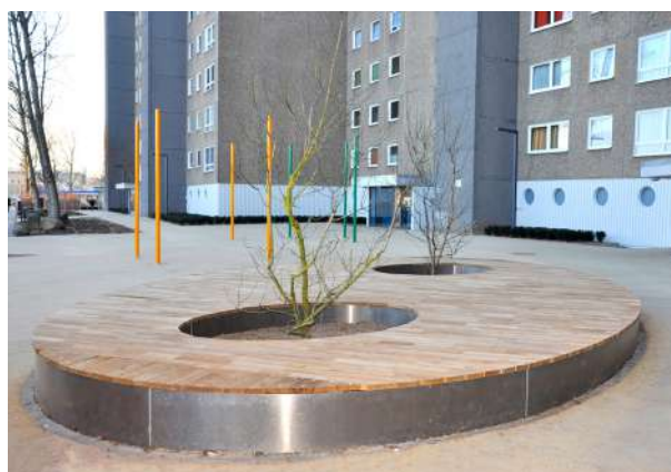
Abb. 43: Neugestalteter Vorbereich, 2012

Fördermittel: 'Soziale Stadt': ca. 298.000 EUR