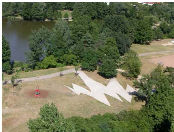
Abb. 17: Skateparkour Brentano-Anlage

In Abstimmung mit den Gremien des Stadtteils wurde die Brentano-Anlage ab dem Jahr 2006 zum Stadtteilpark umgebaut. Der westliche Bereich des Grünzugs wurde durch das beauftragte Landschaftsarchitekturbüro Adler & Olesch aus Mainz als naturnaher Aufenthalts- und Spielbereich konzipiert.