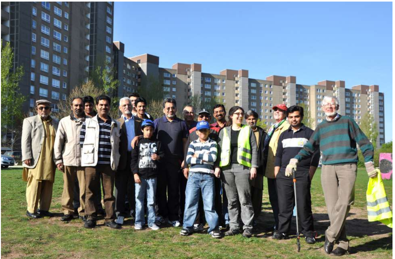
Abb. 12: Reinigungsaktion, 2011

Zur Anlaufstelle für viele Bewohnerinnen- und Bewohnerarbeitsgruppen, die sich sozial und kulturell engagieren, etablierten sich die Räumlichkeiten der Stadtteilwerkstatt in der Mirjam-Pressler-Straße 21 sowie der Bürgersaal im Luise-Büchner-Haus.