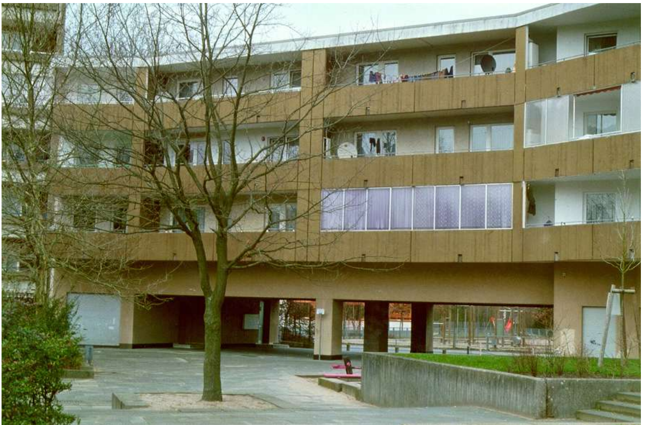
Abb. 6: Wohnbebauung Mirjam-Pressler-Straße (ehemals Grundstraße), 2001

Um zu erreichen, dass Deutsche wie Migrantinnen und Migranten aus sozial und wirtschaftlich starken Milieus den Stadtteil nicht verlassen, sondern ihn gezielt aufsuchen, wurde Bildung und Ausbildung neben der durch das Programm geförderten städtebaulichen Aufwertung ein sehr hoher Stellenwert eingeräumt. Ziel war, über eine optimale Infrastruktur und öffentliche Einrichtungen hoher Qualität dem Bleibewunsch der im Quartier lebenden Bewohnenden ausdrücklich Rechnung zu tragen.