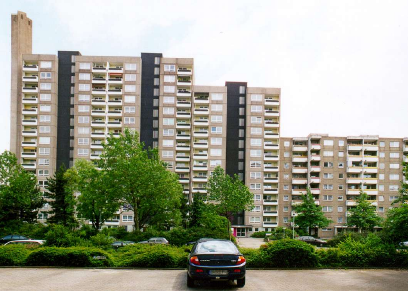
Abb. 5: Wohnbebauung Bartningstraße, 2002

Zusammenfassend wurde befürchtet, 'dass sich infolge der Belegung mit Problemfamilien ein Stadtteil entwickeln könnte, in dem Probleme schneller wachsen als sie abgebaut werden können' (Zitat Sozialbericht).