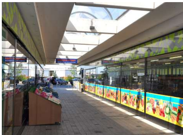
Abb. 29: Nachnutzung Ladenlokal Fasaniepassage, 2011

In einem ersten Schritt wurden die Eingangsbereiche des Wohnhochhauses inklusive Beleuchtung und Briefkastenanlagen neugestaltet. Danach erfolgte die Aufwertung der Einkaufspassage selbst, die ein neues, weithin sichtbares Signet und eine eigene Corporate Identity erhielt. Renoviert wurden auch ihre Zugänge. Durch die Ansiedlung eines internationalen Lebensmittelmarktes gelang es, vorhandenen Leerstand nachhaltig zu beseitigen.