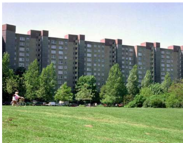
Abb. 2: Hochhausensemble Gruberstraße, 2001

Ab 1972 verbesserte sich mit dem Bau von zwei städtischen Kindertagesstätten, dem Fasaneriezentrum sowie dem Zentrum am See die Ausstattung des Stadtteils mit Betreuungseinrichtungen, Ladenlokalen und sonstigen Dienstleistungen deutlich. Das durch städtische und kirchliche Träger geschaffene Angebot an Schulen, Kindertagesstätten und Jugendeinrichtungen wurde mit dem Bau der Sekundarstufe I der Stadtteilschule 1997 weiter komplettiert. Der 2002 fertiggestellte dritte Bauabschnitt der Schule schaffte eine Stadtteilbibliothek, Räume für die Familienbildungsstätte sowie für bürgerschaftliche Nutzungen. Ein weiterer wichtiger Schritt war die Erweiterung der Erich Kästner-Grundschule im Jahr 2017.