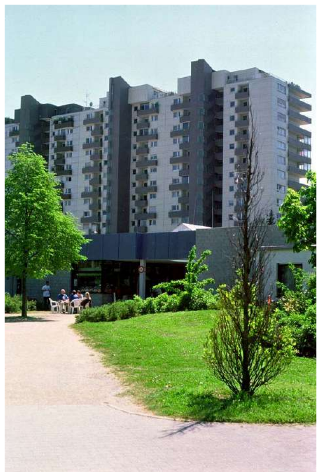
Abb. 4: Einkaufszentrum am See mit Bebauung Mirjam-Pressler-Straße