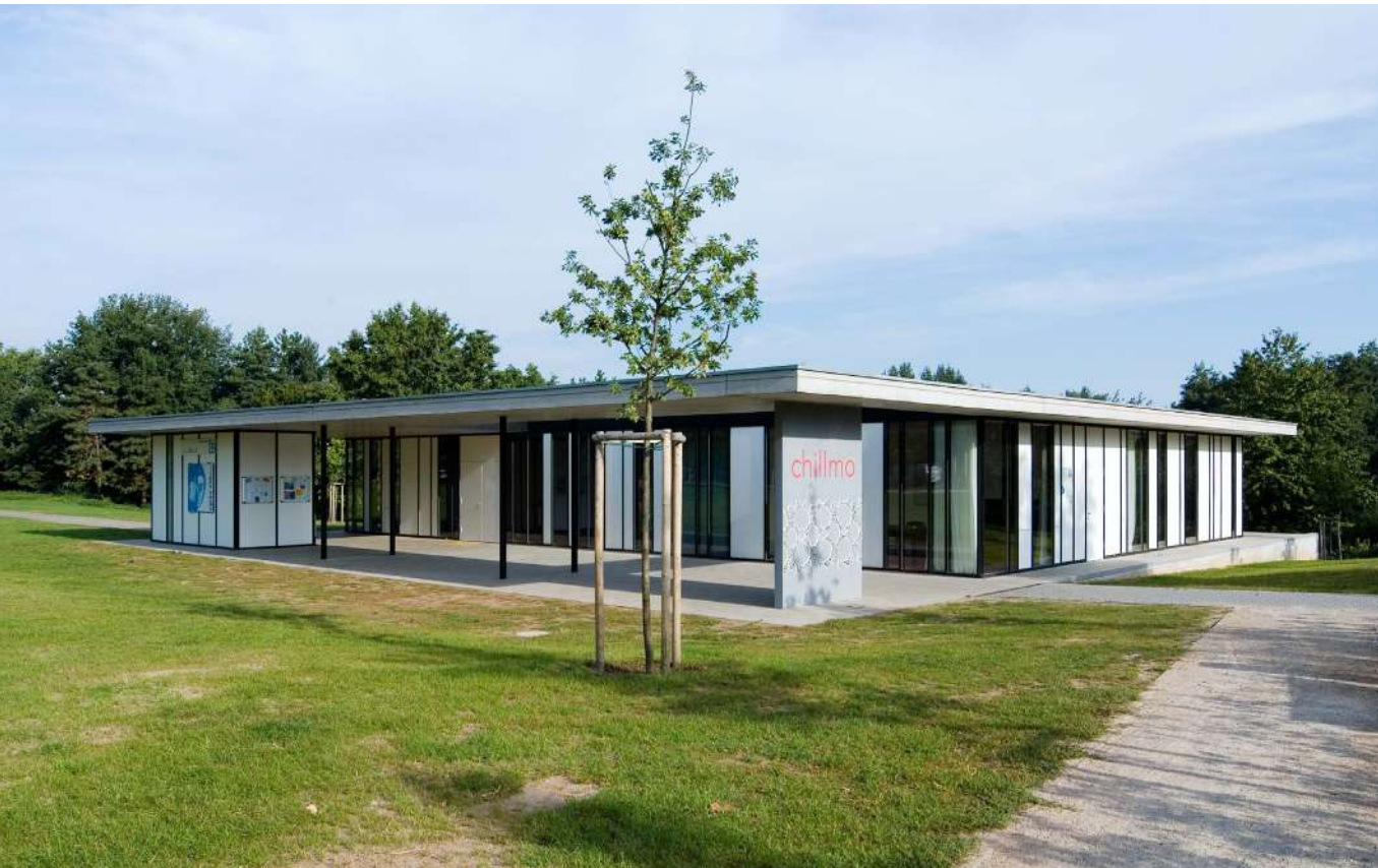
Abb. 20: Jugendcafé Chillmo auf der Brentano-Anlage