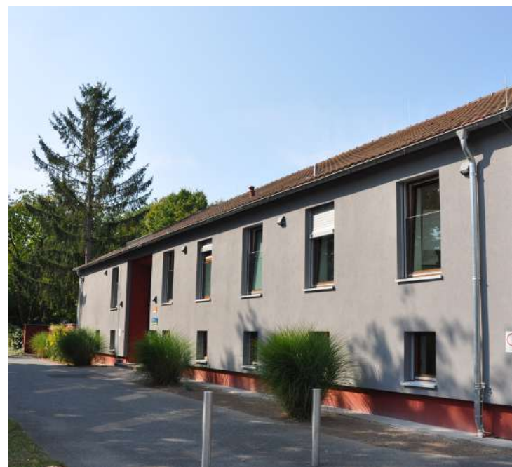
Abb. 69: Sanierung Hort 'Jägerstraße', 2024

Projektzeitraum: 2023 - 2024 Projektkosten: 528.747 EUR Fördermittel 'Soziale Stadt': ca. 400.000 EUR Eigenmittel Wissenschaftsstadt Darmstadt: 128.747 EUR