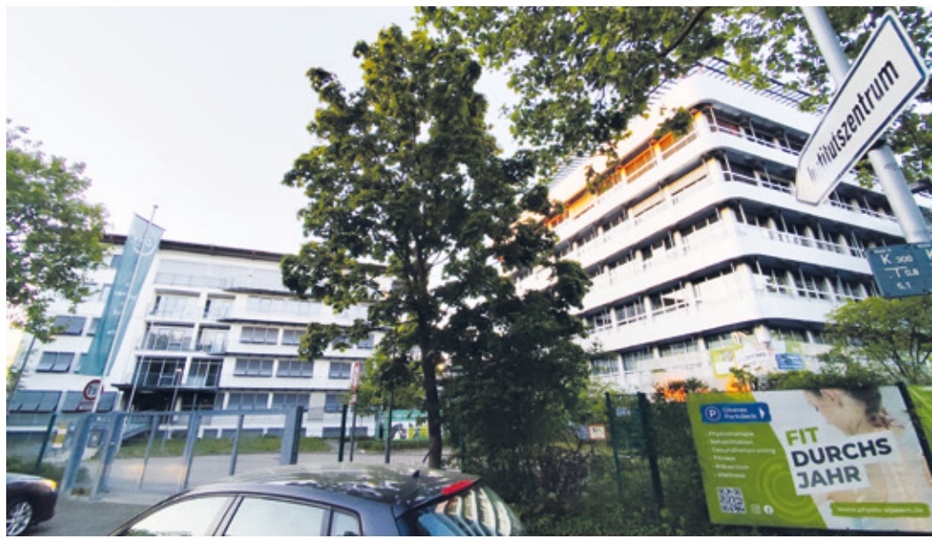
Treffpunkt der Stadtteilrunde bei der GHV Versicherung im Institutszentrum in Kranichstein.

Kranichstein (hv). Alle Kranichsteinerinnen und Kranichsteiner sind wieder ganz herzlich zum 2. Treffen der Kranichsteiner Bürgerbeteiligungsrunde in 2025 eingeladen. Das bereits beim letzten Treffen der Stadtteilrunde angekündigte nächste Treffen, bei dem wir als Gäste bei der GHV im Institutszentrum eingeladen sind, findet am Mittwoch, 21. Mai, um 17 Uhr statt. Unmittelbar davor, also bereits um 16 Uhr wird ein geführter Rundgang durch das Institutszentrum mit Besuch der neu eingezogenen Physio-Praxis Al Jasem angeboten. Für alle, denen das Institutszentrum doch eher ein fremdes Gebiet ist, ist das