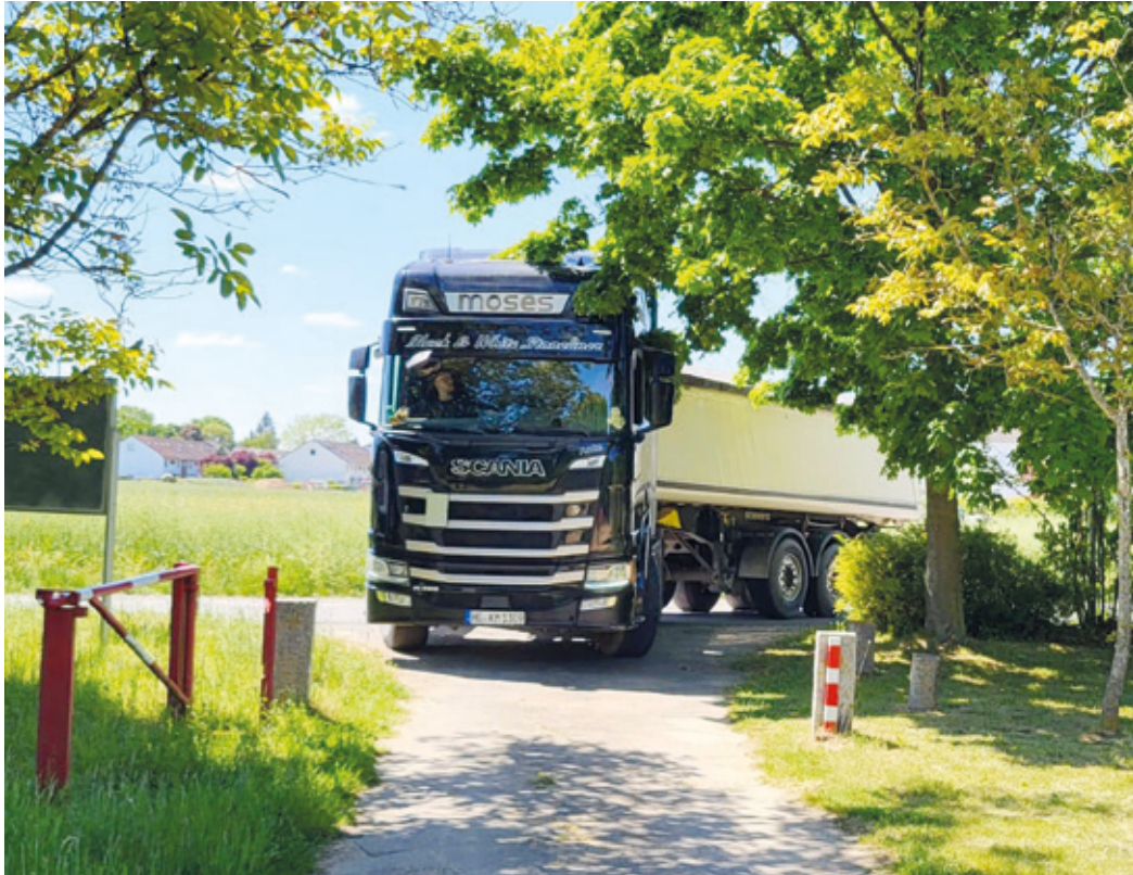
14 Uhr – der Sand ist quasi da, doch dann steckte der Lkw fest.