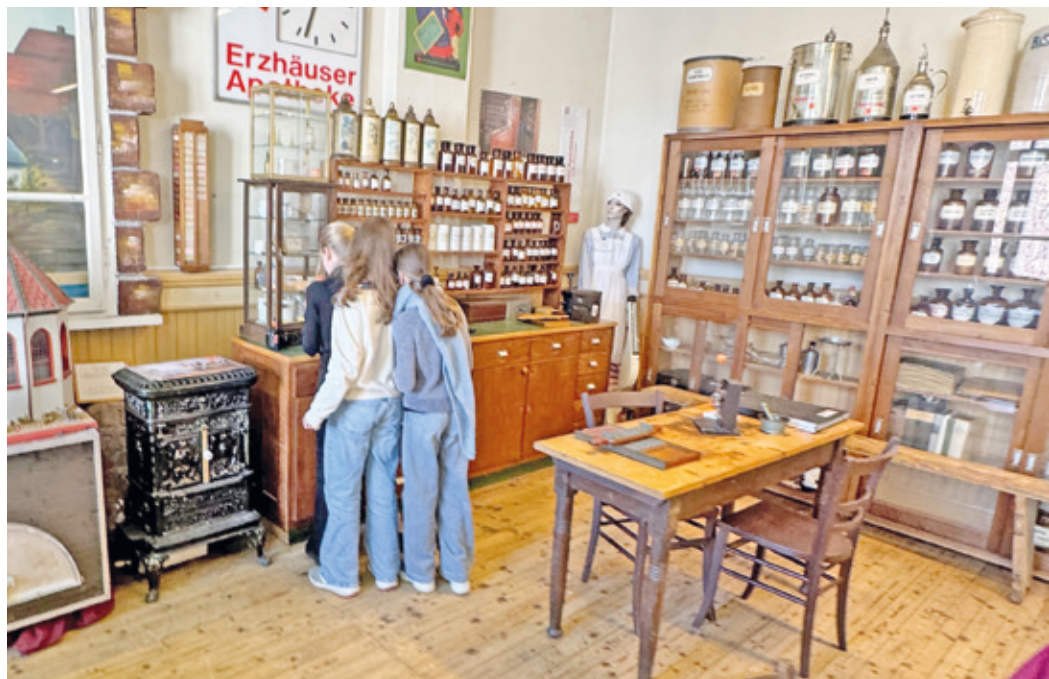
Erste Erzhäuser Apotheke.