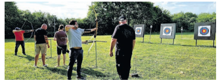
unter Beweis zu stellen.

Münster (MA) Vor Kurzem durften die Mitglieder der DJK Münster einen besonderen Tag bei den Münsterer Schützen erleben. Bei strahlendem Sonnenschein versammelten sich rund 25 begeisterte DJK-ler, um in den Disziplinen Sportbogen und Kleinkaliber-Gewehr ihr Können