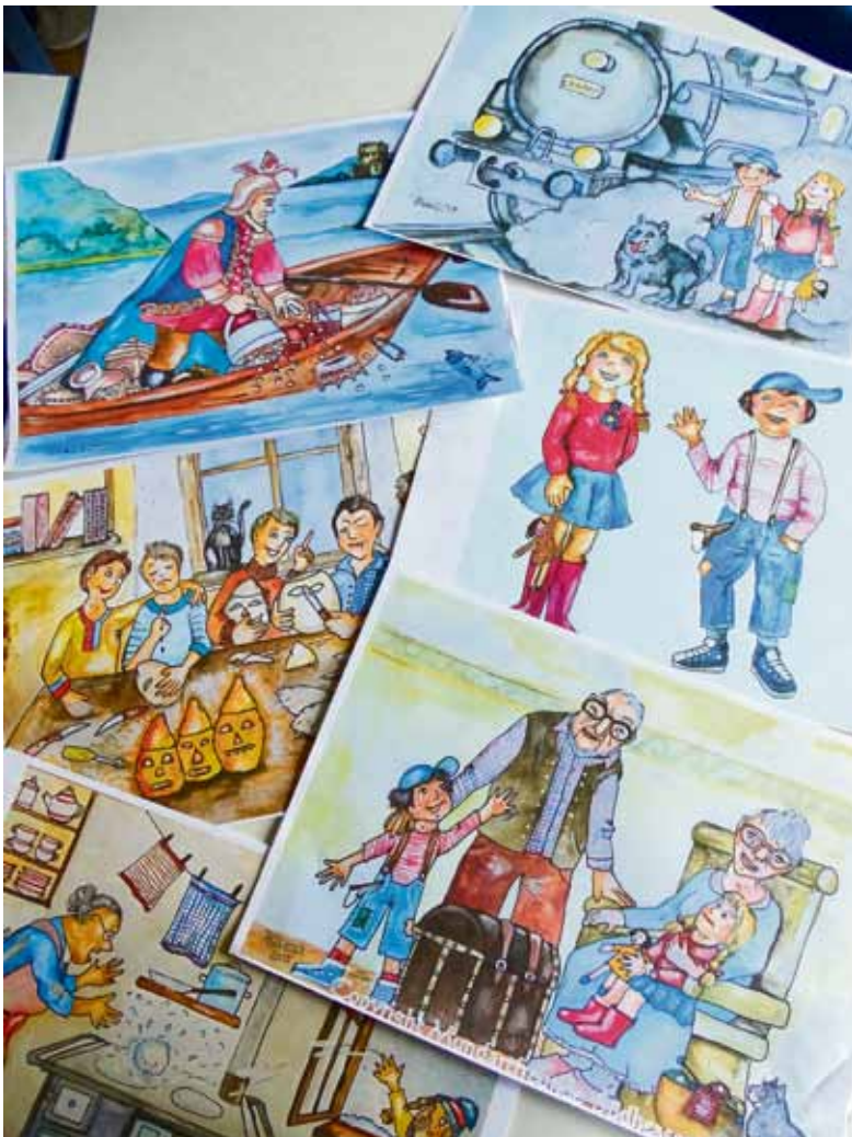
Das neue Buch mit herrlichen Geschichten ist in Vorbereitung. Hier einige der Illustrationen von Conny Abramzik.

Der „Klingende Mundart-Kalender“ erzielte 2.000 €