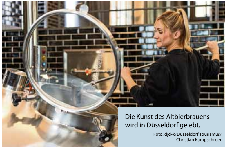
Die Kunst des Altbierbrauens wird in Düsseldorf gelebt.

Gemeinsam mit Autor und Regisseur Christian Kampschroer begeben sich die Zuschauer und Zuschauerinnen in sechs Folgen auf eine Tour durch die Hausbrauereien in der Altstadt und blicken hinter die Kulissen der Betriebe, die den unverwechselbaren Geschmack des Altbiers geprägt haben und noch heute für Handwerk, Leidenschaft und Qualität stehen.