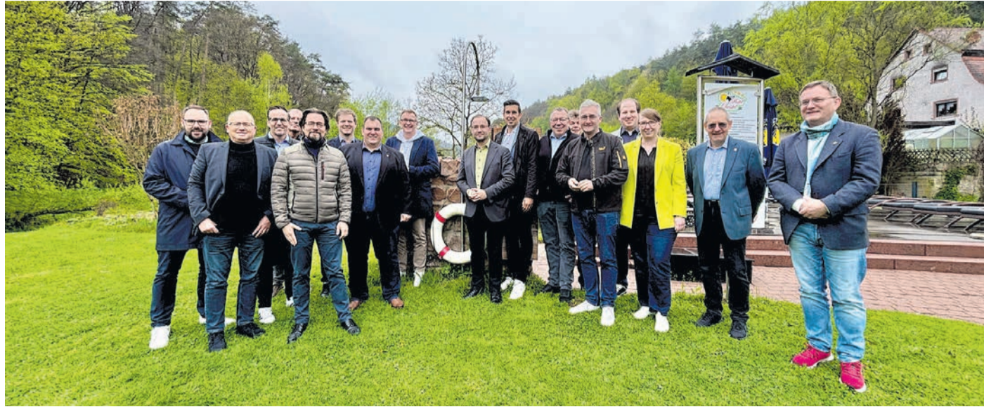
Die Teilnehmenden der Klausurtagung der Kreisversammlung des Hessischen Städte- und Gemeindebundes.

„Unsere Kommunen leisten tagtäglich enorm viel – aber zahlreiche Aufgaben werden