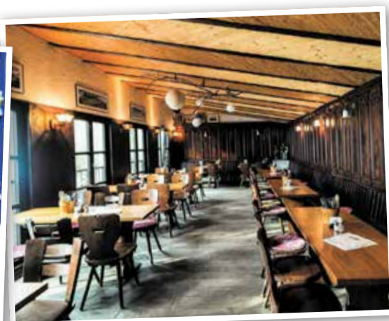
Das urig gemütliche Ambiente lädt zum Verweilen ein

Der Huthpark ist die grüne Oase des Viertels. Hier trifft sich morgens die Jogger-Community, tagsüber rollen Kinder auf dem Spielplatz herum, und am Wochenende wird gegrillt und gechillt. Früher war der Park Teil eines riesigen Kurgebiets, heute ist er einfach ein Stück Natur mitten in der Stadt. Wer die Ruhe sucht, findet sie auf den verschlungenen Wegen, wer sportlich unter-