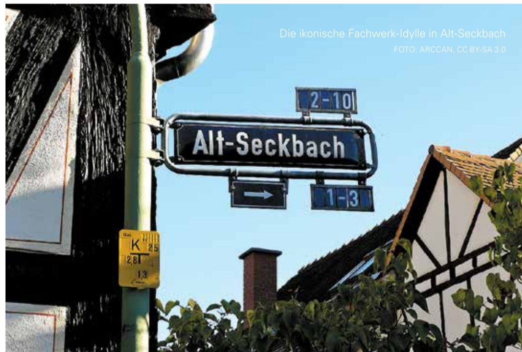
Die ikonische Fachwerk-Idylle in Alt-Seckbach

gang oder als Ziel für einen geselligen Abend: Die Atmosphäre ist entspannt, das Essen