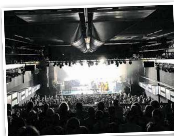
Hier kommt Stimmung auf

Seit Jahrzehnten das Wohnzimmer für Rock, Indie und Hip-Hop: Die Batschkapp ist nicht nur ein Club, sondern eine Institution. Hier schwitzten schon die Größen der Musikszene, von Punk-Ikonen bis hin zu Newcomern. Wer Live Musik liebt, kommt an diesem Spot nicht vorbei – sei es für Konzerte, wilde Partynächte oder einfach ein kühles Bier im Innenhof. Die Stimmung? Authentisch, laut und voller Geschichte. Früher in Eschersheim, jetzt in Seckbach – aber der Spirit bleibt. Ein Ort für echte Musikfans, ohne Schnickschnack, aber mit jeder Menge Herz.