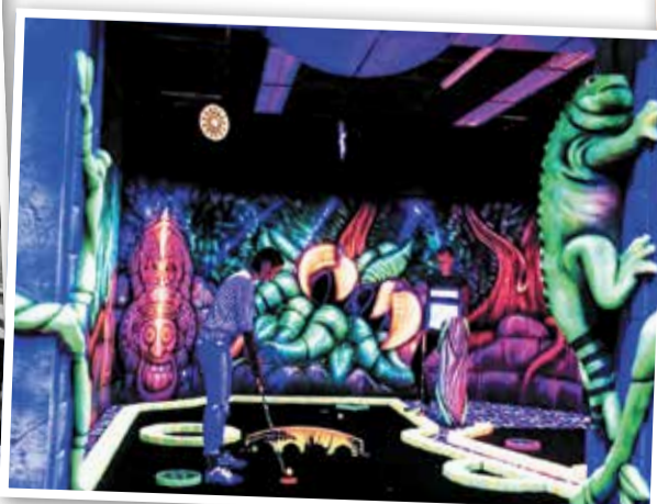
Die tropischen Jungle Themenwelt

In der GlowZone wird zwischen leuchtenden Farben und Schwarzlicht gespielt. Ein bisschen Retro, ein bisschen futuristisch – und jede Menge Spaß. Die 3D-Effekte sorgen für den Extra-Kick, und plötzlich wird das einfache Putten zur echten Herausforderung. Perfekt für Gruppen, Familien oder Date-Nächte mit einer Portion Action. Wer Frankfurt mal aus einer anderen Perspektive erleben will, taucht hier in eine bunte Welt ab. Und keine Sor-