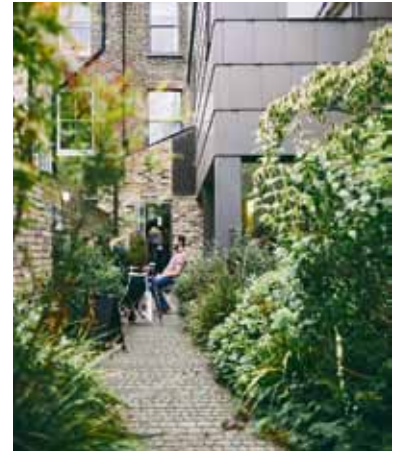
In der passenden Farbe fügen sich die Pflastersteine ideal ins Gesamtbild ein.

können. Besonders interessant sind Vegetationsfugen, wie sie mit den Pflastersteinen von Arena möglich sind. Sie bieten Platz für verschiedenste Pflanzen - vom einfachen Rasen über Blumen bis hin zu kleinen Stauden. Ein dichtes Pflanzenwachstum erhöht die Festigkeit der Fugen und trägt zur Biodiversität im eigenen Zuhause bei. Wichtig: Auch bei Vegetationsfugen sollten technisch ausgefeilte Abstandsnocken zur Stabilität beitragen.