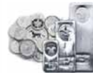
Silbermünzen und -barren