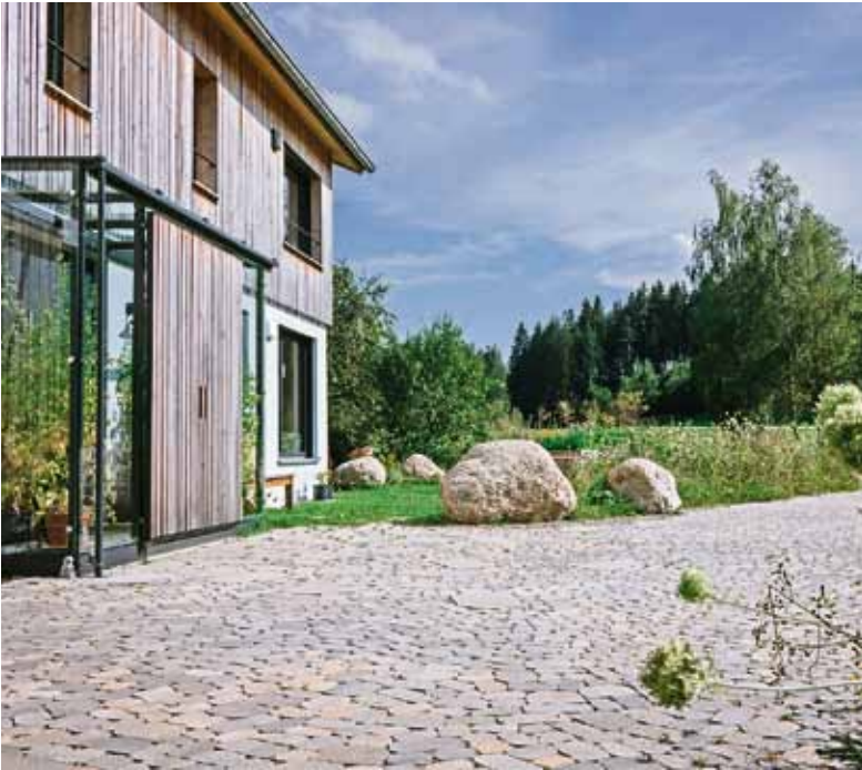
Sieht aus wie normales Pflaster, lässt aber Wasser hindurch: eine nachhaltige Zufahrt.

Welche drei Punkte beim Kauf von nachhaltigen Pflastersteinen zu beachten sind