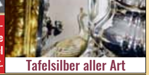
Tafelsilber aller Art