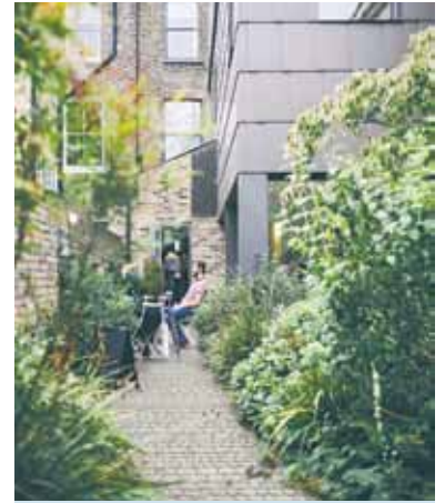
In der passenden Farbe fügen sich die Pflastersteine ideal ins Gesamtbild ein.

können. Besonders interessant sind Vegetationsfugen, wie sie mit den Pflastersteinen von Arena möglich sind. Sie bieten Platz für verschiedenste Pflanzen - vom einfachen Rasen über Blumen bis hin zu kleinen Stauden. Ein dichtes Pflanzenwachstum erhöht die Festigkeit der Fugen und trägt zur Biodiversität im eigenen Zuhause bei. Wichtig: Auch bei Vegetationsfugen sollten technisch ausgefeilte Abstandsnocken zur Stabilität beitragen.