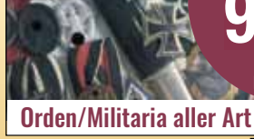
Orden/Militaria aller Art