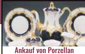
Ankauf von Porzellan