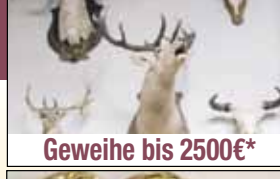
Geweibe bis 2500€*