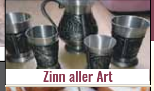
Zinn aller Art