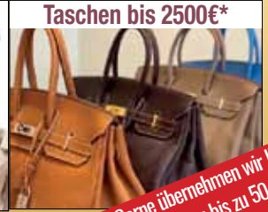
Taschen bis 2500€*

Ankauf von hochwertigen Uhren wie Rolex, Breitling, Ebel Omega etc. gerne auch defekt.