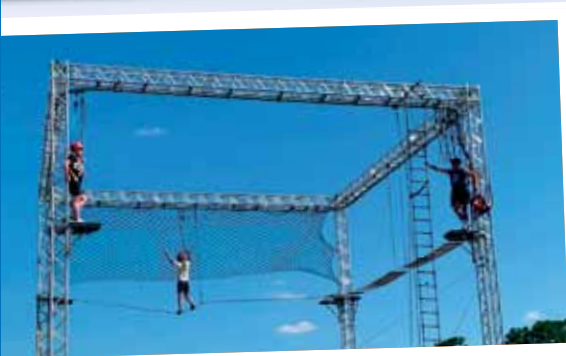
Abenteuerkick in luftiger Höhe im Hochseilklettergarten