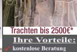
Trachten bis 2500€*