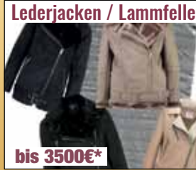
Lederjacken / Lammfelle