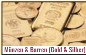
Münzen & Barren (Gold & Silber)