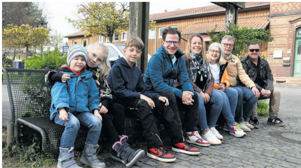
Die Münsterer FDP-Fraktion mit Familienangehörigen auf einer Bank vor dem Münsterer Bahnhof. Mit der Aktion „Münster setzt sich hin - Dank Ihrer Unterstützung“ haben die Liberalen das Sponsoring weiterer Sitzgelegenheiten durch Firmen und Privatpersonen initiiert.

Zugrunde liegt das Wissen, dass mehr als ein Viertel der Einwohner Münsters älter als 60 Jahre ist. Für deren Bedürfnisse trage man eine besondere Verantwortung, sagte Mundelius. Dies äußere sich darin, dass man Mobilität und Barrierefreiheit stets