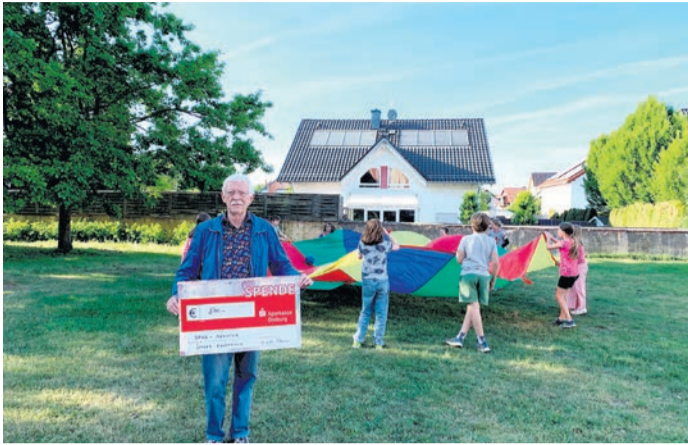
Gleich ausprobiert wurde der „Riesenfallschirm“ in der Gruppenstunde auf dem Gelände des kath. Pfarrzentrums in Münster. Wie man sieht, hatten die Kinder mit der Spende schon großen Spaß.