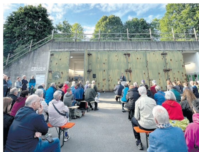
US-Army Atomsprengköpfe. „Der 8. Mai ist die markantes-

Evangelisches Dekanat Vorderer Odenwald veranstaltete Gedenken auf dem Muna-Gelände in Münster/Kooperation mit Landkreis und Gemeinde