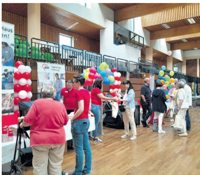
Erster Heusenstammer Seniorentag 2024.

Scherer GmbH, Seligenstädter Bündnis gegen Depression, Senioren-Union Stadtverband Heusenstamm, VdK Ortsverband Heusenstamm (alphabetische Sortierung – Änderungen vorbehalten). Besucherinnen und Besucher können sich Infos und Inspirationen holen, unkompliziert mit den jeweiligen Fachleuten ins Gespräch kommen und Fragen loswerden. Darüber hinaus wird es mehrere Fach- und Impulsvorträge zu unterschiedlichen Themenschwerpunkten geben. Geplant sind Vorträge zu den Themen Einsamkeit, Prävention, Nachbarschaftshilfe und ambulante Unterstützung. Und natürlich ist auch für die Verpflegung zu moderaten Preisen gesorgt. „Ein längeres Leben mit all seinen positiven, aber selbstverständlich auch herausfordernden