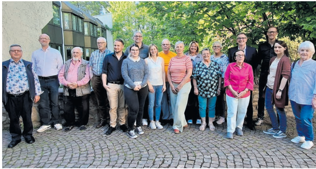
Die Mitglieder des Heusenstammer Seniorengipfels.

Heusenstammer Spieletag am 8. Juni: Die spielebegeisterte Familie Dornburg organisiert am Sonntag, 8. Juni, von 14 bis 20 Uhr ehrenamtlich einen Spieletag in Heusenstamm. Die Veranstaltung findet im Familienzentrum der evangelischen Kirche in der Leibnizstraße 57 statt. Lieblingsspiele können mitgebracht oder vor Ort ausgeliehen werden. Für die Zukunft wünschen sich die Organisatoren eine Zusammenarbeit mit Stadt, Kirchen und Vereinen. Unterstützung wird herzlich willkommen geheißen. Kontakt: brettspielgeister@web.de LebensWERT – Malteser Hilfs-