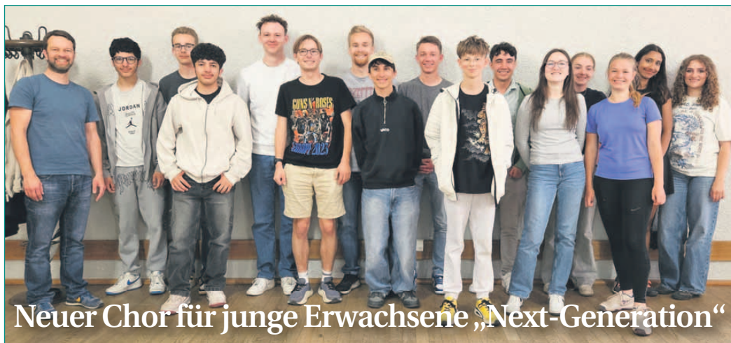
Neuer Chor für junge Erwachsene „Next-Generation“

sche Honigbiene sich noch nicht an diesen Parasit angepasst hat. Imker setzen daher alles daran, den Schwarmtrieb zu kontrollieren und den Schwarmvorgang zu verhindern. Trotz aller Bemühungen lässt sich das Abgehen eines Schwarms jedoch nicht immer verhindern und passiert oft unbemerkt. Sollten in den kommenden Wochen Bienenschwärme im Garten oder im öffentlichen Raum entdeckt werden, bittet der Bienenzuchtverein Seligenstadt Mainhausen Hainburg e.V. um Meldung, damit der Schwarm eingefangen werden kann. Bienenschwärme stellen in keiner Weise eine Gefahr dar, jedoch ist das Überleben des Schwarms ohne die Unterstützung eines Imkers oft nicht gesichert. Meldungen können telefonisch oder per WhatsApp an die Nummer 0152 0187 9587 sowie per E-Mail an schwarmfaenger@bienenzuchtverein.de gesendet werden. Eine genaue Ortsangabe ist dabei wichtig. Weitere Informationen sind auf der Homepage des Vereins unter www.bienenzuchtverein-seligenstadt.de zu finden.