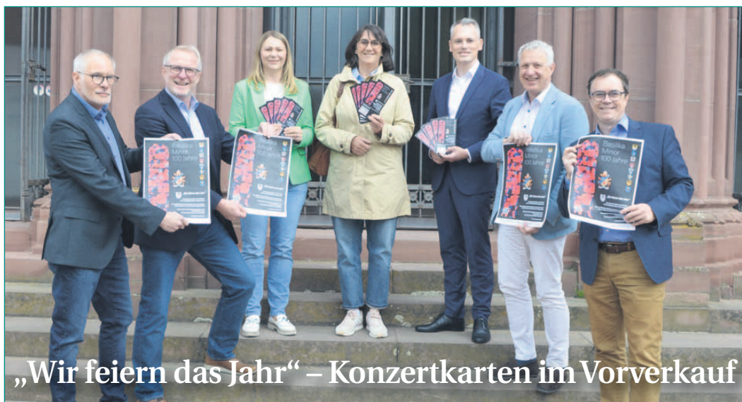
„Wir feiern das Jahr“ – Konzertkarten im Vorverkauf