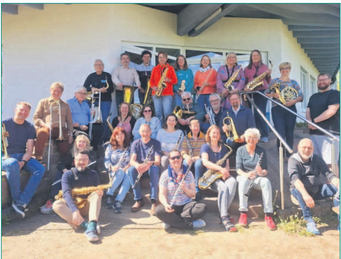
Beim Probenwochenende in der sonnigen Rhön bereitete sich das reFRESHed-Orchestra der Stadtkapelle Seligenstadt auf Pfingsten vor. Neben intensiven Proben standen auch viel Spaß und gemütliches Beisammensein auf dem Programm. Wer sich das Resultat der harten Arbeit anhören möchte, ist herzlich eingeladen, am Pfingstmontag um 15 Uhr in den Klosterhof zum gemeinsamen Konzert mit dem Jugendblasorchester zu kommen.