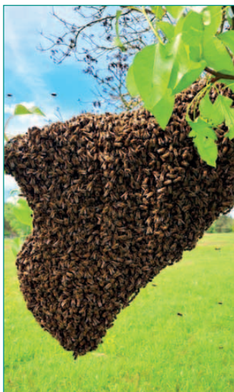
Bienenschwärme bitte melden!

haus. Chorproben finden jeden Freitag um 18.30 Uhr im Clubraum des Bürgerhauses statt. Steffen Bodensohn wird den Chor dirigieren. Interessierte Jugendliche und junge Erwachsene sind natürlich jederzeit willkommen.