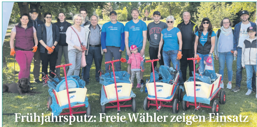
Frühjahrsputz: Freie Wähler zeigen Einsatz