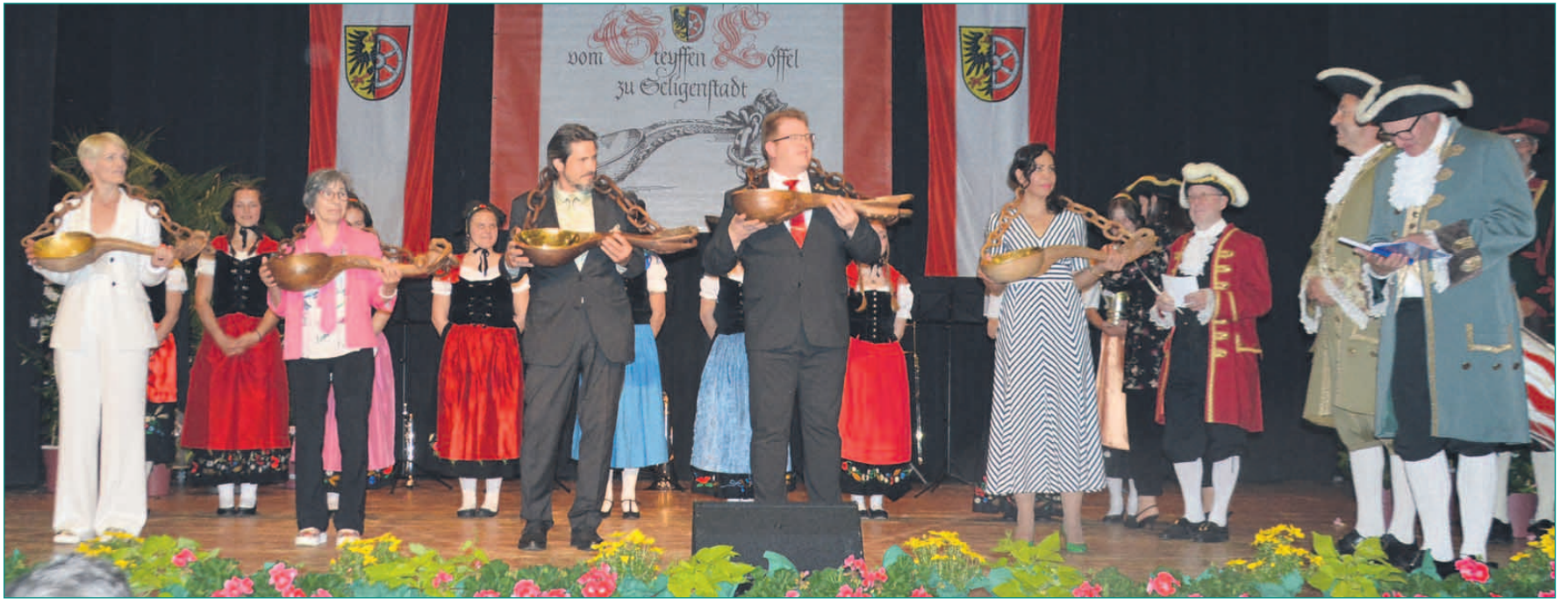
Die Neuen im Bundes der „Ordensbruderschaft vom Steyffen Löffel“ absolvierten ihre Aufnahmeprüfung mit Bravour und leerten die Geleitslöffel in einem Zug mit begleisterem