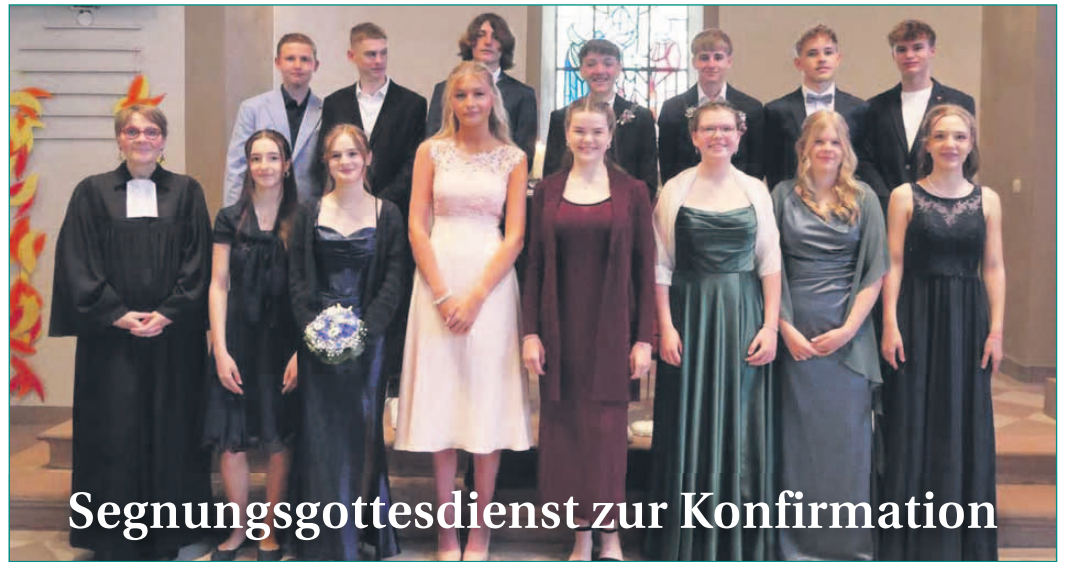
Segnungsgottesdienst zur Konfirmation

zwei Goldringe im Wert von mehreren tausend Euro. Der Täter ist 30 bis 40 Jahre alt, kräftig, hat ein rundliches Gesicht, trägt eine helle Jacke und eine Brille mit dunklem Rand. Er sprach gebrochen Deutsch und führte ein kleines Notizbuch mit sich. Die Polizei bittet dringend um Hinweise unter 06182 8930-0 (Polizeistation Seligenstadt). Präventionstipps: Keine Fremden einlassen, Dienstausweise prüfen, im Zweifel selbst bei Firmen anrufen, bei Verdacht 110 wählen.