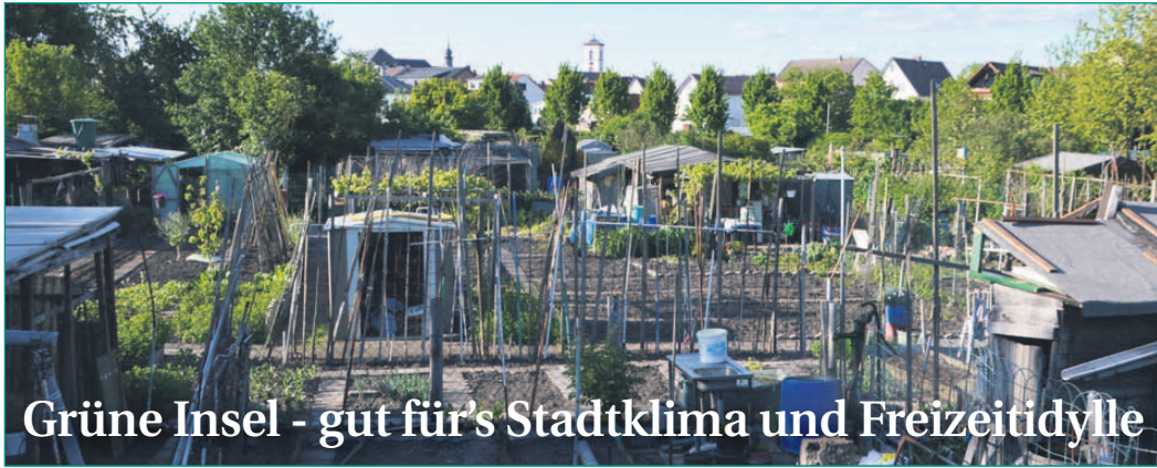
Grüne Insel - gut für's Stadtklima und Freizeitidylle

Frischluftschneisen und Kaltluftleitbahnen sind wichtig für den städtischen Luftaustausch und können die Auswirkungen des Hitzeinseleffekts in Städten reduzieren. Als wichtiges Kaltluftentstehungsgebiet gelten mitten in Seligenstadt die „Schwarzen Gärten“. Durch das Freihalten bzw. die Schaffung von Frischluftschneisen wird kühle Luft aus dem Umland in die Innenstadt hineingeleitet und die von Gebäuden