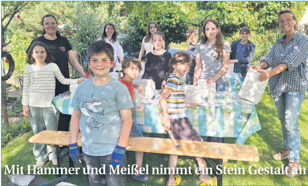
Mit Hammer und Meißel nimmt ein Stein Gestalt an

Seit Herbst 2024 beschäftigen sich Kinder und Jugendliche der Trauergruppe von St. Marien mit dem Thema Stein. Als Abschluss dieser intensiven Zeit gestaltet jeder und jede einen Ytongstein im Gedenken an ihren Papa, Mama, Oma oder Opa. Mit Hammer und Meißel wurde der Stein schon mal auf 's erste bearbeitet. Die teilweise sehr harte Arbeit spiegelt den innerlichen Prozess des Verlustes wieder, aber - wie auf dem Bild zu sehen - hilft es auch bei dessen Verarbeitung. Es bleibt