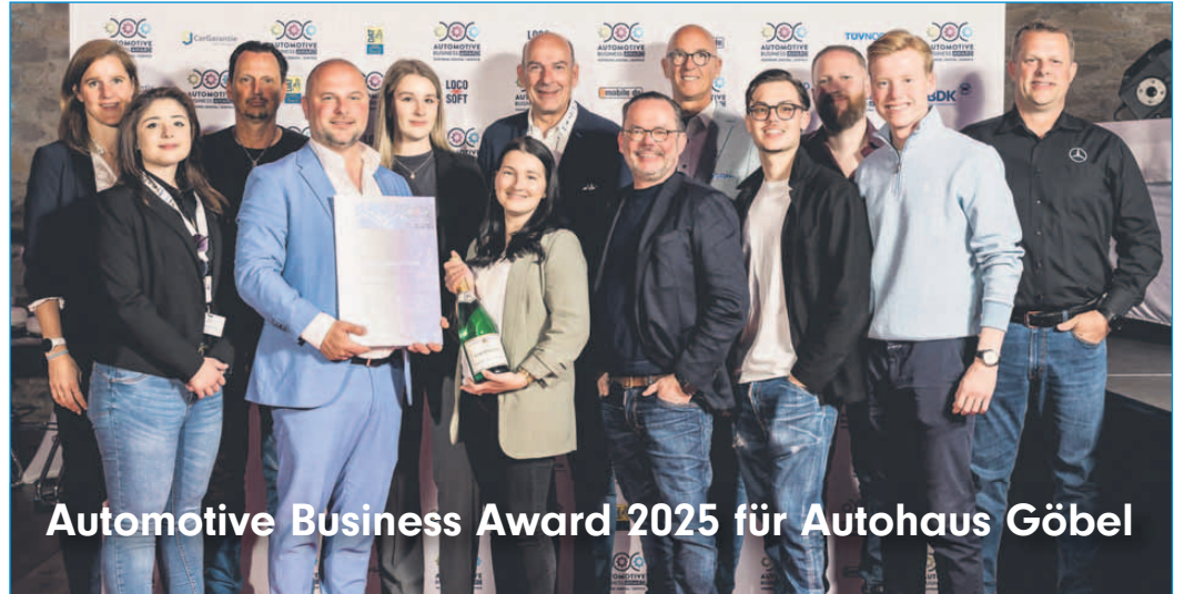
Automotive Business Award 2025 für Autohaus Göbel

che Verantwortung übernehmen. Kriterien sind die Förderung von Vielfalt und Inklusion, die Unterstützung von Vereinsarbeit, die Beteiligung an Netzwerkaktivitäten sowie der Einsatz für Fairness und gerechte Entlohnung. Ansprechpartnerin ist Amira Bieber vom Europäischen Projektmanagement der Pro Arbeit, Telefon 0151 65872760 oder E-Mail a.bieber@proarbeit-kreis-of.de . Sie steht für Vorschläge und Bewerbungen sowie für Rückfragen zu den Modalitäten zur Verfügung. Detaillierte Informationen zum Preis „Arbeitgeber als Chancengeber“ sind unter www.standortplus.de/Preis-Arbeitgeber-als-Chancengeber abrufbar.