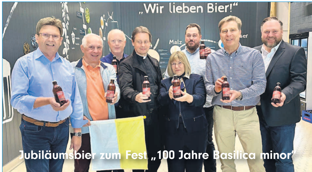
Jubiläumsbier zum Fest „100 Jahre Basilica minor“

Anlässlich des besonderen Jubiläums „100 Jahre Basilica minor“ der Pfarrei St. Marcellinus und Petrus in Seligenstadt wurde dieser Tage das offizielle Jubiläumsbier in der traditionsreichen Glaabsbräu Brauerei vorgestellt. Das eigens für das Jubiläumsjahr gebraute Bier ist ab sofort im regionalen Handel sowie im Seligenstädter Touristenbüro erhältlich. Das naturbelassene Bier begeistert durch seinen feinporigen Schaum und einen fruchtig-aromatischen Duft mit Noten von Honig und Aprikose. Es vereint handwerkliche Braukunst mit einem besonderen Anlass und wird auch beim großen Jubiläumsfest am 31. Mai und 1. Juni 2025 ausgetrennt. Das Festwochenende findet direkt neben der Basi-