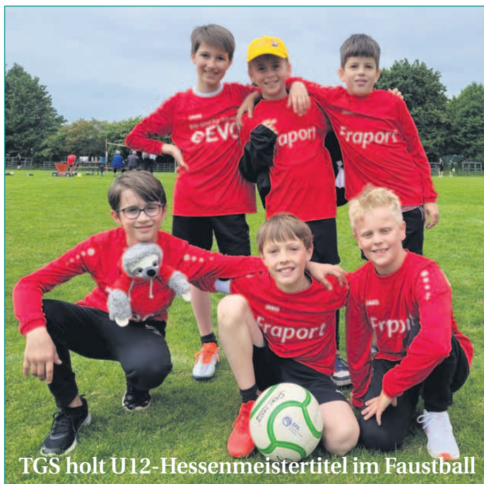
TGS holt U12-Hessenmeistertitel im Faustball

Trotz der aktuellen Herausforderungen blickt die Turngesellschaft Seligenstadt zuversichtlich nach vorne. Der Verein bleibt ein verlässlicher Partner für Sport, Kultur und Gemeinschaft in Seligenstadt – mit einem starken ehrenamtlichen Fundament und dem klaren Ziel, den Hallenneubau endlich Realität werden zu lassen. Anstehende Termine im Vereinsjahr 2025: 07.–08. Juni: Basketball-Pfingstturnier 22.–25. August: Kerb auf dem Jahnsporplatz 06.–07. September: 20. Einarhard-Handball-Cup 15. November: Kampagnenstart Karneval/Januar 2026: Galasitzung Karneval Kontakt: Turngesellschaft Seligenstadt 1895 e. V., Florian Lebherz, Vorsitzender des Vorstands; www.tgsseligenstadt.de