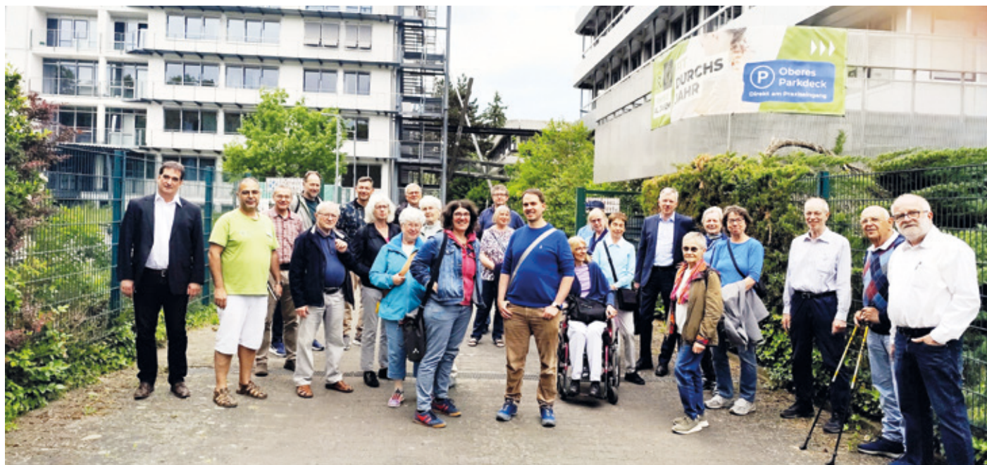
Das Foto zeigt einen Teil der Stadtteilrunden Teilnehmer zu Beginn der Führung vor dem GHV Gebäude.

Besuch von Institutszentrum und Physiotherapie beim Treffen der Kranichsteiner Stadtteilrunde – Schwerpunktthema: Zukunft des Ökumenischen Gemeinde Zentrums