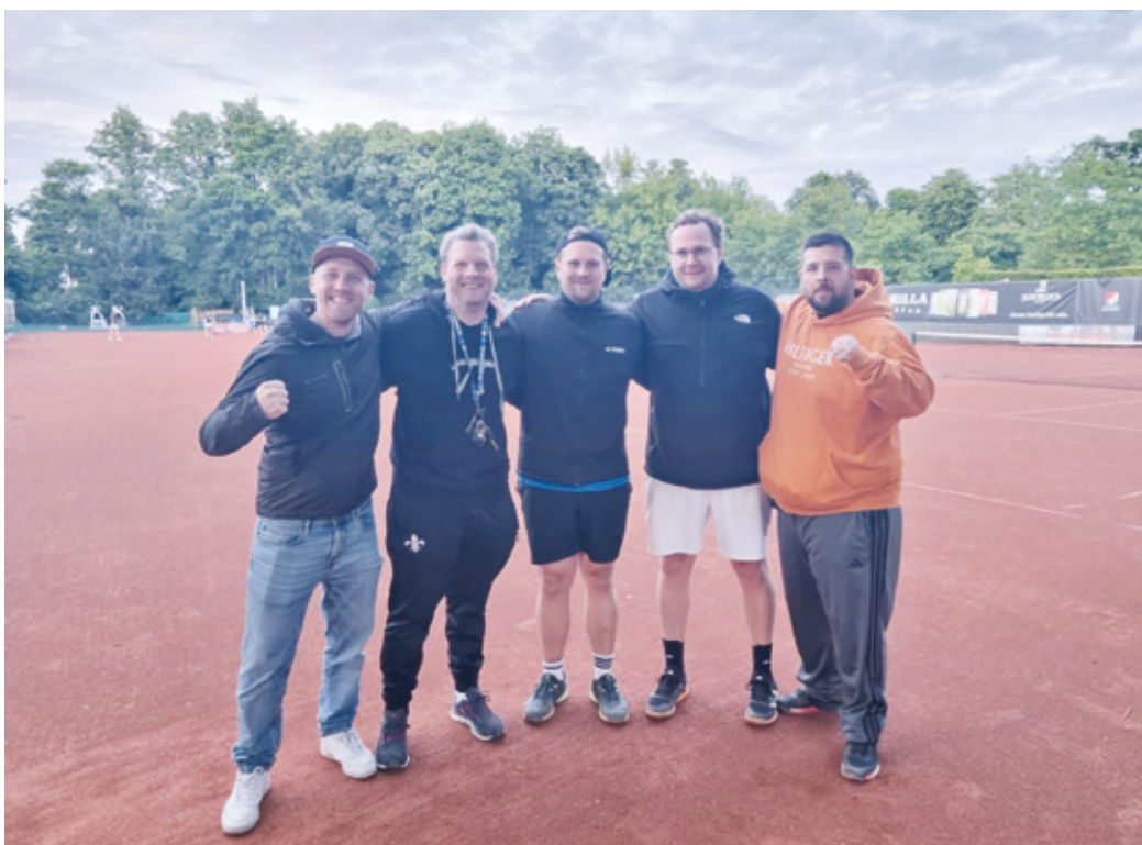
Nach ihrem Unentschieden können sich jetzt die Herren 30 IV über den 6:0 Sieg gegen RW Sprendlingen freuen.