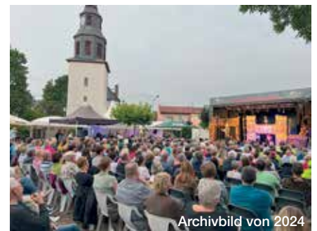
Archivbild von 2024

Auch zum Open-2025 lädt die Stadt Rosbach v. d. Höhe