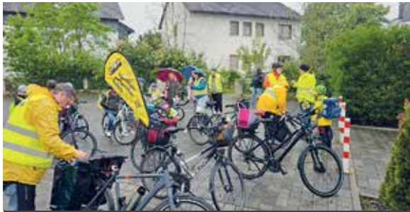
Dem Wetter getrotzt geht es mit Rädern zur Kapersburgschule.

20 Kinder radeln sicher und gut gelaunt zur Kapersburgschule