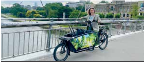
Viel Kapazität bietet das am Rewe-Markt stationierte Lastenrad aus Frankfurt.

Nachhaltige Mobilität zur Aktion STADTRADELN leicht gemacht – Zwei E-Lastenräder stehen bereit