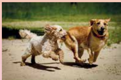
Eine besondere Freude, die Vierbeiner frei laufen zu lassen.

und -besitzer grundsätzlich für solche Schäden verantwortlich. Eine Tierhalter-Haftpflichtversicherung schützt zuverlässig. Die DEVK übernimmt Schäden bis zu 50 Millionen Euro. Auch wer mit seinem Hund ins Ausland reist, sollte auf ausreichenden Versicherungsschutz achten, der beispielsweise Mietsachschäden in der Ferienwohnung umfasst oder längere Aufenthalte abdeckt. Unter www.devk.de/hund kann man sich zum neuen Tierhalterschutz informieren.