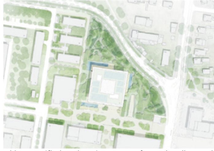
Abb. 15: Freiflächenplan, Siegerentwurf 2024.

Die Begründung der Gebäudehöhe jedoch mit der dargestellten Abwicklung der Baulichkeiten entlang der Ostfront des Betriebsgeländes ist nicht überzeugend. Sie betrachtet nur das Werksgelände und klammert den Übergang zur nördlichen Nachbarschaft und damit zu der auf der anderen Seite der Virchowstraße und der Frankfurter Landstraße vorherrschenden zweigeschossigen Bauweise am Ortseingang von Arheilgen aus. Mit der Festsetzung einer maximalen Bauhöhe von 20 Meter im Bereich des A 29 war damals ein moderater Übergang zu den Baulichkeiten auf dem Betriebsgelände gefunden worden und an dieser städtebaulich gut begründeten Regelung sollte nichts geändert werden. 45 statt 20 Meter Gebäudehöhe sind weder eine geringfügige Abweichung von den Festsetzungen noch bedeuten 20m Bauhöhe eine unzumutbare Härte für das Unternehmen.