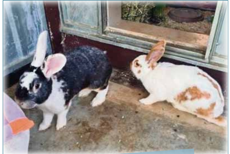
Zora und Zorro

Tierherberge Egelsbach | https://tierherberge-egelsbach.de Tel. 06103-49336 | E-Mail: hunde@tierherberge-egelsbach.de