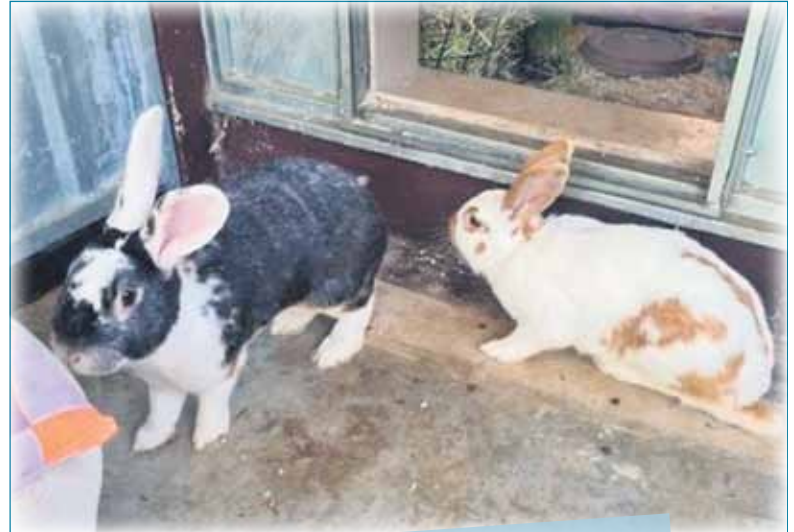
Zora und Zorro

Tierherberge Egelsbach | https://tierherberge-egelsbach.de Tel. 06103-49336 | E-Mail: hunde@tierherberge-egelsbach.de