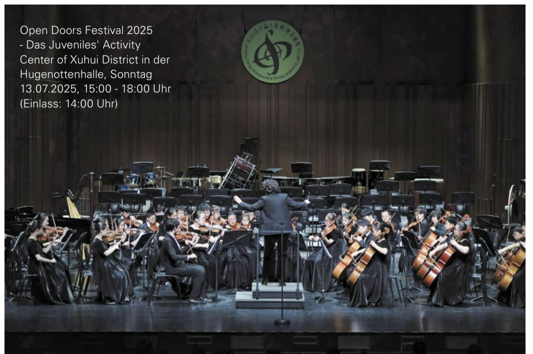
Open Doors Festival 2025 - Das Juveniles' Activity Center of Xuhui District in der Hugenottenhalle, Sonntag 13.07.2025, 15:00 - 18:00 Uhr (Einlass: 14:00 Uhr)

Das Juveniles' Activity Center of Xuhui District in der Hugenottenhalle