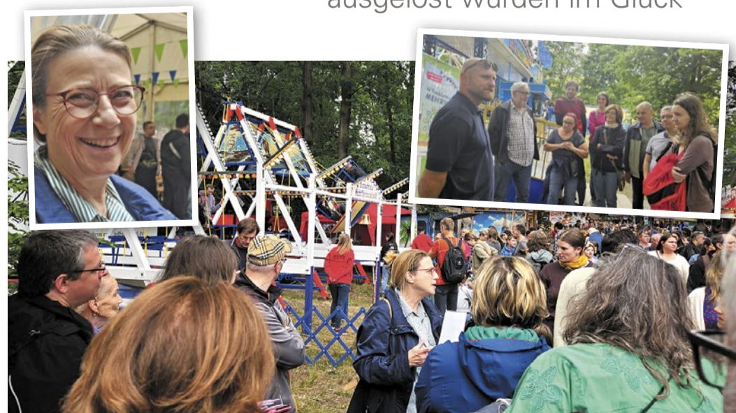
Skyline Blick, Blick hinter die Kulissen und Geschichtliches – alles mitten im Treiben des Pfingstmontags war zu erleben.

Fünf Gewinner-Paare die von der TCF und DER FRANKURTER ausgelost wurden im Glück