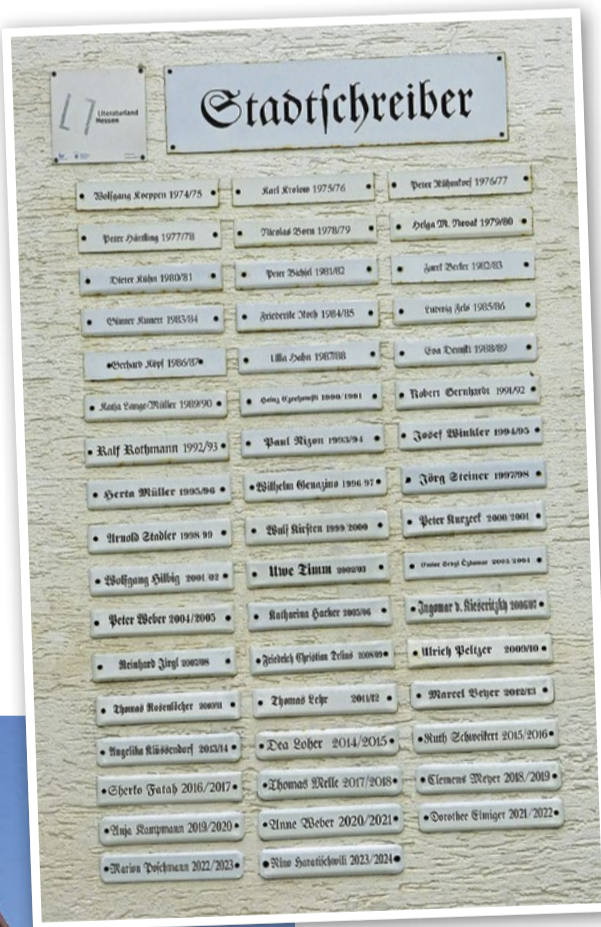
Die Namenschilder der vergangenen Stadtschreiber

Wer Frankfurt von einer neuen Perspektive sehen will, ist