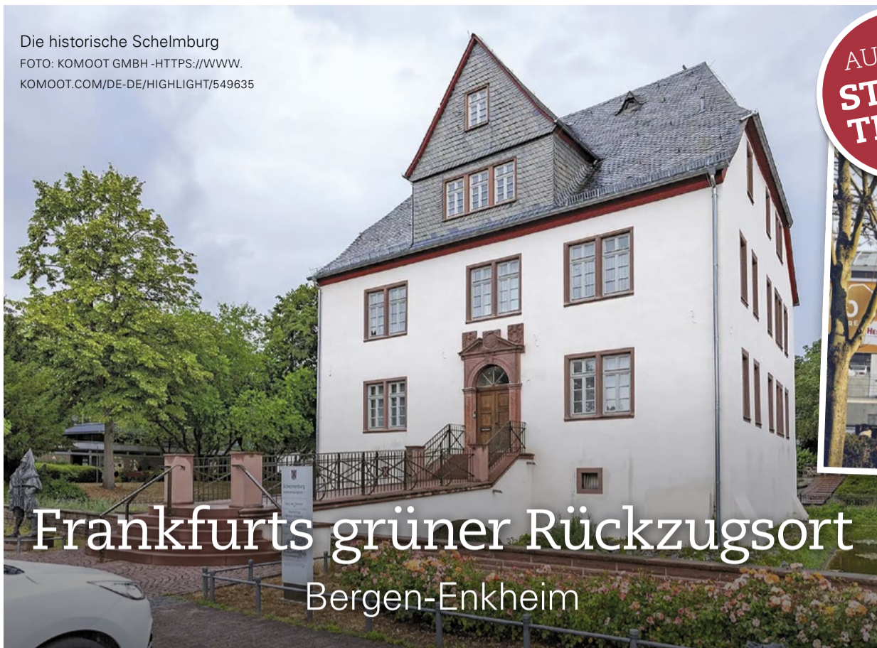
Die historische Schelmburg