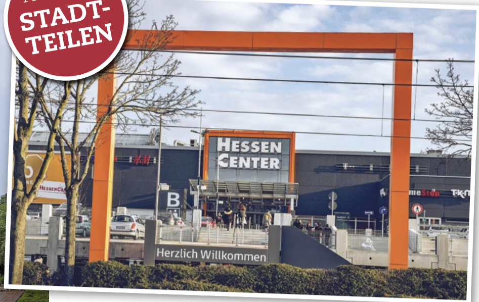
Blick auf den Haupteingang