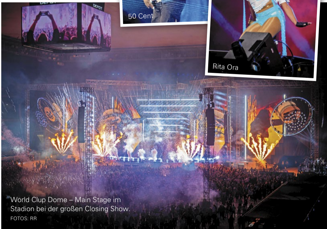
World Club Dome – Main Stage im Stadion bei der großen Closing Show.