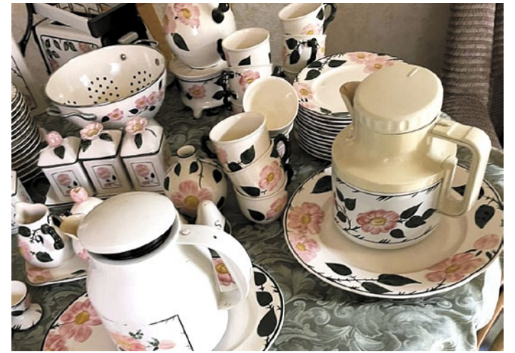
Geschirr nutzen ist besser als kaufen.

LIEBFRAUENBERG/NIEDERRAD (RED) | Die Endlichkeit unserer Ressourcen ist zwischenzeitlich ein großes Thema für zukunftsorientierte Projekte geworden. Dazu passt die Teilerei in Frankfurt Niederrad, gibt sie doch Dingen, die von ihren Eigentümerinnen und Eigentümern nicht mehr gewollt werden, eine zweite oder auch dritte und vierte Chance. Entstanden aus einer Bürgereingebung im sogenannten „Zero Waste Lab“, einem Portal zur Ideensammlung für ein nachhaltigeres Frankfurt, wurde die Teilerei 2024 ins Leben gerufen. Der Umsonst-Laden bietet Kleidung, Spielzeug, Haushaltsgeräte und vieles mehr. Mit einem zweiten Standort im ehemaligen FES- Servicecenter am Liebfrauenberg kann im Juni ausprobiert, getestet, geteilt und