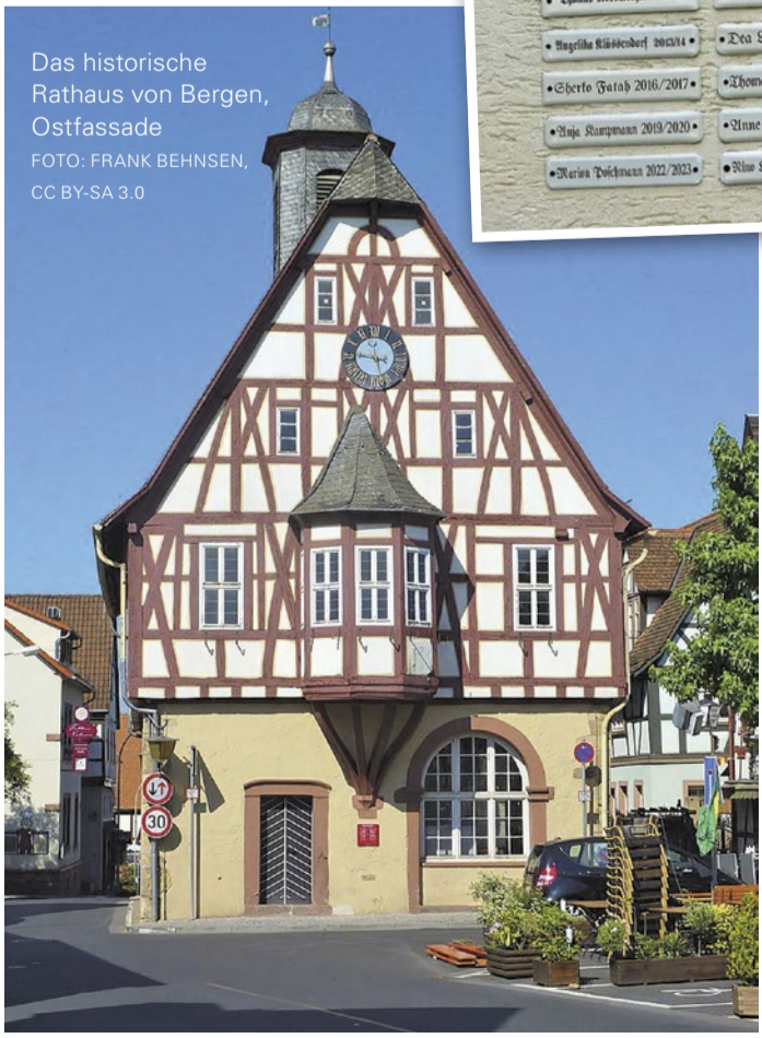
Das historische Rathaus von Bergen-Enkheim, Ostfassade

eröffnet, ist eines der ältesten Einkaufszentren Frankfurts – und trotzdem kein bisschen verstaubt. Mit über 100 Geschäften, Restaurants und Cafés gibt es hier alles, was das Shopping-Herz begehrt. Ob große Modeketten oder kleine Boutiquen, ob Technik oder Delikatessen – hier ist für jeden etwas dabei. Ein besonderes Highlight: die regelmäßigen Veranstaltungen, von Modeschauen bis zu Kinderfesten. Wer eine Pause braucht, gönnt sich einen Kaffee oder spaziert danach ins Grüne – denn der Berger Hang ist nur einen Katzensprung entfernt.