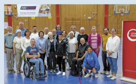
Die Teilnehmer*innen des ersten Treffens zur „Allianz für Inklusion im Sport“.