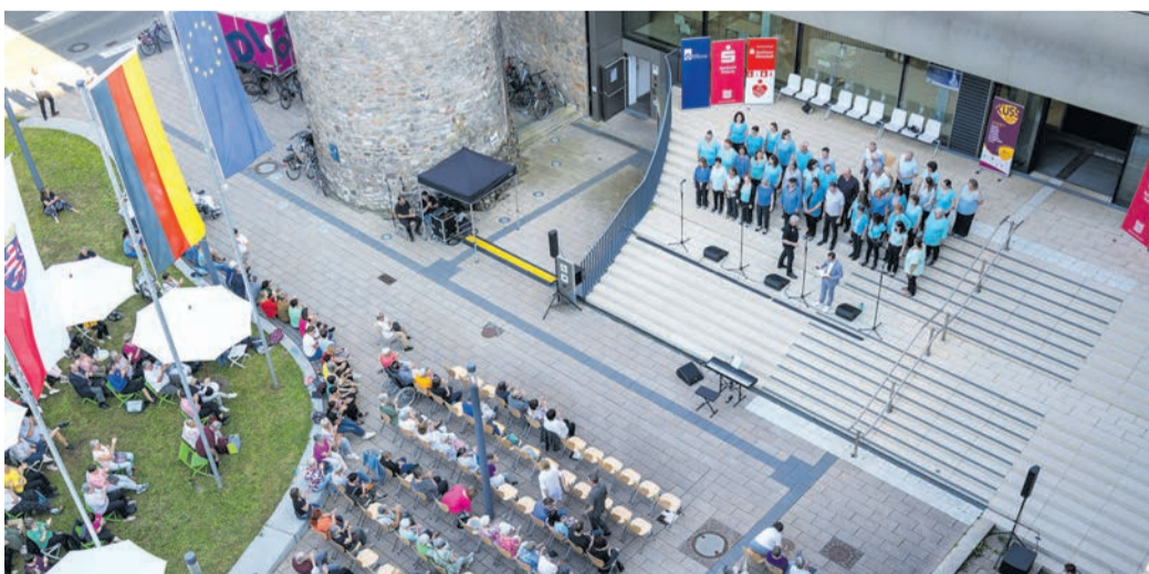
Treppenkonzert am Kreishaus Dieburg im vergangenen Jahr.