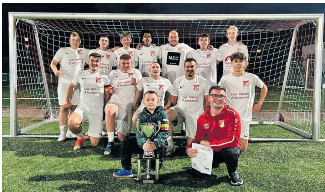
Siegermannschaft Jedermann-Turnier: FV Äppertshausen.

Der Samstag stellte dann die Organisatoren vor eine echte Herausforderung: Ein Mammutprogramm mit vier Turnieren, 34 Mannschaften und insgesamt 83 Spielen wartete auf die Helfer. Bei bestem Fußballwetter und fast 1000 begeisterten Spielern und Gästen wurde den Helferinnen und Helfern alles abverlangt. Doch dank einer hervorragenden Organisation lief alles reibungslos und die Zuschauer konnten sich auf ein spannendes Fußballfest freuen! Die Turniersiege gingen an die TS Ober-Roden (E1), Germania Bieber (E2), TSV Schott Mainz