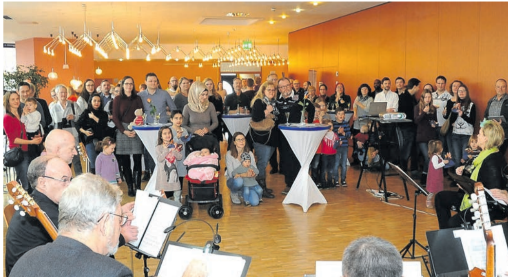
Ein Foto vom bis heute letzten Münsterer Neubürgerempfang 2019 in der Kulturhalle. Die Gemeindevertreter haben nun beschlossen, das Format ab 2026 alle zwei Jahre wieder aufleben zu lassen.

Münster (jedö) Vor Corona gab es in Münster schon mal, was es ab 2026 wieder geben soll: einen Neubürgerempfang der Gemeinde. Dabei hießen nicht nur Vertreter der Verwaltung, sondern auch Münsterer Vereine die frisch Zugezogenen willkommen, stellten sich und ihre Angebote vor und ermöglichten in ungezwungener Atmosphäre eine erste Vernetzung. Mit der Pandemie kam das Angebot ab 2020 zum Erliegen. Im März unternahm deshalb die Münsterer FDP den Vorstoß, die Gemeinde möge den Empfang ab 2026 alle zwei Jahre wieder veranstalten. Nach zwischenzeitlicher Beratung in zwei Ausschüssen stimmten die Gemeindevertreter aller vier Fraktionen dem Vorhaben in ihrer Mai-Sitzung unisono zu.