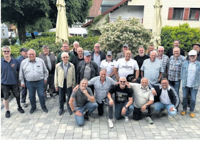
Tour im nächsten Jahr. Ein großes Dankeschön gilt „Pik“ für die erneut hervorragende Vorbereitung und Organisation dieser gelungenen Fahrt.

So genossen die Teilnehmer bei bestem Ausflugs Wetter unterhaltsame Tage in herrlicher Landschaft. Natürlich kam auch die Geselligkeit nicht zu kurz. Bei Frohsinn und Gesang vergingen die Tage wie im Fluge und die Teilnehmenden freuen sich schon jetzt auf die