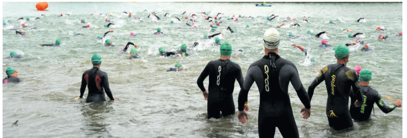
Blick über den Sickenhöfer See direkt nach dem Start eines Rennens beim „Moret Triathlon“ des VfL Münster. Nächsten Sonntag steigt die größte und wirtschaftlich wichtigste Veranstaltung des Vereins zum 41.-mal. Mit seinen 475 Mitgliedern sieht sich der VfL nicht nur dabei diversen Herausforderungen gegenüber.

wieder ein ehrenamtliches Meisterstück abliefern und zei- gen, dass der Verein intakt ist. Sorgenfrei sind die Münsterer aus verschiedenen Gründen freilich nicht - und ein anderes Traditionsevent bleibt weiter in der Versenkung. Gemeint ist der Gersprenzlauf, mit dem der VfL fast drei Jahr- zehnte lang die Volkslauf-Sze- ne zu verschiedenen Rennen (bis hin zum Halbmarathon) im Münsterer Gersprenzstadi- on versammelte. Für 2024 hatte der Verein zunächst das Comeback der Veranstaltung angekündigt, dann auf eine organisatorisch bedingte Ver- schiebung in 2025 verwiesen.