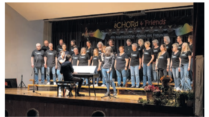
Chor „da capo“ beim Auftritt in Hähnlein.