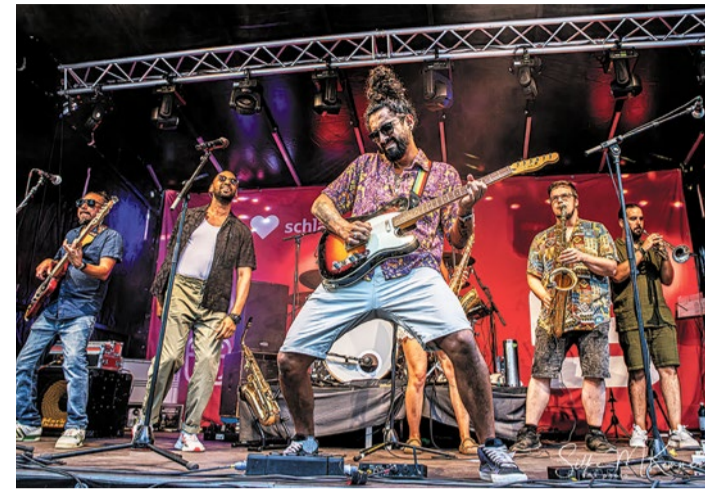
Makia bei den Open Doors 2024.

In diesem Jahr reihen sich neue musikalische Orte in die Perlenkette der Frankfurter Straße ein: Zum ersten Mal dabei sind der Lorenz Fabrikladen, der