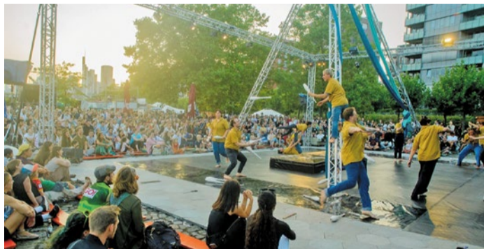
Jonglage – Kollektiv Kinem Sommerwerft 2024.

bleibt die städtische Förderung stabil – ein wichtiges Signal in Zeiten knapper Kulturmittel. Ein Höhepunkt ist das integrierte TREES-Festival vom 30. Juli bis 3. August: Performances, Workshops und Diskussionen thematisieren Wald, Bäume und Klimaschutz – Ergebnis eines EU-weiten Creative-Europe-Projekts von Protagon e.V. und Partner:innen.