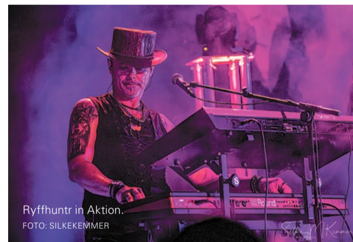
Ryffhuntr in Aktion.

Ein kultureller Höhepunkt: China ist 2025 unser Partnerland. Junge Künstlerinnen und Künstler präsentieren traditionelle Klänge und moderne Interpretationen – ein musikalischer Brückenschlag zwischen Ost und West.