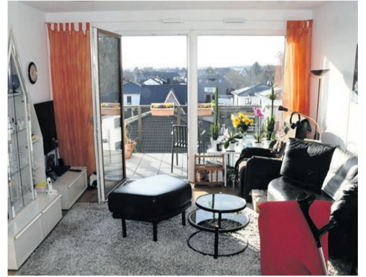
Viel Tageslicht und Ausblick übers Neubaugelände „Am Abteiwald“: das Wohnzimmer des Ehepaars Fanghänel.

weiter und hat zur Abwicklung einen Hausverwalter eingesetzt. Die Fanghänels zogen kurz vor Weihnachten in ihre neue Wohnung ein. Die ist 80 Quadratmeter groß, lässt viel Tageslicht ein, hat ein helles Wohnzimmer, ein Arbeitszimmer, eine Küche, ein Schlafzimmer mit eigenem Bad und ein Gästebad. „Die Wohnung ist so konzipiert, dass sie auch eine Pflegekraft mitbewohnen könnte“, erläutert Günter Fanghänel. Sie könnte prinzipiell das Arbeitszimmer und das Gästebad nutzen. Aktuell hat das Paar diesbezüglich freilich keinen