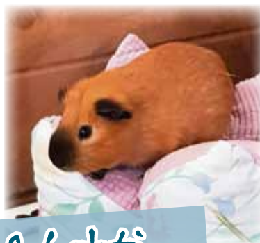
Helsinki & Lahti