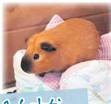
Helsinki & Lahti