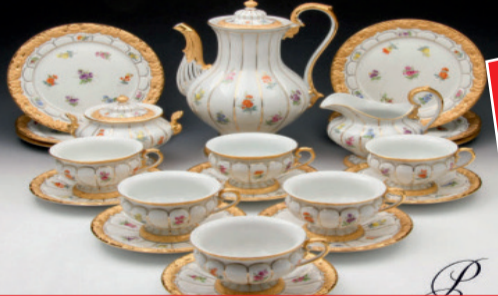
Porzellan namhafter Hersteller**