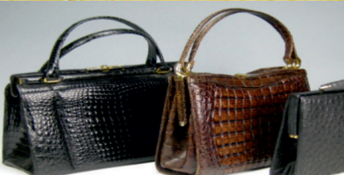
Wir zahlen bis zu 800,- € für Krokotaschen

Wir zahlen bis zu 2.500,- €** für alte Gemälde, Tierpräparate, Porzellanpuppen, Kamin + Standuhren und Porzellan