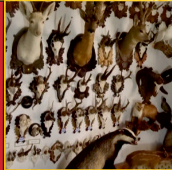
Tierpräparate aller Art**

Montag bis Freitag 10 - 18 Uhr Samstag 10 - 16 Uhr