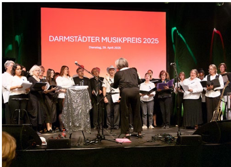
Stipendiaten zum Darmstädter Musikpreis 2025 Internationaler Chor