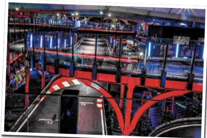
Racing-Erlebnis auf mehreren Etagen

Wenn der Kopf voll ist, hilft nur eins: abheben! Im Superfly, dem Trampolinpark gleich ums Eck, geht's hoch hinaus – auf Sprungtüchern, in Schaumstoffgruben, über Hindernisse und Wände. Für Kids, Teenies und Erwachsene mit Restenergie ist das der perfekte Ort zum Austoben. Alles ist bunt, schnell, ein bisschen verrückt – und genau das macht den Reiz aus. Hier geht's nicht ums Gewinnen, sondern ums Loslassen. Wer nicht springt, schaut eben zu. Hauptsache Bewegung, Musik und Spaß. Und während draußen der Alltag wartet, fühlt sich drinnen alles kurz schwerelos an. Ein guter Ort, um Höhenluft zu tanken – mitten im Viertel, aber wie in einer anderen Welt.