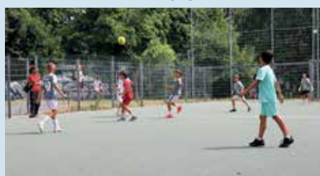
Das U10-Finale fand dieses Jahr in Bockenheim statt.

Mehr zur Bolzplatzliga: https://sportkreis-frankfurt.de/bolzplatzliga-f43/