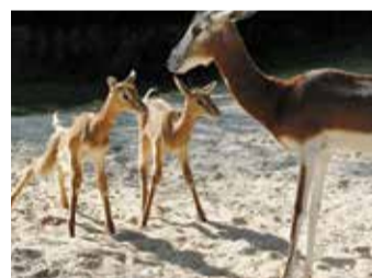
Die Mhorrhgazellen Jungtiere.

Der Zoo Frankfurt beteiligt sich seit 1989 am Europäischen Zuchtprogramm (EEP) für Mhorrhgazellen – die Art gilt weiterhin als „vom Aussterben bedroht“ (IUCN).