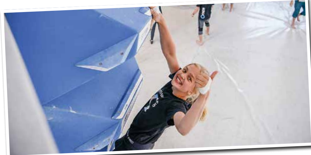
Die größte Boulderhalle im Rhein-Main Gebiet

Die TSG 1957 Frankfurter Berg sowie viele weitere Vereine findet ihr auf dem MainovaSport Portal, wo sämtliche Sportangebote übersichtlich gebündelt sind.