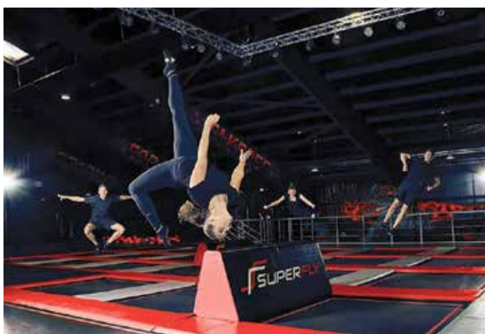
Abheben oder Deine neuesten Tricks üben