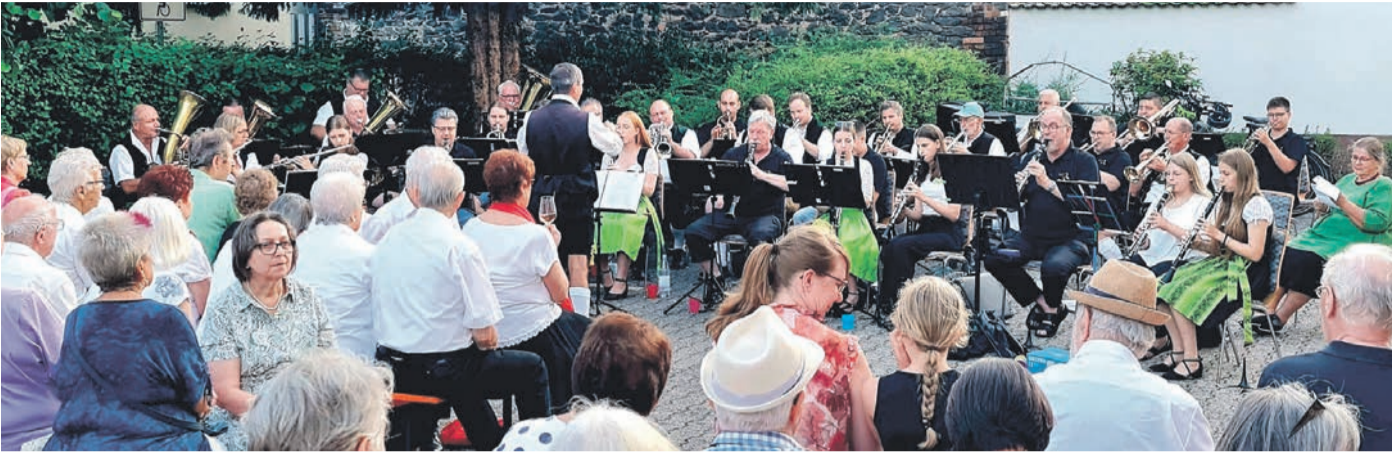
Die Musikvereine Dudenhofen und Großwallstadt musizierten sehr zur Freude der zahlreichen Besucher gemeinsam.