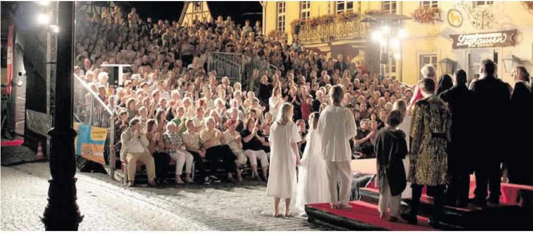
Am 19. Juli startet die Kulturabteilung mit einem Bus voller theaterinteressierter Münsterer zur Aufführung von „Die Geierwally“ beim Erbach-Michelstädter Theatersommer.