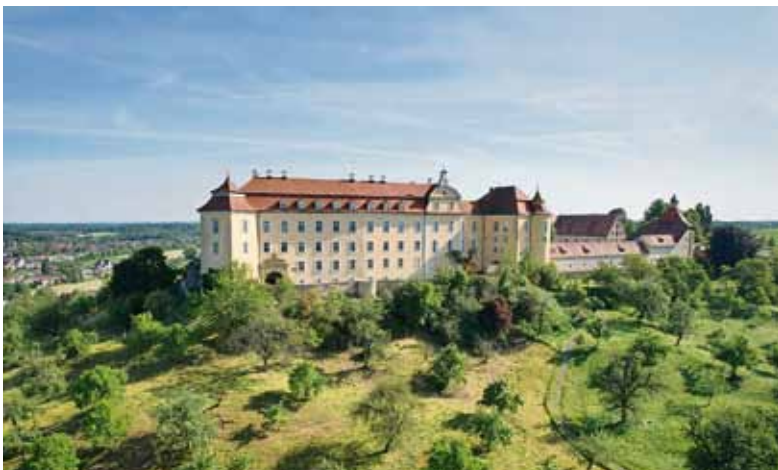
Über der Stadt erhebt sich das Schloss ob Ellwangen.

In jeder der 20 Kleinstadtperlen gibt es ein unterschiedliches Stempel-Motiv, das man sammeln kann. Wer fünf Stempel zusammenhat, darf sie vor Ort in der Tourist-Information für eine Überraschung einlösen. Bei zehn gesammelten Stempeln kann man per Post oder Zeigmal-App an einem Gewinnspiel teilnehmen. Zu gewinnen gibt es eine Reise für zwei Personen in eine Kleinstadtperle der Wahl.