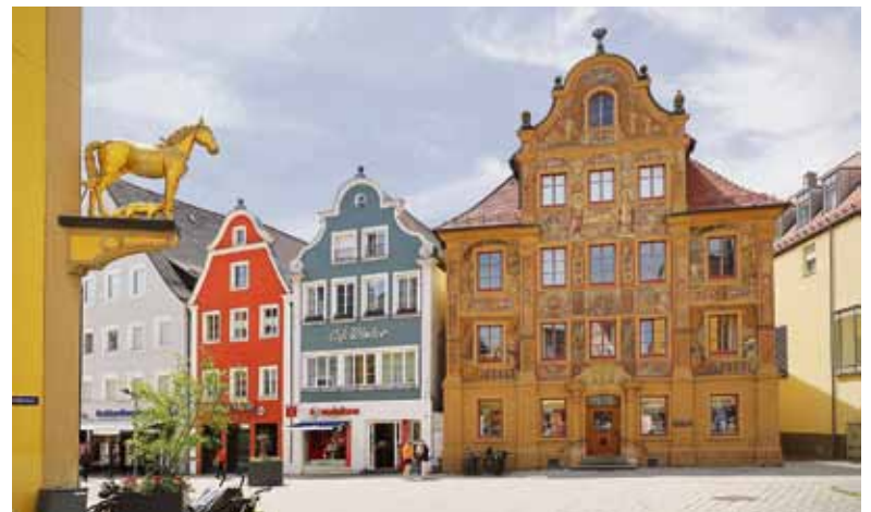
Das kunstvoll gestaltete Gebäude am Fuchseck ist ein beliebtes Fotomotiv.