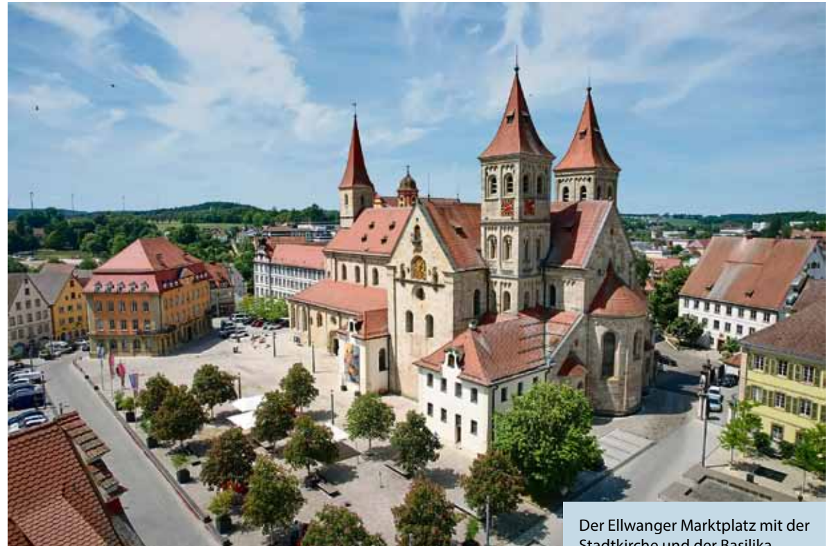
Der Ellwanger Marktplatz mit der Stadtkirche und der Basilika St. Vitus.

Wer mehr zur Geschichte der Stadt erfahren möchte, kann eine Stadtführung machen. Unter www.ellwangen-tourismus.de/stadtfuehrungen