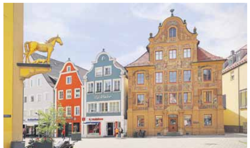
Das kunstvoll gestaltete Gebäude am Fuchseck ist ein beliebtes Fotomotiv.