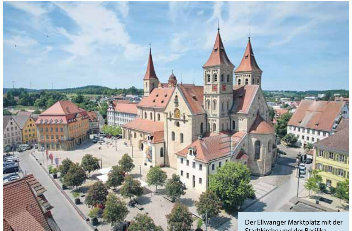
Der Ellwanger Marktplatz mit der Stadtkirche und der Basilika St. Vitus.

Wer mehr zur Geschichte der Stadt erfahren möchte, kann eine Stadtführung machen. Unter www.ellwangen-tourismus.de/stadtfuehrungen