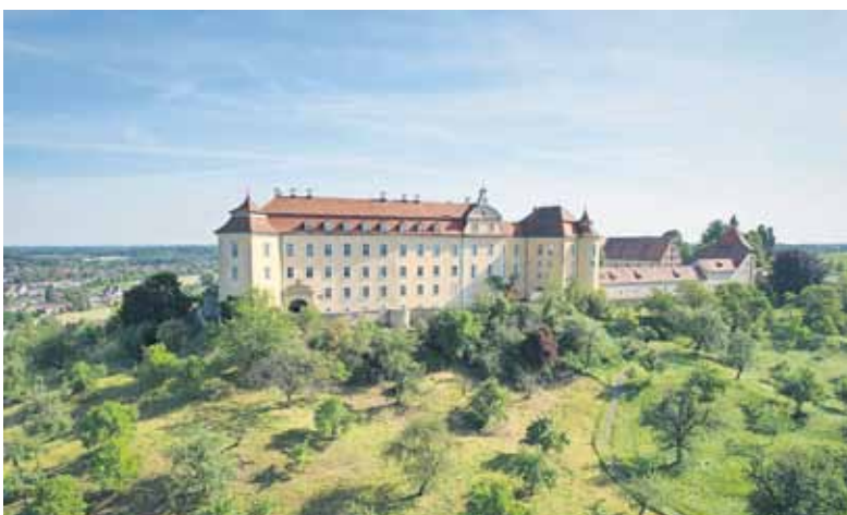
Über der Stadt erhebt sich das Schloss ob Ellwangen.

In jeder der 20 Kleinstadtperlen gibt es ein unterschiedliches Stempel-Motiv, das man sammeln kann. Wer fünf Stempel zusammenhat, darf sie vor Ort in der Tourist-Information für eine Überraschung einlösen. Bei zehn gesammelten Stempeln kann man per Post oder Zeigmal-App an einem Gewinnspiel teilnehmen. Zu gewinnen gibt es eine Reise für zwei Personen in eine Kleinstadtperle der Wahl.