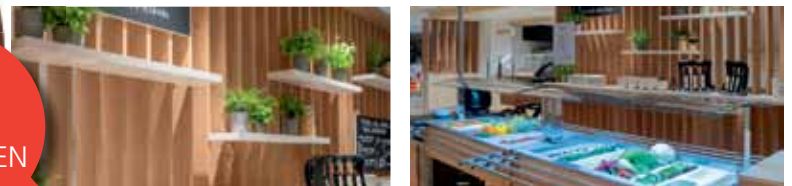
Beispielbilder aus dem HEINRICHs in Aschaffenburg

Wir freuen uns, Ihnen das neue Konzept HEINRICHs by Möbel Kempf schon bald vorstellen zu können.