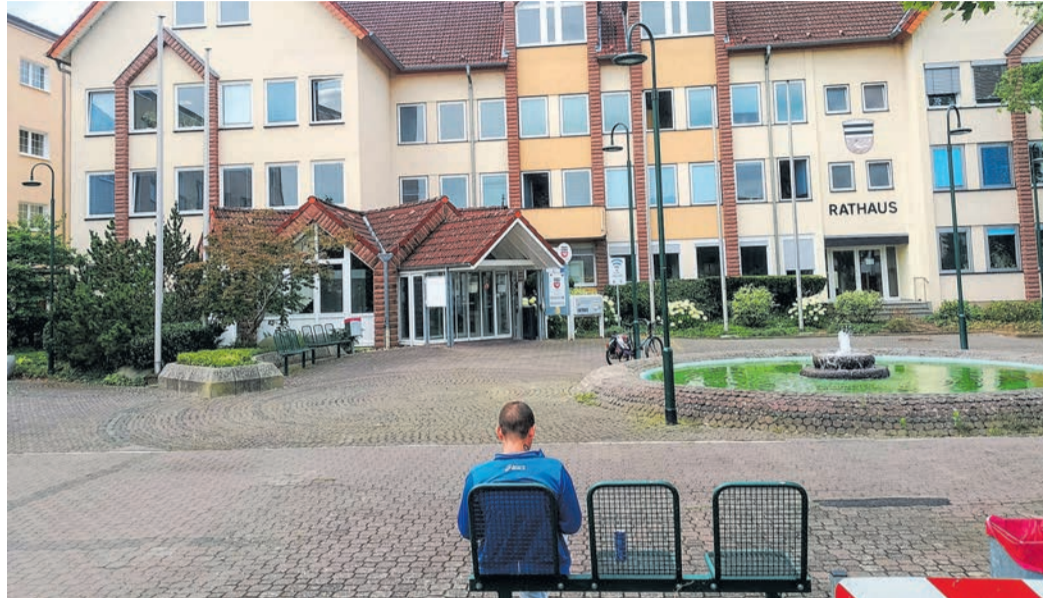
Der Münsterer Rathausplatz gilt als sehr beschauliches Fleckchen. Mit einer Afterwork-Party startet der Gewerbeverein einen neuen Belebnungsversuch.