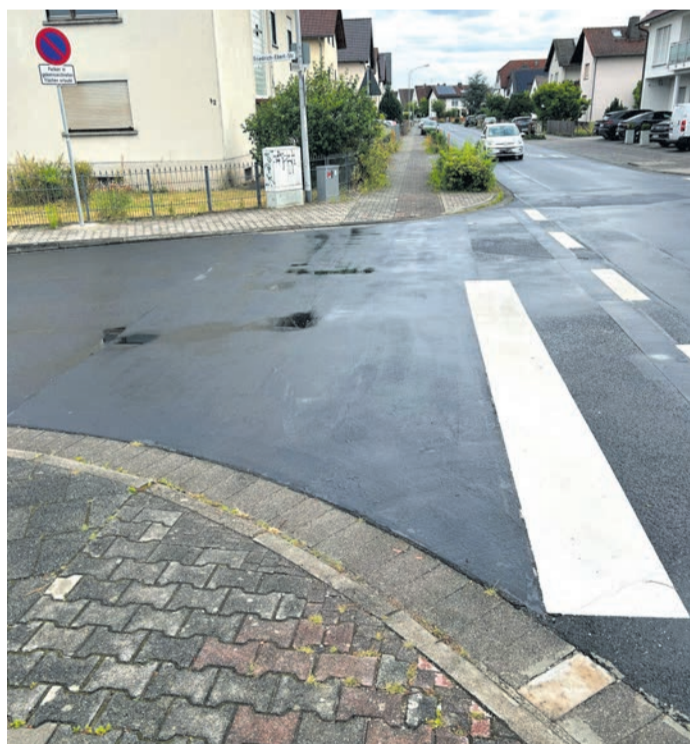
Die roten Radweg-Markierungen in den Kreuzungsbereichen der Goethestraße wurden nun entfernt, Haltelinien zum Teil neu aufgetragen.

Münster (MA) Schon seit Langem sorgen die roten Radweg-Markierungen entlang der Goethestraße für Verwirrung. Zum Hintergrund: Bei der Neugestaltung der Straße vor Jahrzehnten wurde der Gehweg farblich zweigeteilt, um Radfahrern die Möglichkeit zu geben, den rot gepflasterten Streifen zu nutzen. Damals galt auf der Goethestraße noch ein Tempolimit von 50km/h (statt heute 30 km/h) und die Verantwortlichen wollten den Radlern eine sichere Ausweichmöglichkeit bieten. Eine Pflicht dafür gab es jedoch nie, es handelt sich also nicht um einen offiziellen Fahrradweg - daher stehen hier auch nirgendwo die runden, blauen Schilder mit dem weißen Fahrradsymbol. Der komplette Gehweg ist unabhängig von der Farbe Fußgängern und Rad fahrenden Kindern bis maximal 10 Jahre vorbehalten. Alle anderen Radlerinnen und Radler nutzen die Straße. Autofahrer müssen Rücksicht nehmen. Rote Pflastersteine auf Gehwegen werden nicht ausgetauscht Um Missverständnissen vorzubeugen, wurden die besonders auffälligen, roten Radweg-Markierungen auf der Fahrbahn in sechs Kreuzungsbereichen entlang der Goethestraße kürzlich entfernt. Teilweise muss-