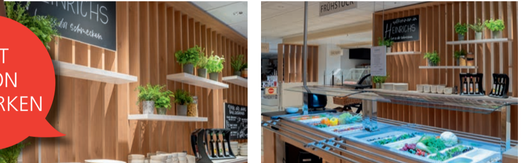
Beispielbilder aus dem HEINRICHs in Aschaffenburg