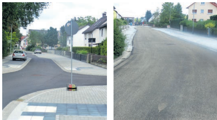
Die grundhafte Straßensanierung der Gumbertseestraße (links) und Gartenstraße (rechts) ist soweit abgeschlossen. Während die Gumbertseestraße für den Verkehr wieder freigegeben ist, steht dies noch in der Gartenstraße an. Demnächst folgen noch Markierungsarbeiten und auch die Beschilderung.

Obertshausen (NZO) Die grundhafte Straßensanierungen der Gartenstraße und der Gumbertseestraße sind auf der Zielgeraden: Am Dienstag, 22. Juli, sind die Markierungsarbeiten in beiden Straßen vorgesehen. So stehen dann Markierungen für Parkplätze und Tempo-30 an. In den kommenden Wochen werden noch Leitbaken an den Baumschutzgittern angebracht sowie die dauerhafte Beschilderung der Gumbertseestraße und Gartenstraße montiert.