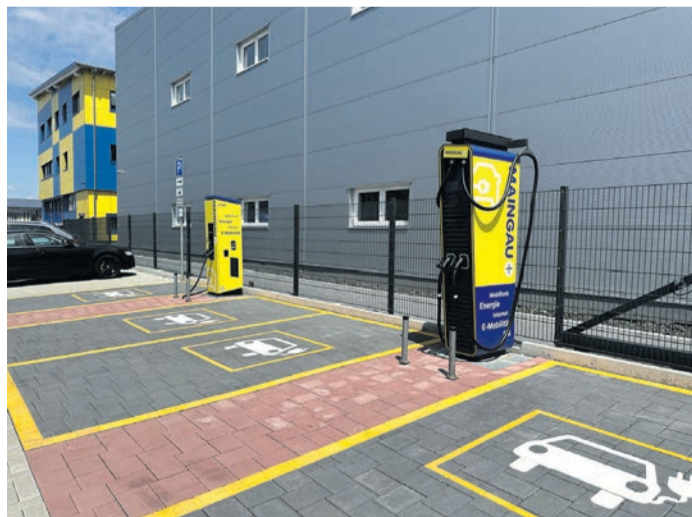
In Betrieb: Die neuen Ladesäulen in der Industriestraße in Obertshausen warten mit drei DC-Ladepunkten und einem AC-Ladepunkt auf.

Obertshausen (NZO) Das Energieunternehmen MAINGAU eröffnet einen neuen Standort zum Schnellladen von Elektroautos in Obertshausen. Direkt angrenzend an den Firmenstandort werden in der Industriestraße fortan zwei Ladesäulen mit insgesamt vier Ladepunkten betrieben. E-Mobilisten steht eine DC-Ladesäule mit einer Gesamtleistung von bis zu 150 kw Ladevolumen zur Verfügung. An einer weiteren Säule können 50 kw bzw. am AC-Ladepunkt 22 kw geladen werden.