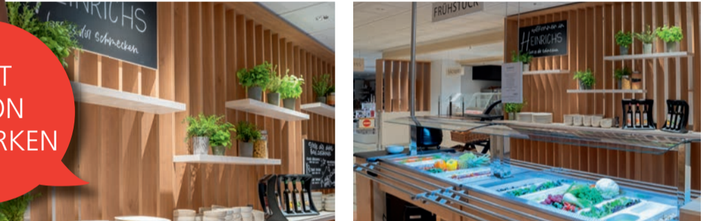
Beispielbilder aus dem HEINRICH'S in Aschaffenburg