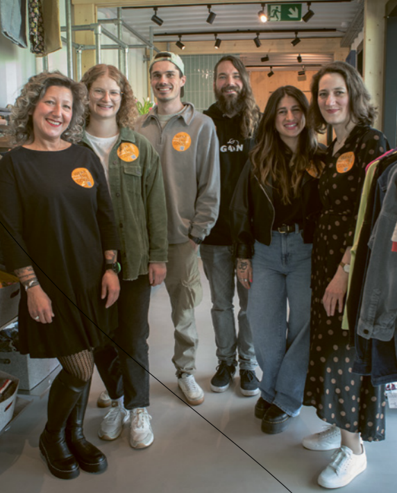
Das GAIN-Store Leitungsteam