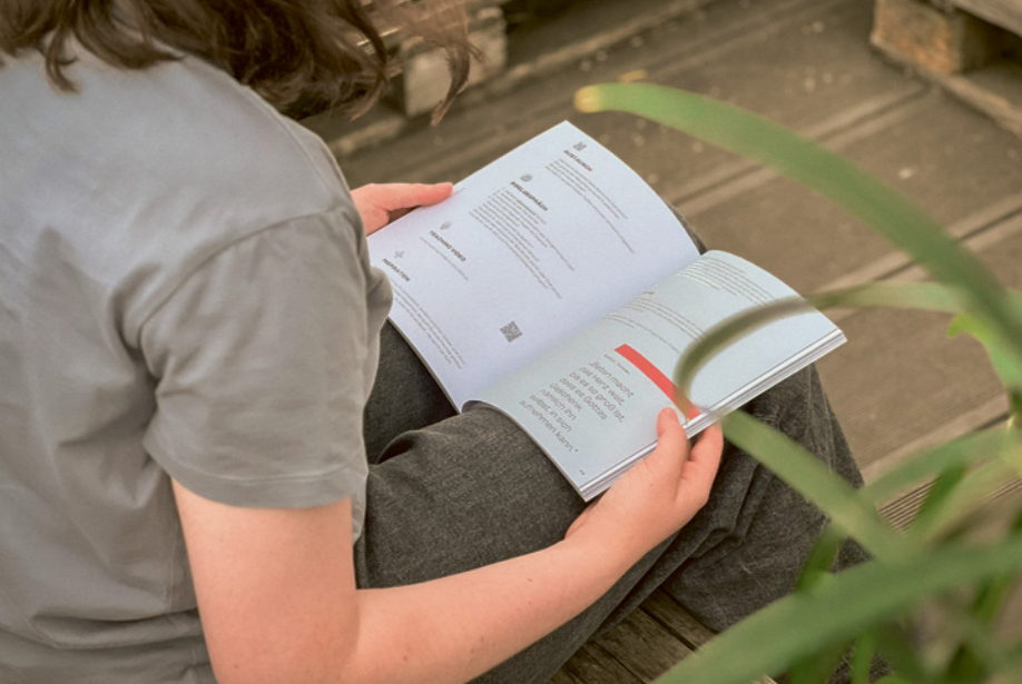
MyFriends Kleingruppenheft – Glaube im Alltag leben