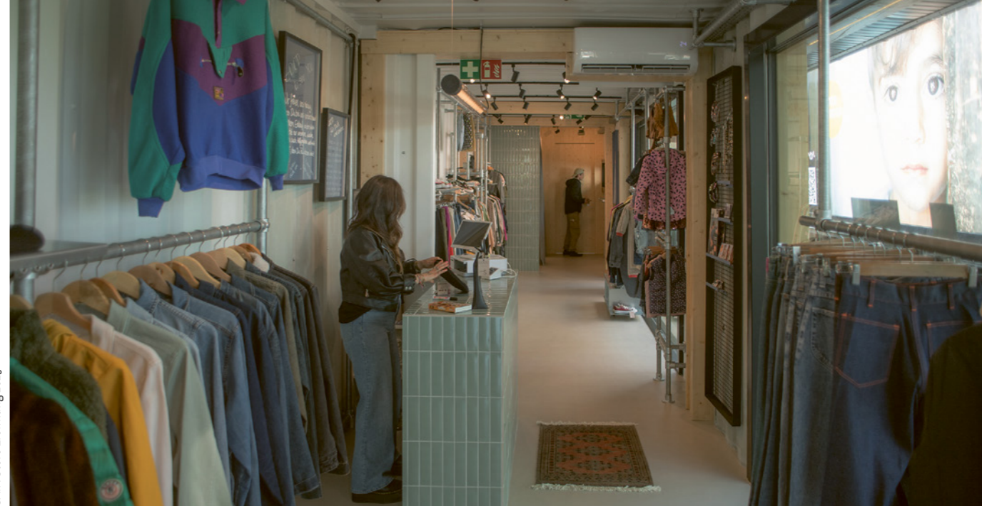
GAIN Store Eröffnung 2025

SOWAS HAB ICH SCHON LANGE GESUCHT: EINEN LADEN, DER GÜNSTIG GUTE WARE ANBIETET UND DAMIT MENSCHEN HILFT.