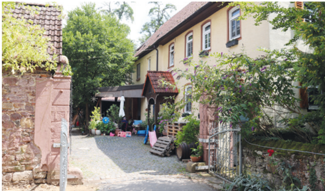
Die Ottilienmühle am Wixhäuser Mühlbach in neuem Flair. Eröffnung des Hofladens mit kleinem Cafébetrieb am kommenden Freitag (01.08.) um 10.30 Uhr.