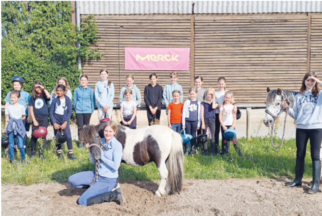
Viel Spaß hatten die Kinder von Merck-Mitarbeitern bei ihrer Ferienwoche am Reitverein Arheilgen.

Erlebnisreiche Ferienwoche für pferdebegeisterte Kinder von Merck-Mitarbeitern