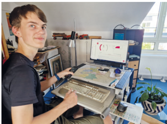
Lias bei der Arbeit.

Neben Arbeit ein unterhaltsamer Nachmittag Die beiden kommen ins