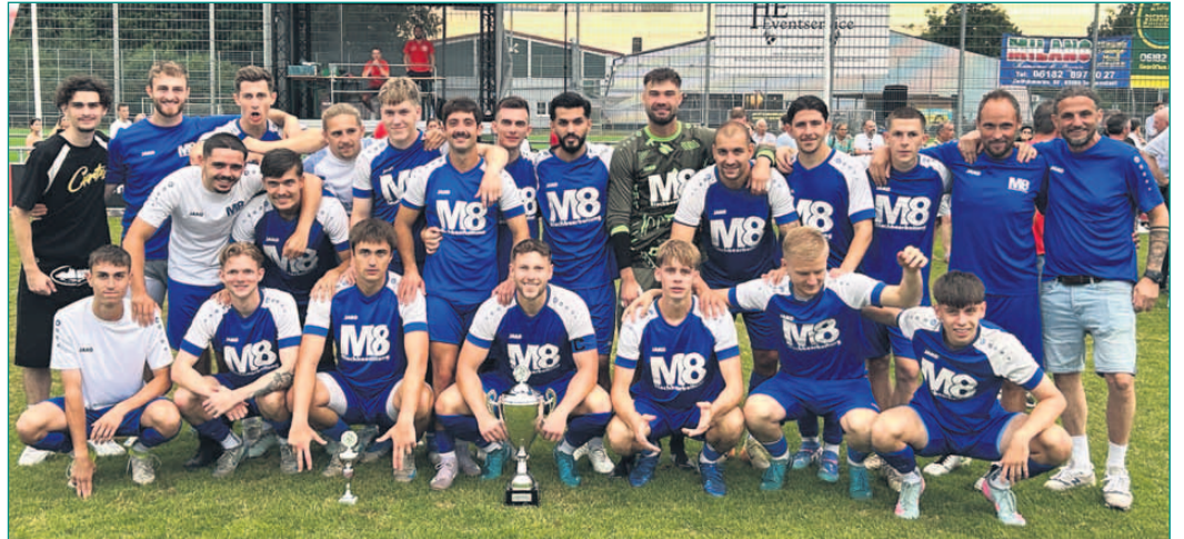
Die strahlende Mainpokal-Siegermannschaft der SG Langstadt-Babenhausen.