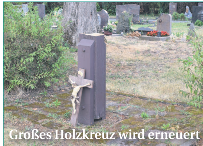
Großes Holzkreuz wird erneuert

„Aufgrund eines Hinweises aus der Bürgerschaft haben wir das vermutlich seit den 1960er Jahren auf dem neuen Friedhof befindliche Holzkreuz auf dessen Standfestigkeit überprüft. Es bestand zwar keine akute Gefahr, aber das Holz zeigte sich doch deutlich morsch. Wir haben daraufhin bei einem Schreiner vor Ort