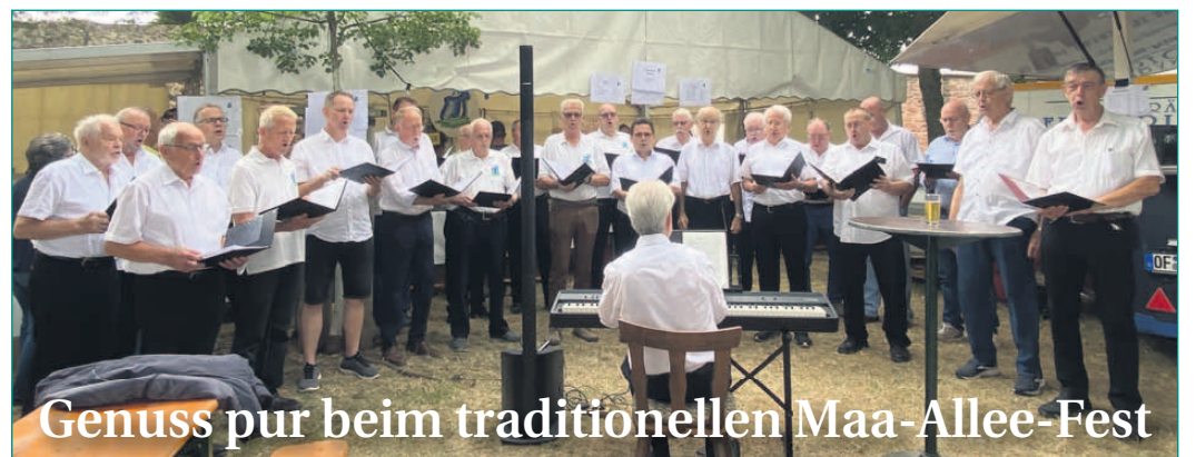
Genuss pur beim traditionellen Maa-Allee-Fest

Bei Sommerwetter feierte der Sängerkorps der Turngemeinde (TGM) sein Maa-Allee-Fest unter den mächtigen Lindenbäumen – idyllisch direkt am Main gelegen. Die Bierzeltgarnituren schlängelten sich entlang des Mainweges und boten reichlich Platz im Schatten zum gemütlichen Verweilen. Mit einer großen Auswahl an Speisen und Getränken genossen Gäste und Gastgeber gleichermaßen die besondere Atmosphäre. Romantische Beleuchtung am Abend und stimmungsvolle Live-Musik rundeten