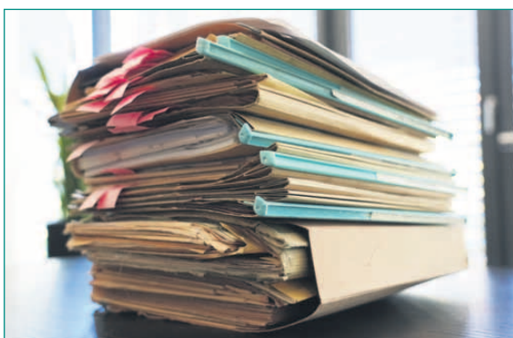
Die Bauakten aus dem 70er Jahren.

Wer entsprechendes Material besitzt, wird gebeten, sich beim Vereinsring oder direkt bei der Leiterin des Arbeitskreises zu melden: E-Mail: vorsitzender@vereinsring-froschhausen.de , Telefon: Astrid Jasnoch, 0172 / 66 43 275. Die Unterlagen werden digitalisiert und selbstverständlich an die Eigentümer zurückgegeben.