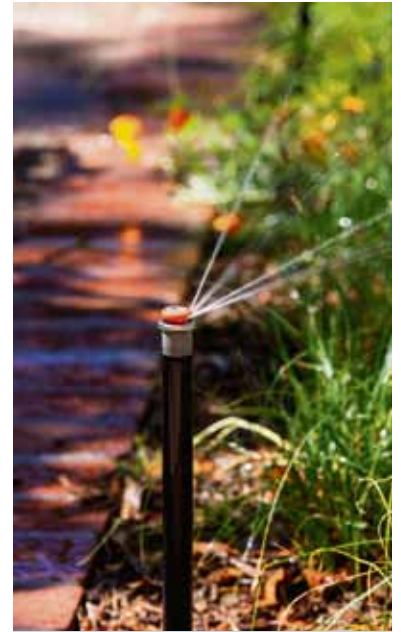
Eine gut dosierte Gartenbewässerung sorgt für ein gesundes Wachstum der Pflanzen.

Die Bedienung moderner Bewässerungssysteme ist heutzutage einfach und flexibel. Per App kann die Bewässerung von überall aus mit dem Smartphone gesteuert werden. So bleiben Rasen und Beete auch während des Sommerurlaubs in Topform. Unter www.rainpro.de etwa finden sich detaillierte Informationen und eine Kontaktmöglichkeit für eine individuelle Beratung. Damit die Bewässerung effizient arbeitet, ist eine fachgerechte Planung essenziell. Die Anlagengröße sollte sich an die individuellen Gegebenheiten des eigenen Gartens orientieren. So stellt die smarte Bewässerung nicht nur eine Arbeitserleichterung dar, sondern leistet zugleich einen nachhaltigen Beitrag zur Schonung der Wasserressourcen.