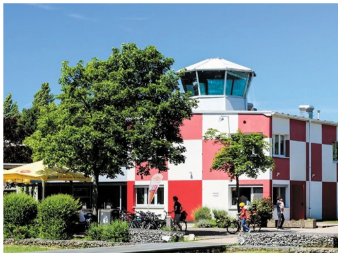
Der Kontrollturm des alten Flugplatzes

Wo früher Flugzeuge abhoben, wächst heute eine wilde, grüne Oase. Der Alte Flugplatz Bonames ist ein echtes Paradies für Spaziergänger, Naturfans und Familien. Zwischen alten Tower-Gebäuden, bunten Blumenwiesen und weiten Flächen lässt es sich wunderbar schlendern, Drachen steigen lassen oder einfach den Blick in den Himmel schicken. Kinder lieben die offenen Weiten, Hunde toben über die alten Landebahnen, und auf der Terrasse des Towers gibt's