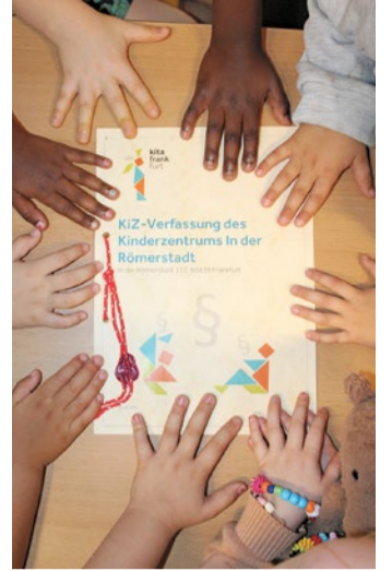
Die „KiZ-Verfassung“ des Kinderzentrums in der Römerstadt

Der Alltag im KiZ ist spürbar konfliktärmer – ein Erfolg für gelebte Kinderrechte bei Kita Frankfurt.