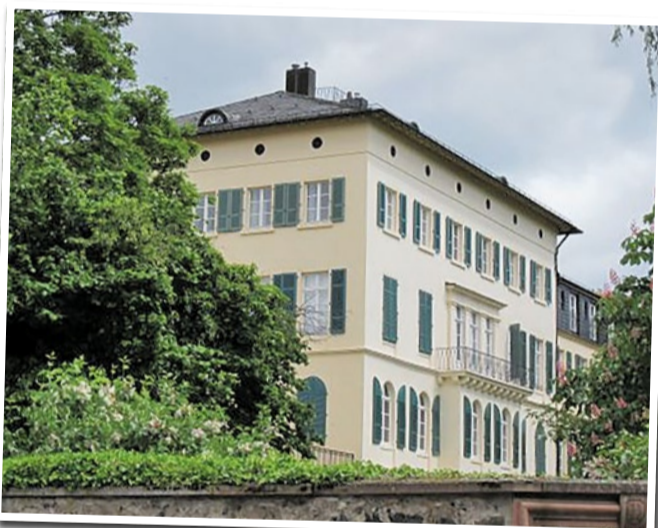
Historisches Herrenhaus auf römischen Fundamenten

Am Rande von Bonames lädt der Nordpark zum Durchatmen ein. Breite Wiesen, schattige Bäume und Spazierwege, die sich wie kleine Adern durchs