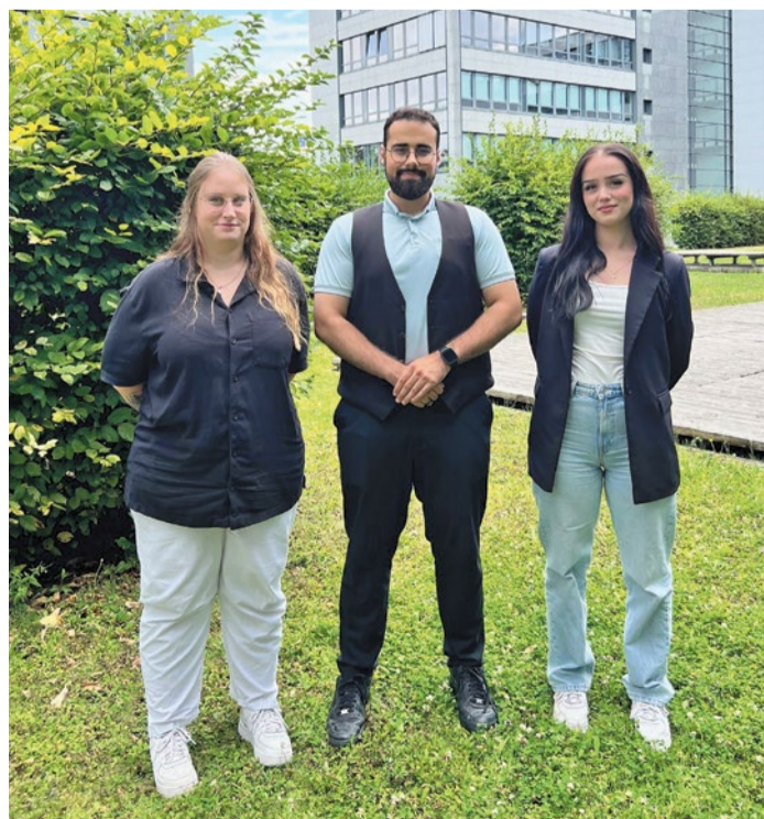
Das frische Team in Neu-Isenburg freut sich auf Wissen und die Integration im Unternehmen.

August beginnt die praktische Einarbeitung an den verschiedenen Standorten. Die Ausbil-