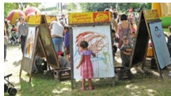
Malstände bei den Opernspielen.

INNENSTADT (RED) | Vom 2. bis 17. August verwandelt sich der Frankfurter Opernplatz wieder in ein großes Spielparadies – bei freiem Eintritt. Täglich von 11 bis 19 Uhr lädt das Kinderfestival „Kinder haben Vorfahrt!“ mit Wasserspielen, Klettermöglichkeiten, Hüpfkissen, Kreativecke, Bullriding und vielem mehr zum Mitmachen ein. Rund 1.000 Kinder nutzen täglich das von pädagogischem Personal betreute Angebot. Ziel der Aktion: Spielräume mitten in der Stadt schaffen. Infos: www.abenteuerspielplatz.de