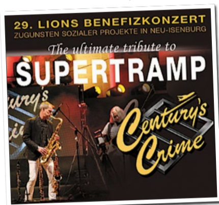
Benefizkonzert in der Hugenottenhalle (Plakattitel). GRAFIK: LIONS CLUB NEU-ISENBURG

Der Erlös unterstützt die sozialen Projekte der Lions-Stiftungen „Altenhilfe“ und „Jugend & Beruf“, die gemeinsam mit der Stadt Neu-Isenburg geführt werden. Das Konzert beginnt um 20 Uhr, Einlass ist ab 19 Uhr. Tickets gibt es für 22 Euro zuzüglich Vorverkaufsgebühr an der Hugenottenhalle und online. Die Veranstaltung ist bestuhlt, barrierefrei und bietet Getränke sowie Snacks vor Ort.