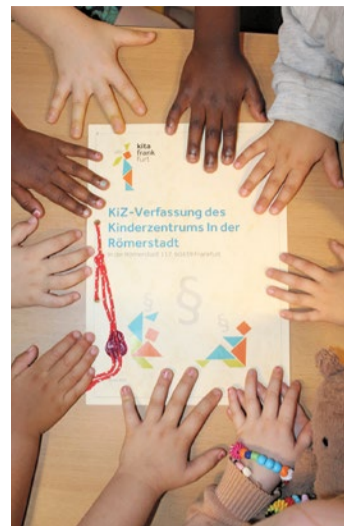
Die „KiZ-Verfassung“ des Kinderzentrums in der Römerstadt

Der Alltag im KiZ ist spürbar konfliktärmer – ein Erfolg für gelebte Kinderrechte bei Kita Frankfurt.